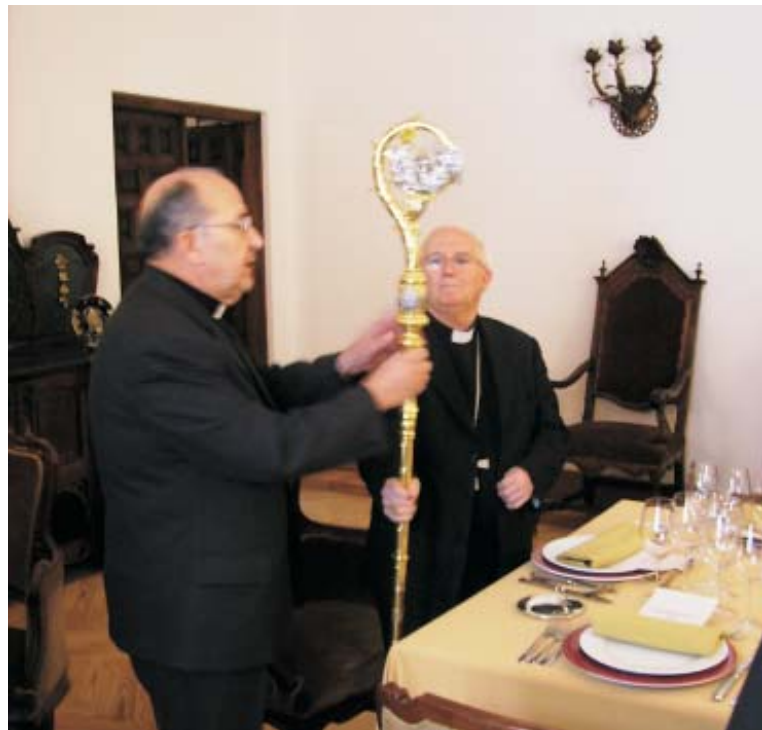
El Cabildo obsequió con un báculo al Sr. Cardenal, que le entregó el Sr. Deán.

La reunión, después del ofrecimiento del Sr. Deán, en nombre del Cabildo, y el agradecimiento cordial del Sr. Cardenal, derivó por los cauces pro-