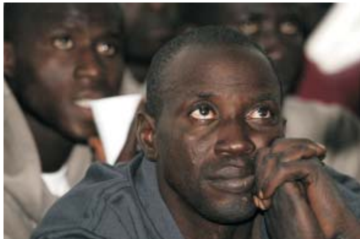
La inmigración hace que Seseña crezca cada día en habitantes.

Desde Cáritas Seseña queremos animar a otras personas que quieren poner su granito de arena en el mundo y recordarles que entre todos podemos cambiar la realidad.