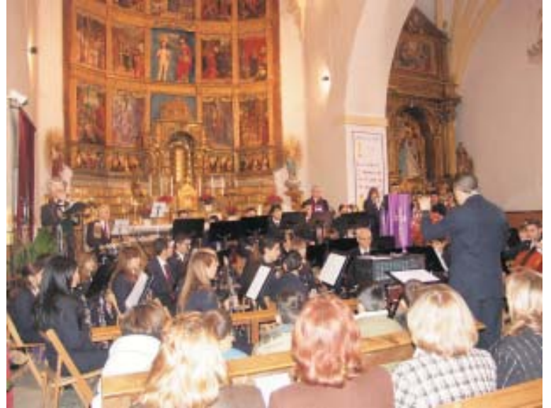
Concierto de la banda de música.

Para finalizar el día se hizo una rifa donde participaron todas las tiendas del municipio, donando objetos como trajes, vajillas, dulces... cada tira de