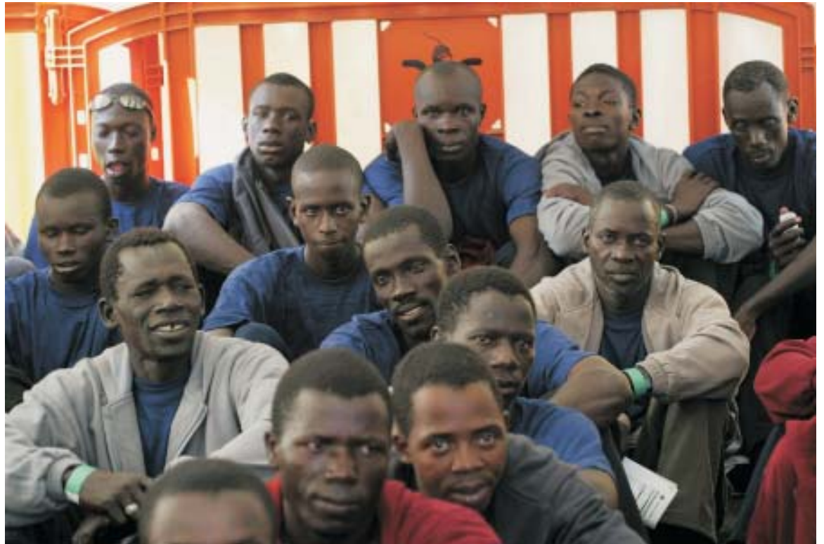
La localidad de Illescas, junto a otras de La Sagra, ha experimentado un fuerte incremento de la inmigración.

Entre las propuestas a realizar cabe destacar una exposición fotográfica que permanecerá todos los días de esta semana en el Nuevo Centro Cultural, recientemente inaugurado.