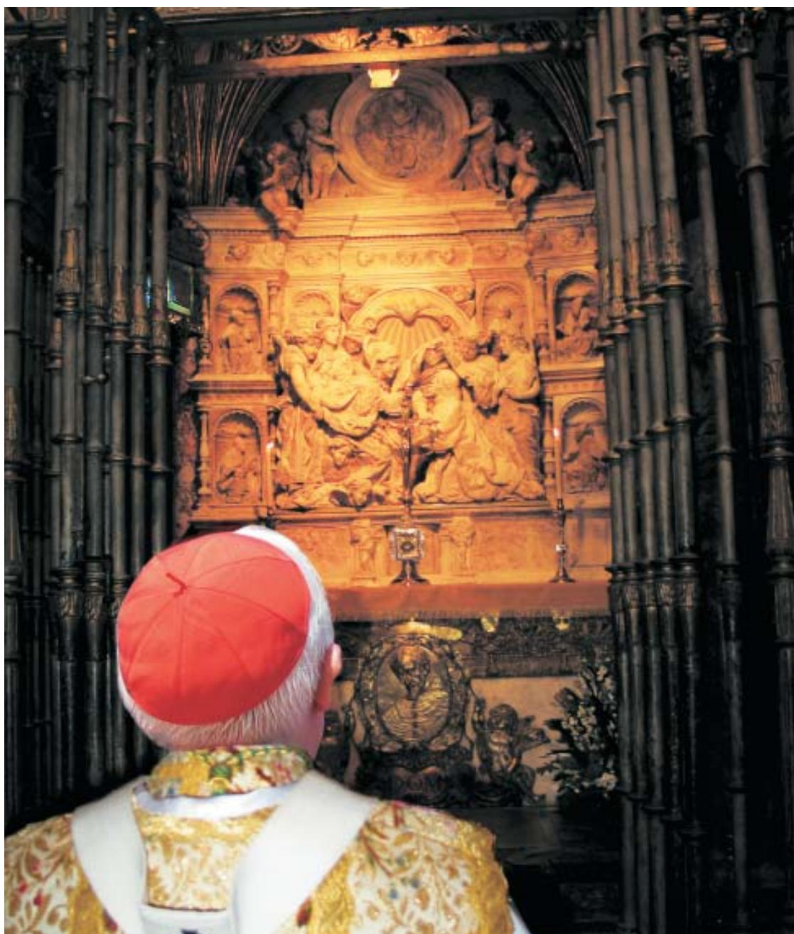
La reliquia de San Ildefonso es expuesta a la veneración de los fieles en la Capilla de la Descensión de la Catedral.