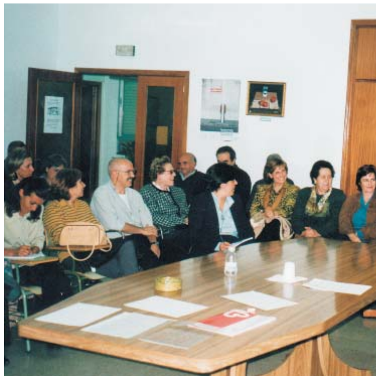
Grupo de voluntarios de parroquias de La Sagra.

Por esto Cáritas Diocesana pone un interés especial en cuidar al voluntario, reconociendo sus acciones sociales de la manera mas desinteresada. Tomando la conciencia de que nuestra sociedad no está preparada para afrontar las injusticias ni las situaciones de exclusión, los voluntarios tienen la capacidad de ser quienes, formados técnica y humanamen-