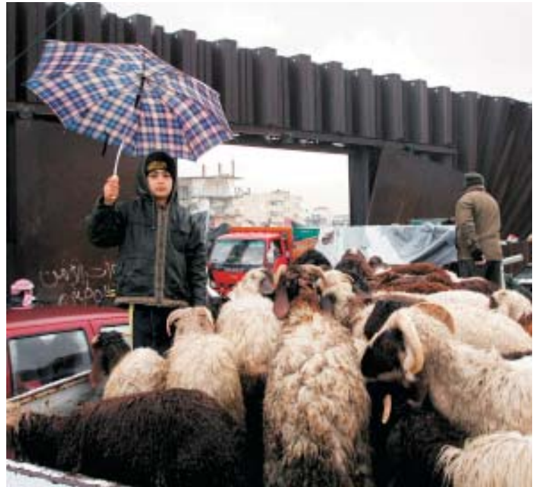
Un niño intenta curzar, con su rebaño, el muro que separa Belén.

Las Misioneras Franciscanas de María, conocedoras de esta difícil situación, tratan de ayudar a las familias más pobres, aliviando la permanente situación de tensión, intranquilidad, estrés y trauma prebélico, foco de fracasos, rupturas familiares, violencia... Emprendieron la rehabilitación de casas abandonadas de la vieja Belén, pequeñas, sencillas, de piedra y adobe, inhabitables por humedades, goteras, ruina, pro-