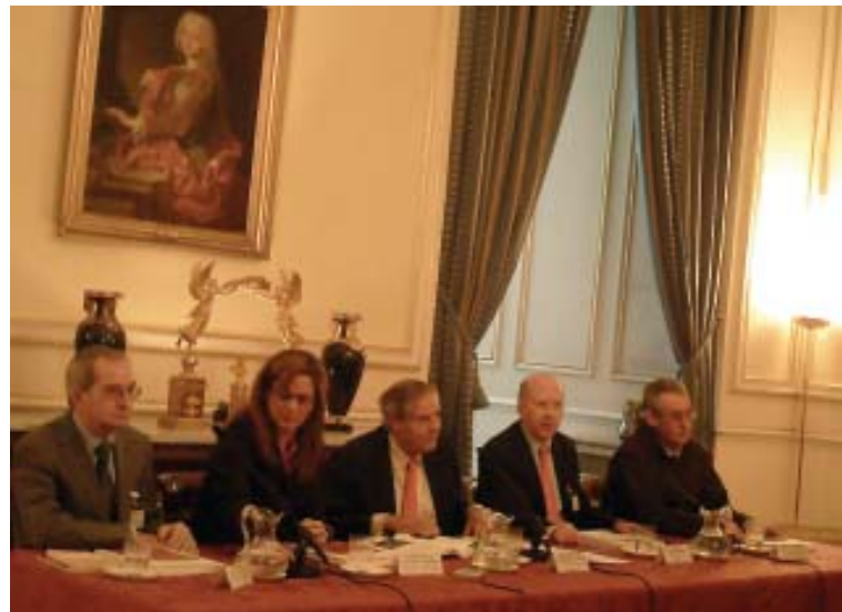
La exposición fue presentada en el Palacio Real.

Y, en el comienzo de mi tercer año en estas hermosas tierras de la Amazonía Peruana, reanudo tareas de ayuda a la Misión, tanto en Formación Bíblica y Catecumenado, como en el COF, sin dejar abandonadas la preparación del cercano inicio de actividades en el Colegio y en el Seminario.