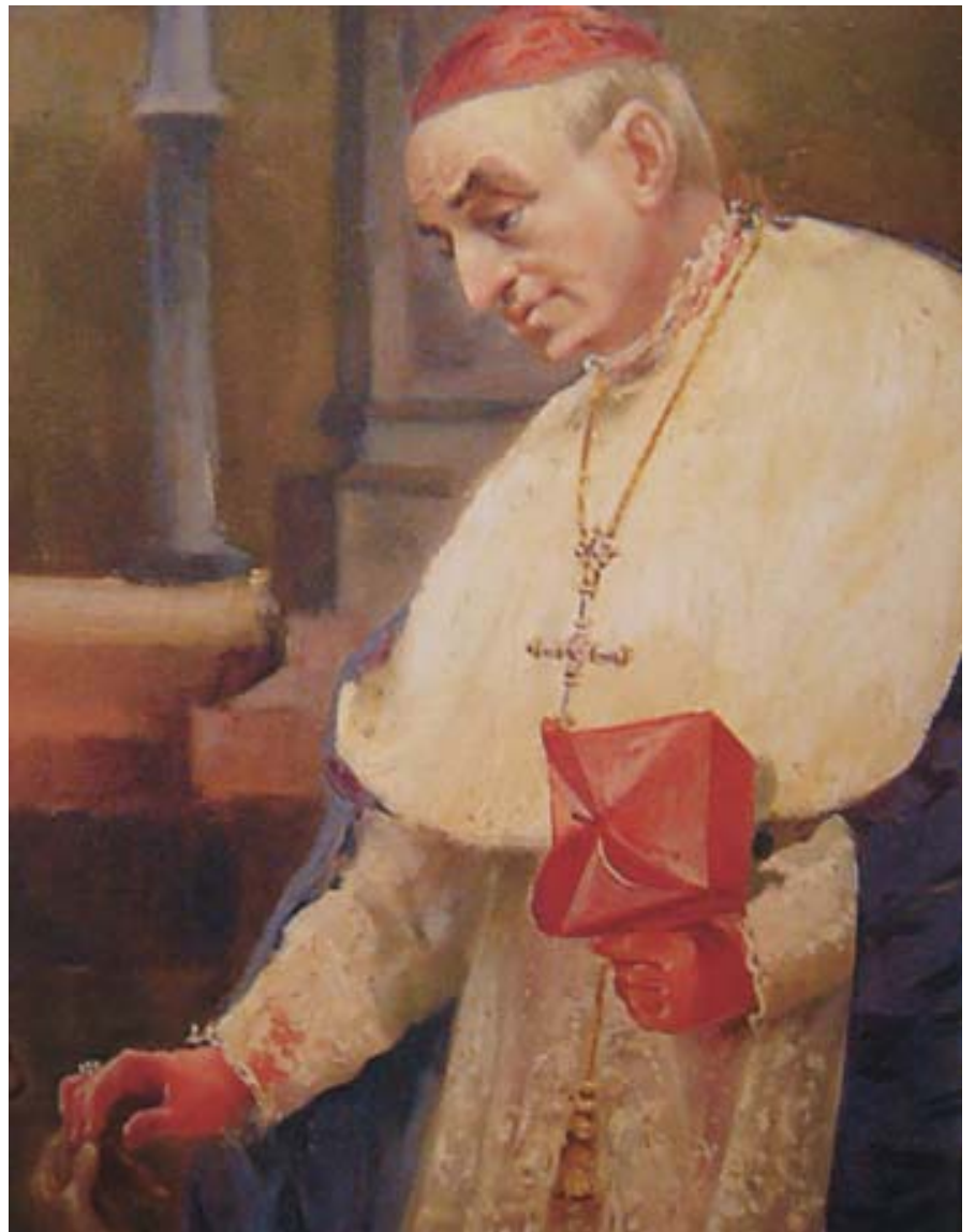
El Cardenal Sancha vivió pobre y «pobrísimamente murió».