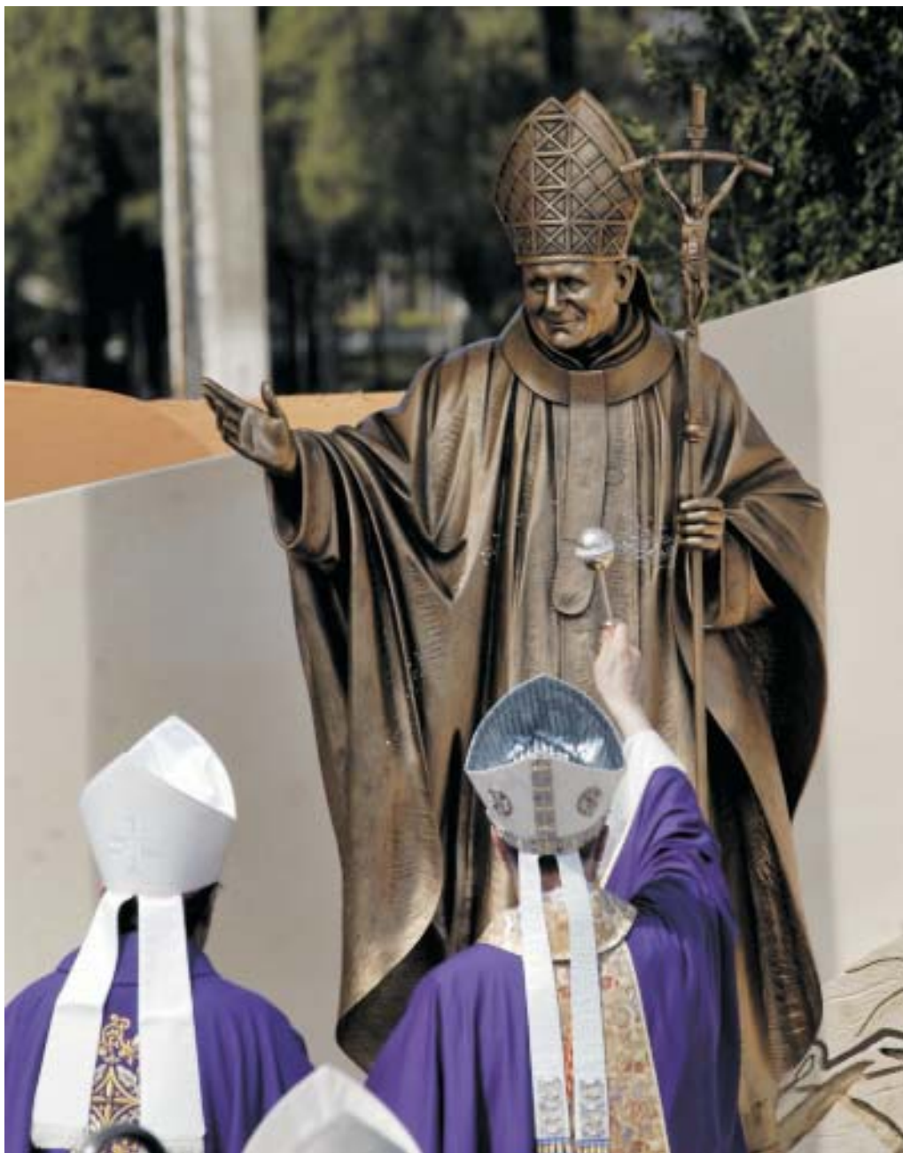
El Cardenal Bertone bendice la estatua de Juan Pablo II, en recuerdo de su visita a Cuba hace diez años.