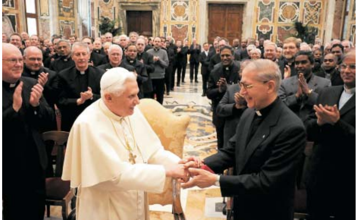
El Papa saluda al P. Adolfo Nicolás, elegido Preposito General de la Compañía, al recibir a los Jesuitas en el Vaticano.

«Mientras tratáis de construir puentes de comprensión y