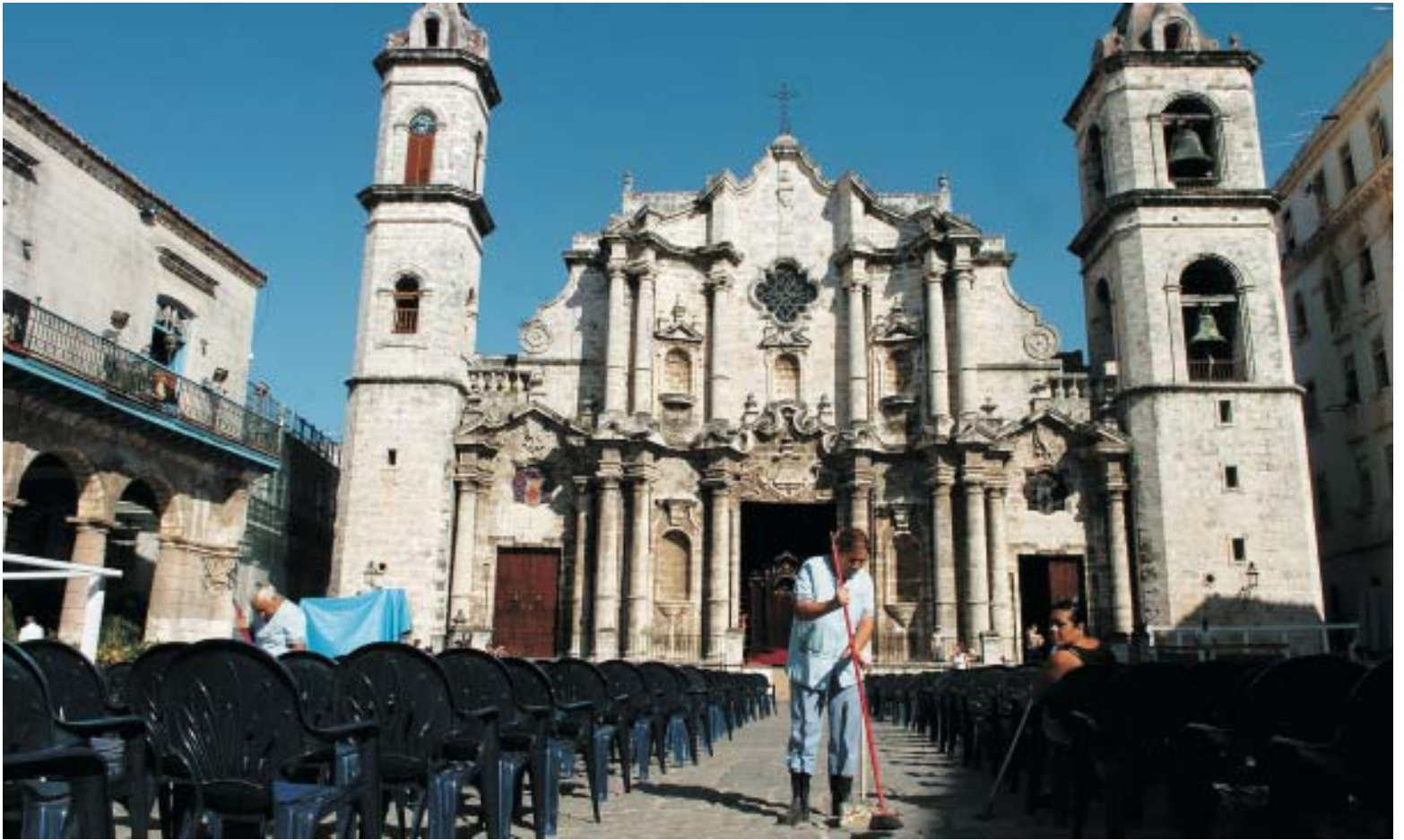
Una mujer barre la Plaza de la Catedral de La Habana, antes de que el cardenal Tarcisio Bertone, presida la Santa Misa.

no del Papa en la guía de la Santa Sede esperó asimismo que se dé un «nuevo impulso a las relaciones entre el Estado y la Iglesia católica en Cuba».