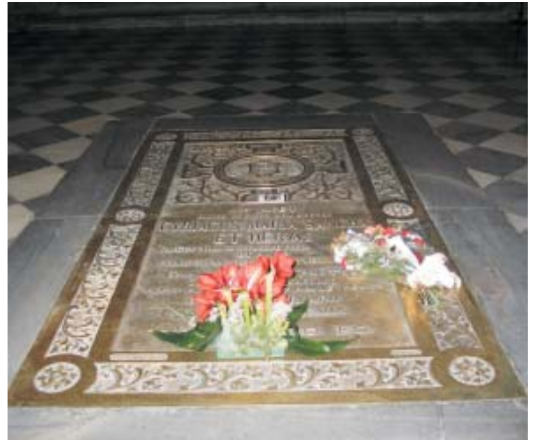
En la lápida sepulcral del Cardenal Sancha, que se encuentra frente a la entrada de la capilla de San Pedro, en la Catedral Primada, siempre hay flores.

Además, Sancha «fue el gran impulsor del movimiento católico en España, de lo que hoy llamaríamos la presencia de los católicos en la vida pública, y del catolicismo social». Por eso «su influencia benéfica en pro-