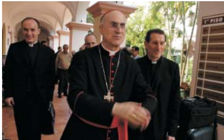
El Cardenal Bertone, tras una reunión con sacerdotes en La Habana.

A continuación, el cardenal Secretario de Estado mantuvo un coloquio con los obispos en el que, como él mismo anunció, se buscaba dialogar sobre el «importante aspecto de las relaciones entre la Iglesia y el Estado».