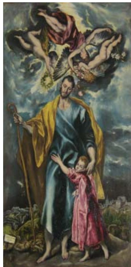
El Greco, «San José».

La figura amable de san José ha propiciado también el compromiso de los