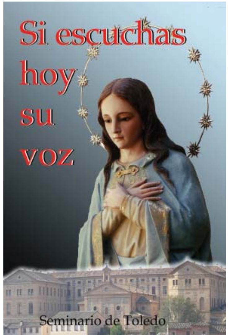
Es responsabilidad de todos la colaboración generosa con el Seminario.

La Iglesia no puede vivir sin sacerdotes y los sacerdotes se hacen en el Seminario.