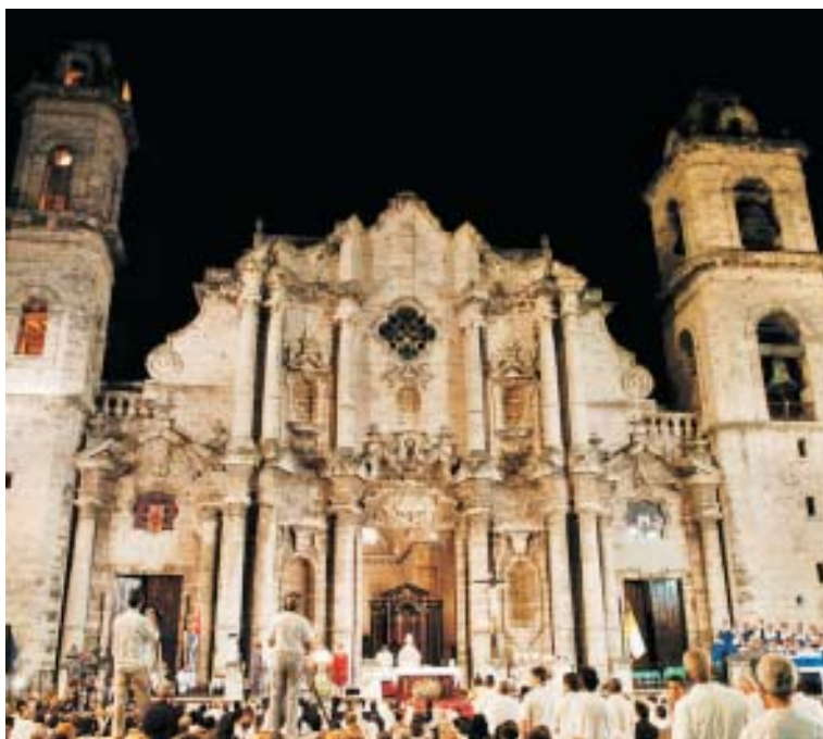
El cardenal Bertone presidió la Santa Misa en La Habana.

«Me parece que se dan las perspectivas para un trabajo conjunto de confianza en la acción de la Iglesia y de posibilidad de apertura de nuevos es-