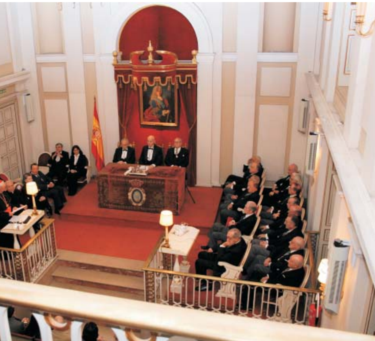
te los Sres. Académicos y diversas personalidades eclesíásticas y civiles.

El Sr. Cardenal se preguntó qué sería de España si olvidando sus orígenes dejara de ser cristiana: «Contemplar aquellos orígenes y contemplar a España en sus orígenes nos ayuda a comprenderla en su decurso histórico, como también nos ayuda hoy a mirar hacia el futuro desde esta mirada surge espontánea la pregunta: ¿Será cristiana la España del mañana? Lo será en cuanto se mantenga en sus raíces, en cuanto mantenga viva su memoria y su identidad, pero aún podríamos preguntarnos con mayor radicalidad: ¿Será España si deja de ser cristiana, si renuncia a la memoria de los orígenes que le dieron lugar y existencia, esto es, si renuncia a sus raíces y fundamentos cristianos?»