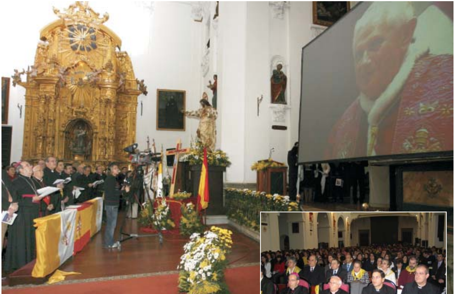
Los jóvenes toledanos ofrecieron dos testimonios que fueron retransmitidos en directo.

«Sed discípulos y testigos del Evangelio, porque el Evangelio es la buena semilla del Reino de Dios, germen de la civilización del amor». Así se dirigió Benedicto XVI a los cuarenta mil universitarios de Europa y América que, el pasado 1 de marzo, celebraron una Vigilia Mariana de Oración y que mediante conexión vía satélite se unieron a la celebración que presidía el Papa en el aula Pablo VI de El Vaticano. Dos mil jóvenes de nuestra diócesis se congregaron en la iglesia de los Padres Jesuitas, de Toledo, presididos por el Sr. Cardenal. Toledo era una de las diez ciudades del mundo que se conectaron con la Santa Sede (PÁGINA 9).