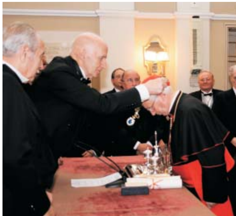
Don Antonio recibe la medalla de académico.

«Aquellos hechos y personajes de la historia -precisó- sobre todo el Concilio III de Toledo, han creado futuro, han constituido España, produciendo unidad a partir de la fuerza del espíritu, han hecho de ella ese acontecimiento espiritual que somos, y han forjado durante siglos aquel proyecto sugestivo de vida en común, que ha llevado a cabo tantas empresas y aportado tantos bienes a otros lugares, manteniendo toda su capacidad para continuar aportándolas y abriendo caminos de futuro».