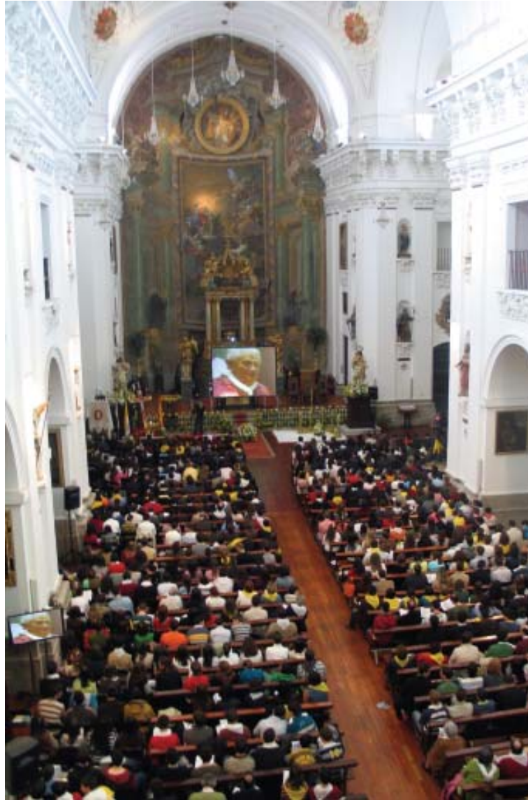
Un detalle de la iglesia de los jesuitas, que acogió a 2.000 jóvenes.

Durante su intervención, el Papa afirmó que el cristianismo constituye un «lazo fuerte y profundo» entre el llamado viejo continente y el nuevo mundo