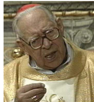
Don Marcelo, predicando en su última misa en Catedral Primada.

En Valladolid desempeñó una labor social que todavía hoy se recuerda, muy ligado a Acción Católica, a Cáritas y a las necesidades de la clase trabajadora en la posguerra. En estos años también ejerció la docencia dando clases de Teolo-