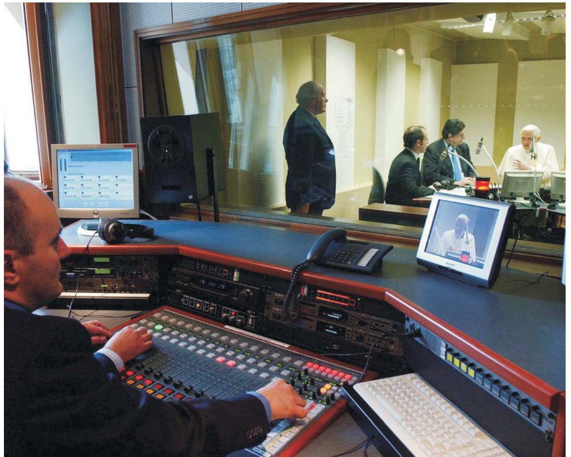
El Papa Benedicto XVI es entrevistado durante una visita a los estudios de Radio Vaticano.