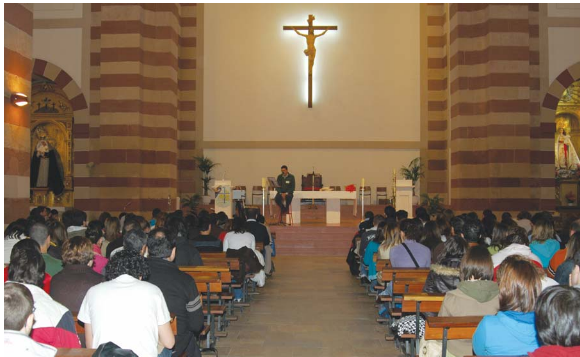
Los jóvenes participantes en el encuentro, en momento de oración.