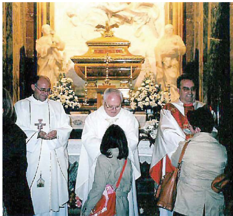
Los tres sacerdotes recibieron la felicitación de los fieles.

Don Carmelo animó a todos a unirse a la acción de gracias de estos tres sacerdotes y a perseverar en la oración para que, también ahora en este arciprestazgo el Señor deje oír su voz, y como en otro tiempo, ahora también susciten voca-