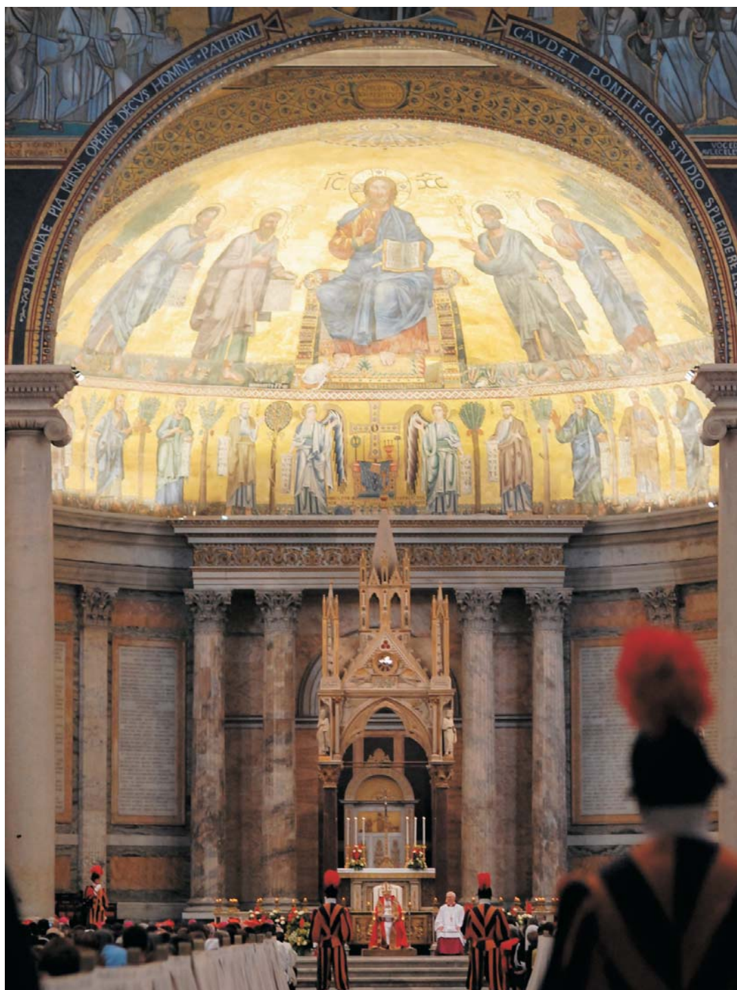
Benedicto XVI anunció la celebración del Año Jubilar, el año pasado en la basílica de San Pablo extramuros.