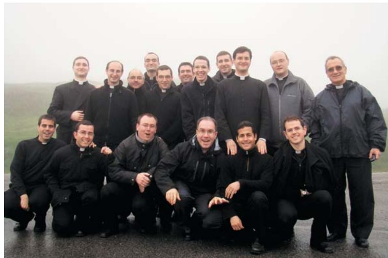
El grupo de seminaristas, con el Rector, en Roncesvalles.

También visitaron la colegiata de Nuestra Señora de