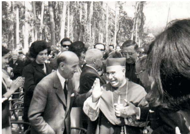
El Cardenal, en una visita a Talavera de la Reina.