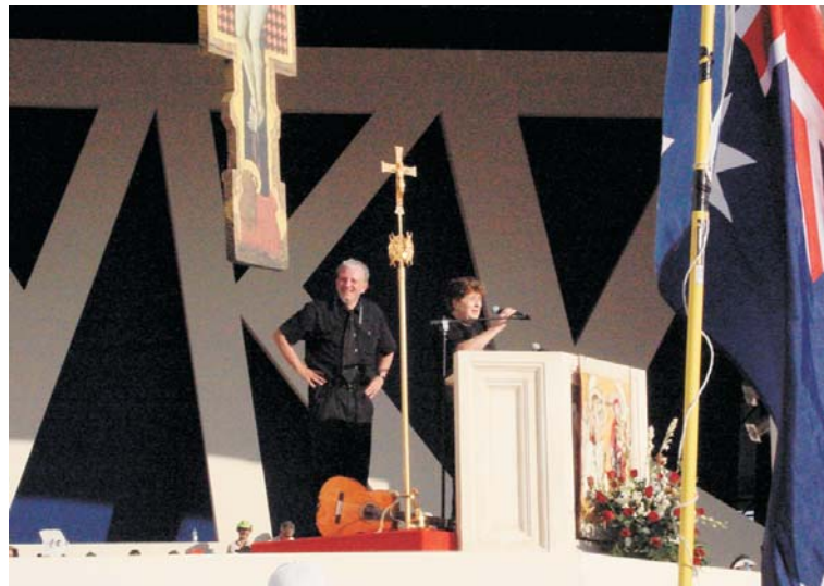
Kiko Argüello y Carmen Hernández en una celebración.

Por otra parte, Argüello consideró que la relación entre los obispos y el Camino Neocatecumenal seguirá siendo buena en el futuro, gracias ahora también a los Estatutos definitivos.