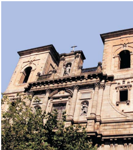
Iglesia de los PP. Jesuitas, en Toledo.

—Voy muy contento a Toledo cuando la obediencia me envía. ¿Sabe por qué? Pues por la Virgen del Valle. ¿Usted la conoce? Mire, es una ermita pequeña, al otro lado del Tajo, muy devota. Es un paseo muy agradable; hay que bajar una cuesta, pasar el río y, al otro lado, allí entre las peñas, escondida y muy chiquita, está la ermita de la Virgen. Allí, a sus pies, he descansado