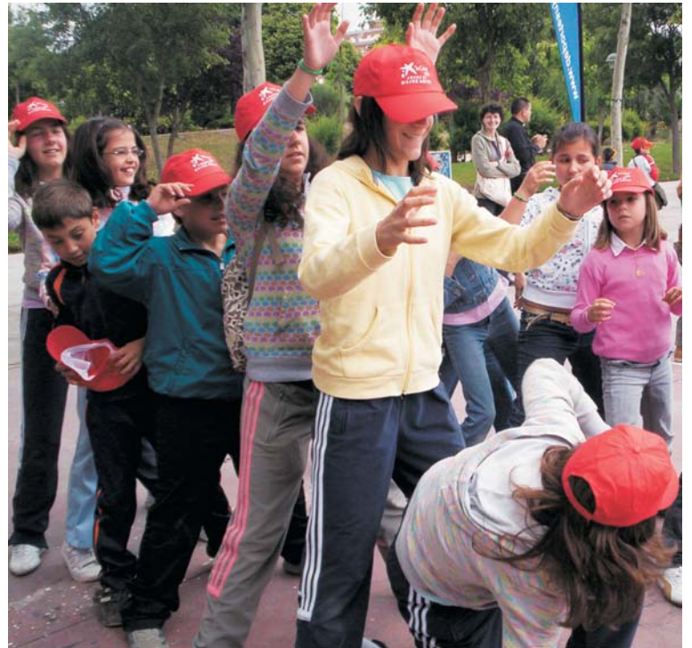
Los niños y niñas asistentes participaron en diversos juegos.

Pasaba por la calle. Dentro del salón se encontraba un grupo no pequeño de evangélicos presbiterianos. Pude oír, muy claramente, cómo el conferenciante decía: «¿En qué nos hemos equivocado?» Hubiera sido bueno poder contestarles: «En todo, hermanos, en todo».