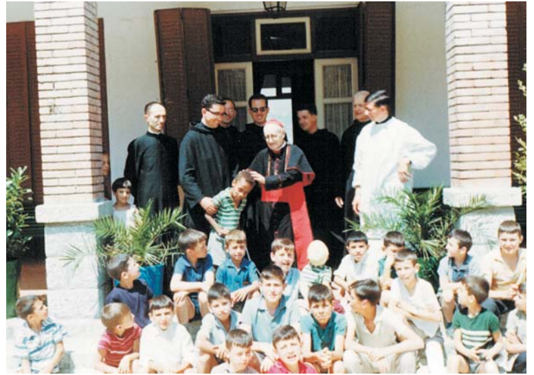
El Cardenal Pla y Deniel acaricia a un niño en la visita a un internado.