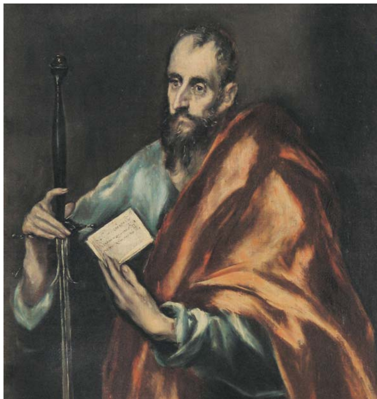
El Greco, «San Pablo». Sacristía de la S. I. Catedral Primada

Asimismo, el Santo Padre anunció que se organizarán