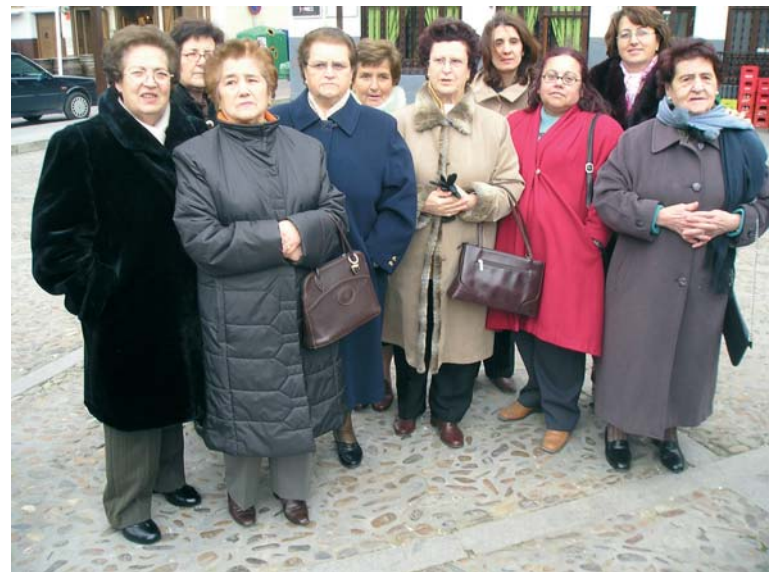
Algunas voluntarias de Manos Unidas de Turleque.

Todos los años colaboramos con el proyecto que nuestro arciprestazgo asume. Así, este año, en el mercadillo local de los martes hemos distribuido manos y pies de cartulina recortada a un euro, para llenar un panel, con el que acudimos hasta Consuegra para una actividad común el pasado 17 de febrero. El sábado 9 se realizó una Marcha Solidaria por el