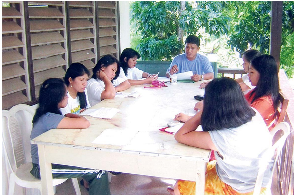
Unas mujeres jóvenes de la comunidad, en Manila, reciben formación.

Es complicado acceder al agua potable, así como a la electricidad. Carecen de empleo por falta de capacitación técnica. Algunos se dedican a labores de limpieza, recogida de basuras... Se quiere mejorar su situación irregular con este programa de educación y capacitación, de 3 años, para que conozcan sus derechos y velen para que éstos sean respetados. Manos Unidas aporta materiales necesarios y salarios del personal formador y de asistencia legal. Beneficiarios directos son 1.300 personas; los indirectos superan las 50.000. Se busca organizar a la población de