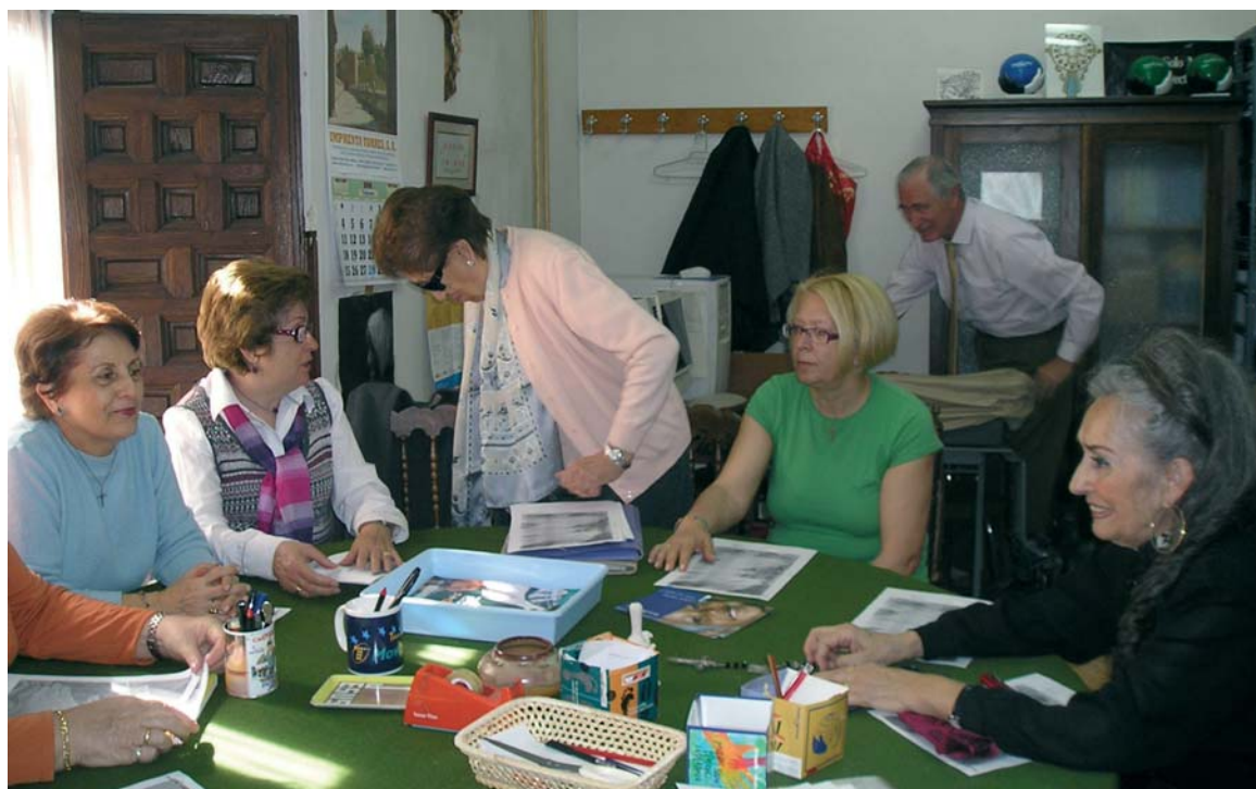
Reunión preparatoria de actividades en la Delegación Diocesana de Manos Unidas

Pronto comenzaron a financiarse proyectos desde Toledo y a crearse enlaces en parroquias de los pueblos, haciendo su propia recaudación y sensibilización. Y así, se amplían trabajo y actividades año a año, hasta la configuración actual de la delegación diocesana de Manos Unidas, una gran familia, con sus delegaciones locales y delegadas parroquiales (en la actualidad 89), financiándose proyectos de desarrollo (17 en 2008) y sensibilizando a la so-