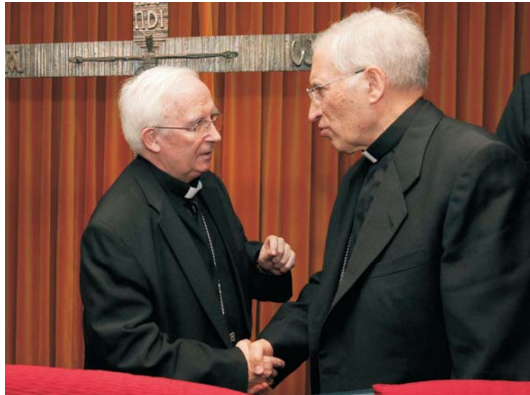
El Sr. Cardenal y Rouco se saludan al comienzo de la Asamblea.

Es necesario examinar «si el relativismo moral no ha fomen-