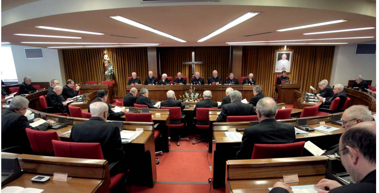
Los obispos españoles, reunidos en la Plenaria del pasado mes de noviembre eligieron a la ciudad de Toledo como sede del Congreso.

ASAMBLEA PLENARIA de la Conferencia Episcopal Española