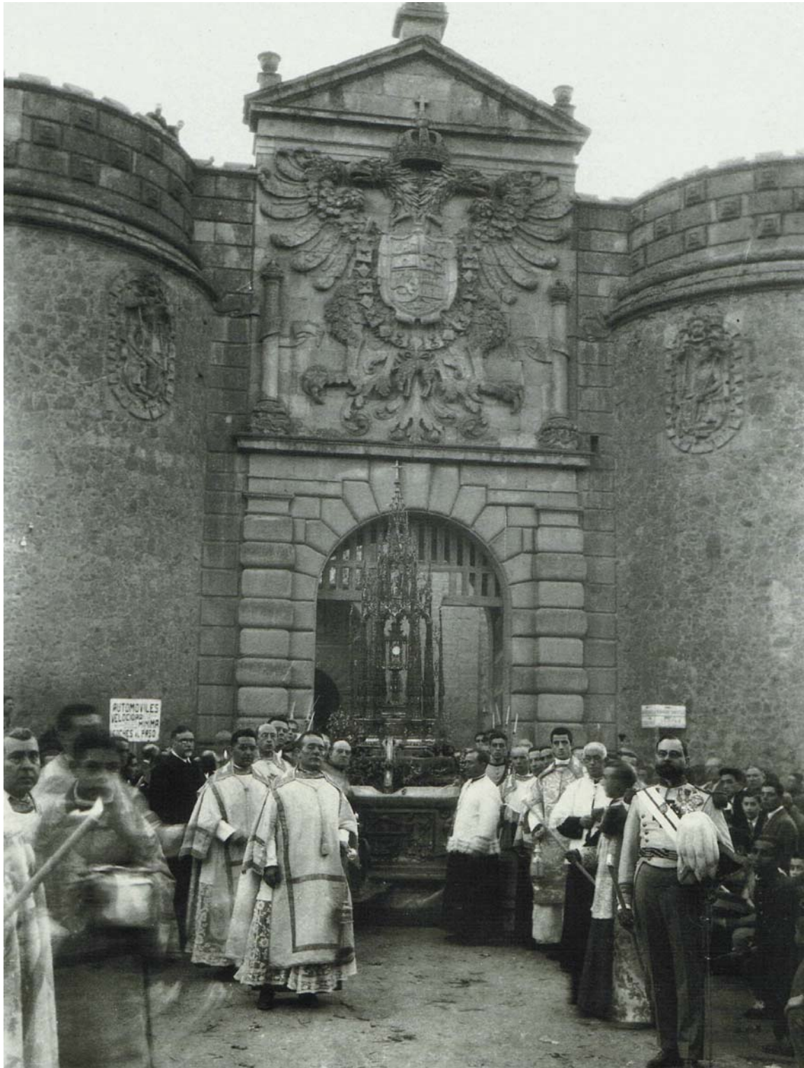
La Custodia de Arfe, con el Santísimo Sacramento, salió en procesión multitudinaria el día 24 de octubre de 1926.

A las dos de la tarde dió comienzo la procesión con el Santísimo, que presidía el Infante Don Fernando, en representación del Rey, y a la que asistían los ministros de Gobernación, Instrucción y Justicia. La custodia de Arfe salió por la Puerta Llana y recorriendo las calles Arco de Palacio, Hombre de Palo, Zocodover, Cuesta de Armas, Arrabal y Paseo de Merchán, llegó a la Vega Baja, donde se había congregado miles de fieles para participar en los actos de la Bendición final.