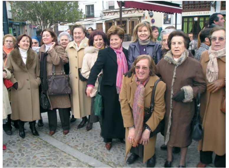
Algunas mujeres de la delegación de la localidad manchega.

Manos Unidas, con el mismo entusiasmo con que empezó hace casi 50 años a trabajar, quiere continuar en Consuegra, para que la esta obra tan maravillosa de la Iglesia perdure, que poniendo todo nuestro corazón. Con la ayuda de Dios y la Santísima Virgen no nos cansare-