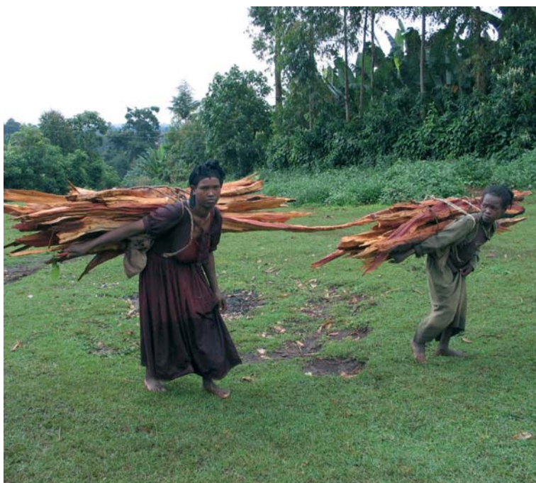
Dos mujeres jóvenes acarrear pesos fardos de madera, en Etiopía.

En la ciudad de Toledo habrá una Cena del Hambre, en un lugar aun por determinar. En ella se leerá el manifiesto de la Campaña y se hará un acto de concienciación sobre la realidad del hambre en el mundo, teniendo presentes a los millones de personas obligados a ayunar por