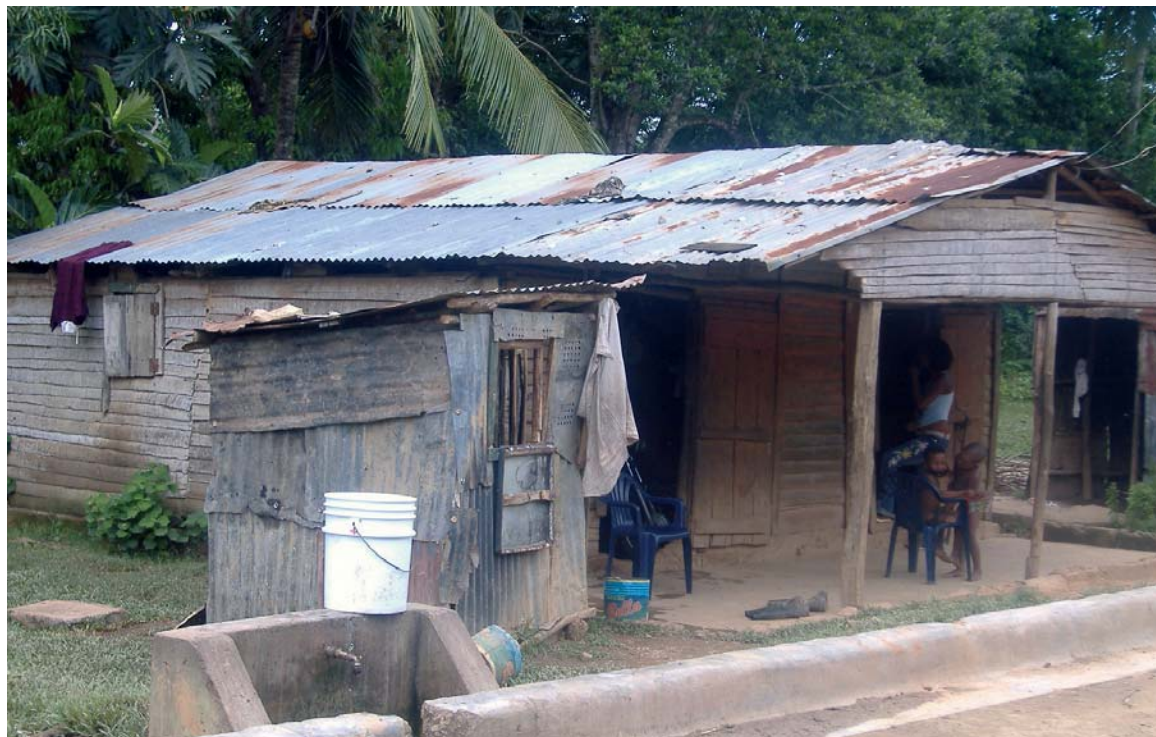
Unos niños, en la entrada de su casa en una comunidad rural de Cevicos, en República Dominicana.

Se pretende mejorar la calidad de vida y atención sanitaria, capacitando a promotores