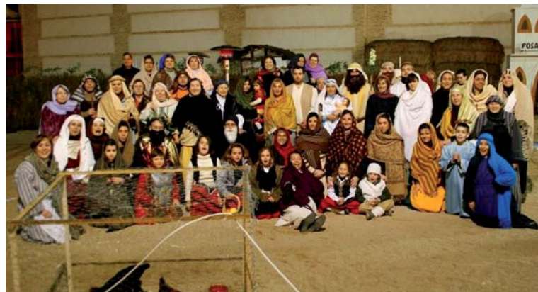
Algunos de los participantes en el Belén viviente de Torrijos.

El Belén mostraba Nazaret y Belén, con los oficios y la actividad de la época, todo ello impregnado en un ambiente de Navidad, La anunciación, la panadería, la zapatería, las castañeras, el mercado, empadronamiento por el emperador Cesar Augusto, la anunciación a los pastores, escena de Herodes, lavanderas, el río, (los visitantes lo cruzaban por un puen-