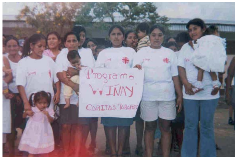
Madres en «Casa de Espera», en la parroquia de San José de Sisa.

A la espera de que en los Servicios Centrales sean aprobados más proyectos y desde la delegación diocesana puedan ser asumidos, Manos Unidas en Toledo está atenta a esta realidad misionera, cercana desde la oración y el cariño, velando por el desarrollo de estas jóvenes iglesias locales y deseando se presenten más proyectos, pues son muchas las carencias de aquellas tierras.