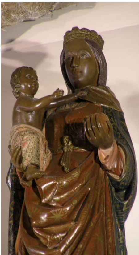
Nuestra Señora de la Asunción, de Arisgotas.

Los orgaceños eran impotentes para oponerse a las frecuentes visitas de las milicias procedentes de Mora, el pueblo vecino. El día 6 de agosto de 1936, una nueva partida de milicianos de Mora, en