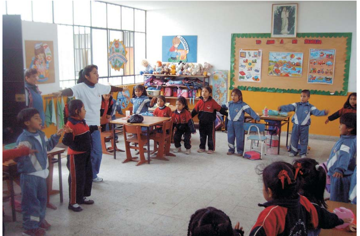
Actividad infantil en la biblioteca del Centro «Semillas de Esperanza», en Villa El Salvador.

Con la microempresa, se dará trabajo a más de 50 mujeres campesinas madres de familia, venidas de la zona andina, en busca de un futuro mejor. Distribuirán lo producido –60.000 «pancitos» mensuales–