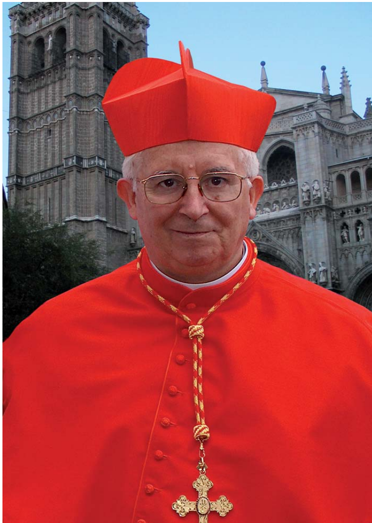
Don Antonio Cañizares, ante la Catedral Primada, tras ser nombrado Cardenal.

Ya por la tarde, hacia las 17:30 h., será recibido en la Puerta de Bisagra de la ciudad de Toledo por el Alcalde y las autoridades civiles. Desde allí, en vehículo descubierto, se dirigirá a la Catedral, donde, en el atrio, le esperarán el Sr. Cardenal y el Cabildo Primado. Entrará en el templo por la Puerta de Reyes, tras realizar el tradi-