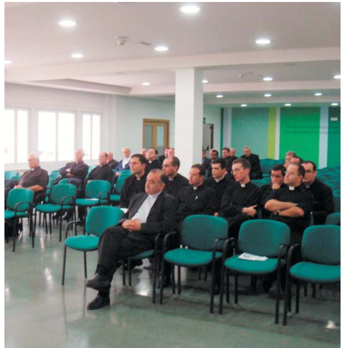
Algunos de los sacerdotes de la vicaría de Talavera de la Reina.