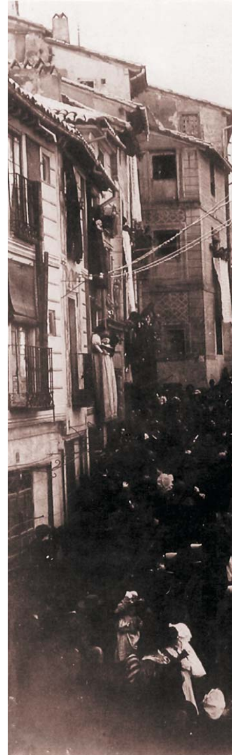
Entrada del Cardenal Sancha en Toledo como Arzobispo.

terapia; no fue posible aplicarla a la enferma el día señalado porque estaban dañados los aparatos del Oncológico en Santo Domingo.