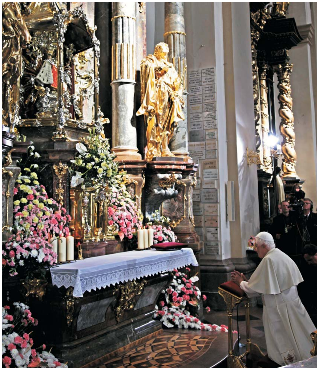
Benedicto XVI, ante la imagen del Niño Jesús de Praga, el pasado 26 de septiembre.

«Recemos –añadió– por las familias en dificultad, probadas por la enfermedad y el dolor, por las que están en crisis, separadas o laceradas por la discordia y la infidelidad. Todas las confiamos al Santo Niño de Praga, sabiendo lo importante que es su estabilidad y su concordia para el progreso de la sociedad y el futuro de la humanidad».