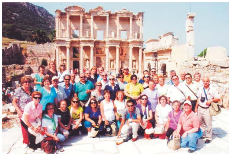
El grupo, ante los restos romanos de Éfeso, frente a la Biblioteca de Celso

Esta peregrinación se ha convertido en un viaje que marcará la vida de los peregrinos tanto por los lugares que han