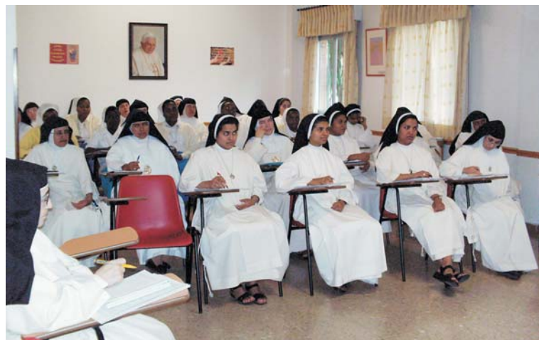
En la foto superior, algunas de las participantes, en la iglesia de la Casa Madre. Debajo, una de las sesiones del cursillo.

■ PARTICIPARON 40 PEREGRINOS DE LA PARROQUIA DE ILLESCAS