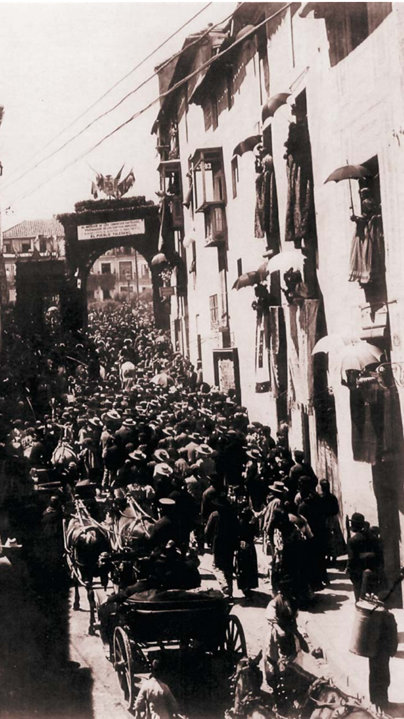
Obispo de la sede primada, el 5 de junio de 1898.

La enferma estaba llegando al punto de la desesperación. Sor María Encarnación, el 17 de febrero de 1982, después de llamar nuevamente al Oncológico y ser informada que todavía no se había solucionado el problema, se dirigió a la capilla y encomendó el caso a Ciriaco Sancha con mayor insistencia, con la convicción de que su padre fundador podía interceder.