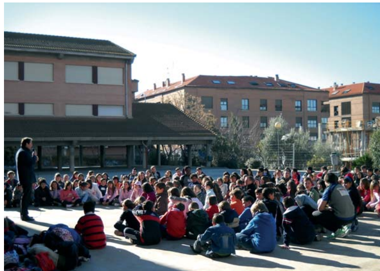
Una de las actividades de los niños durante la jornada.