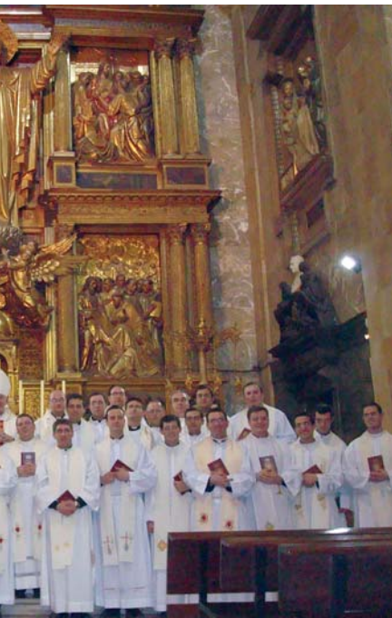
esa la Eucaristía de clausura del encuentro.