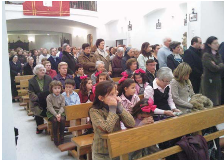
Numerosos asistentes en la celebración de Talavera de la Reina.

También las Marías de los Sagrarios, la adoración nocturna con sus respectivas banderas hicieron que el aniversario fuera más bonito, y fraterno.