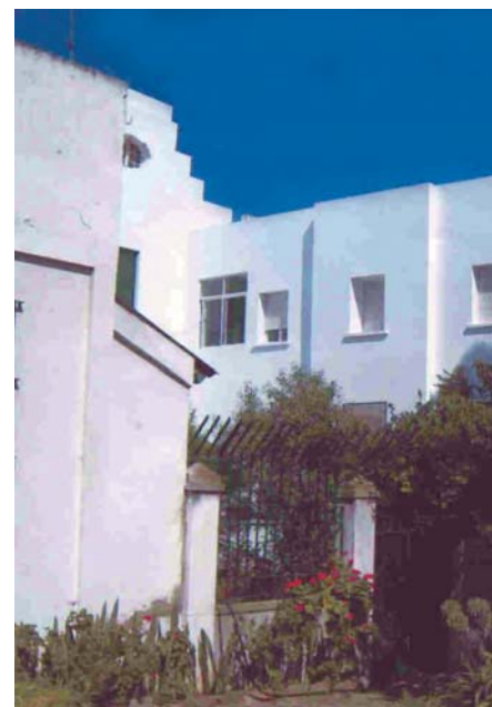
Aspecto exterior del hospital que regentan las Misi