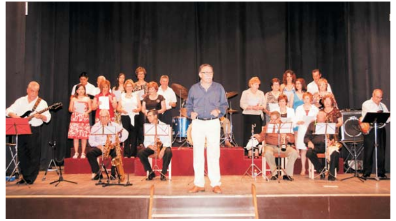
Un momento del concierto en el Teatro Principal.