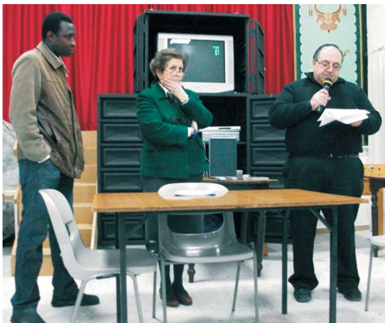
Cena del hambre celebrada en Huerta de Valdecarábanos.

Por su parte, la parroquia de Huerta de Valdecarábanos, en el arciprestazgo de Ocaña, organizó un rastrillo solidario, del