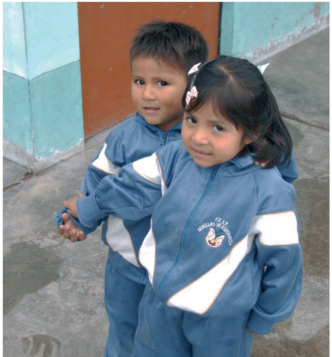
Dos niños, con sus manos unidas, del centro «Semillas para la Esperanza», en Perú, financiado desde Toledo.