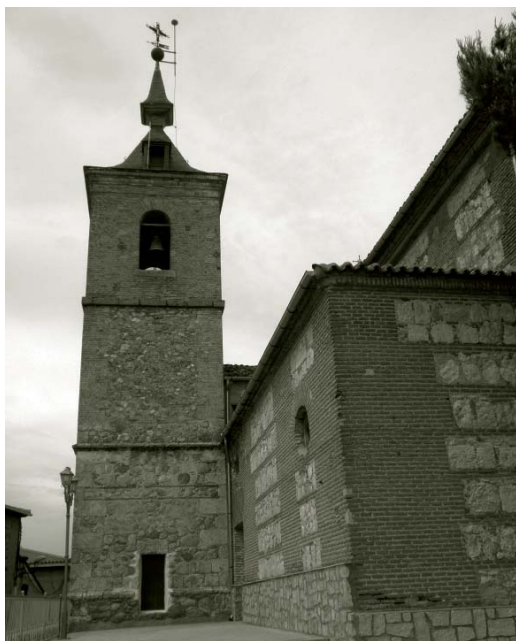
Iglesia de Santa Cruz del Retamar.

Es verdaderamente hermoso que una crónica, aunque sea de un periódico católico (de hecho de otros sacerdotes no se encuentran tales