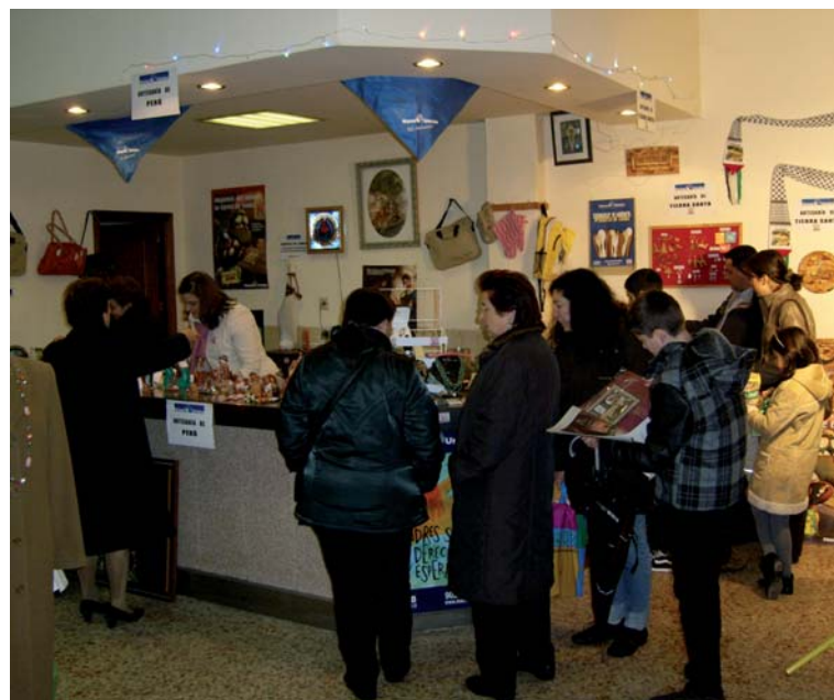
Mercadillo solidario realizado en Belvís de la Jara.