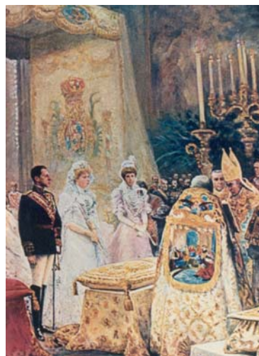
Boda del Rey Alfonso XIII.