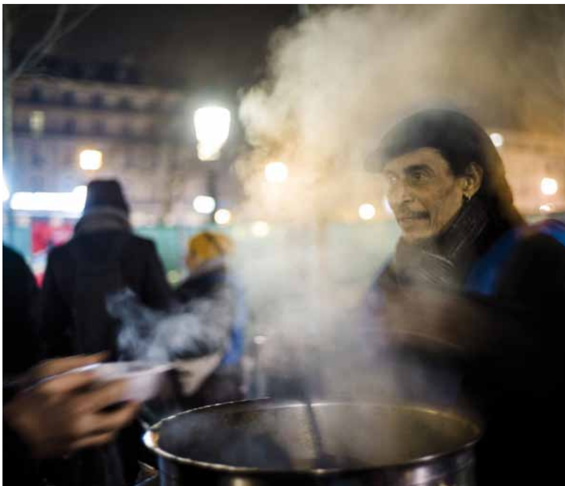
Un voluntario de la organización Emaus, ofrece una taza de sopa a una persona sin techo el pasado 13 de febrero, en París.