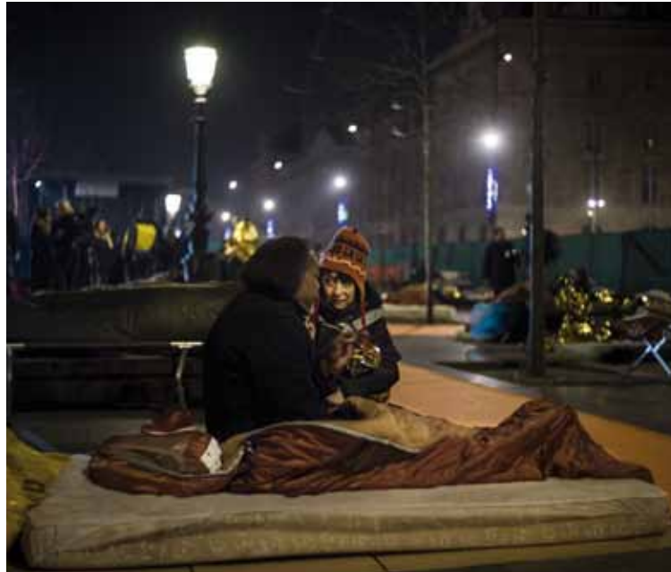
Una voluntaria de la organización Emaús conversa con una mujer sin techo en la plaza República de París, en la noche del pasado 13 de febrero.

Con este Informe, Caritas Europa cuestiona duramente el discurso oficial, que sugiere que