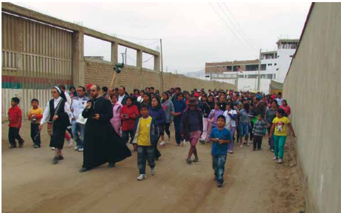
Un sacerdote misionero de nuestra archidiócesis de Toledo, en procesión con fieles de su parroquia en Villa El Salvador, en Perú.

Desde la Delegación Diocesana de Misiones de Toledo, la Dirección Diocesana de Obras Misionales Pontificias (OMP) en Toledo y la ONGD Misión