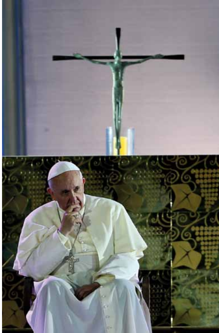
El Papa Francisco durante la Vigilia de Oración en la JMJ de Río

De este modo recuerda que los primeros capítulos del libro del Génesis nos presentan la espléndida bienaventuranza a la que estamos llamados y que