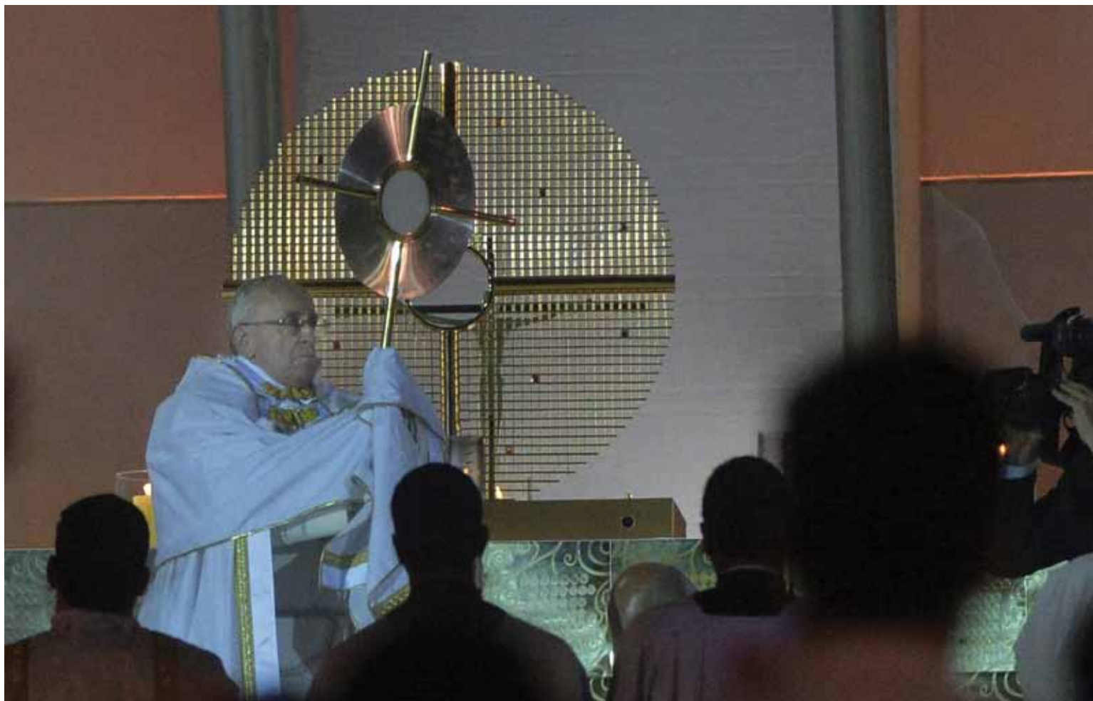
Bendición con el Santísimo Sacramento en la Jornada Mundial de la Juventud, en Rio de Janeiro

do, el Pontífice recuerda que en la cultura de lo provisional, de lo relativo, muchos predicán que lo importante es «disfrutar» el momento, que no vale la pena comprometerse para toda la vida, hacer opciones definitivas, «para siempre», porque no se sabe lo que pasará mañana.