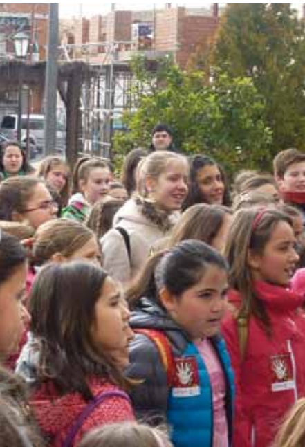
ada, Fuensalida y Sonseca.