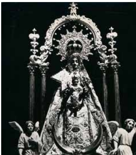
Virgen de la Paz, de Numancia de la Sagra.

«El Castellano» del 17 de enero de 1914, nos presenta al Siervo de Dios participando de una tradición que se mantiene en este pueblo: «El día 8 de este mes fueron todos los reclutas del actual reemplazo a la iglesia parroquial con el fin de despedirse de su queridísima patrona la Virgen Santísima de