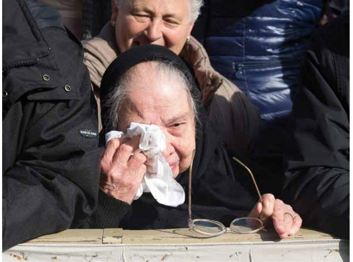
Una mujer anciana llora emocionada tras escuchar al Papa en su catequesis sobre la ancianidad, el pasado 4 de marzo.

La cultura del descarte —ecplícó— considera a los mayores un lastre, un peso, pues no sólo no producen, sino que además constituyen una carga y, aunque no se diga abiertamente, a