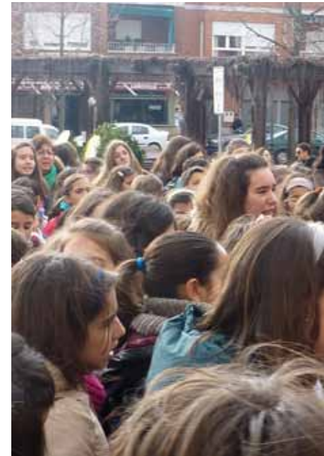
Niños de numerosas parroquias se reunieron en Mejorada

Este año las condiciones del tiempo no han sido del todo favorables: Mucho frío en Fuensalida, niebla y una poca lluvia