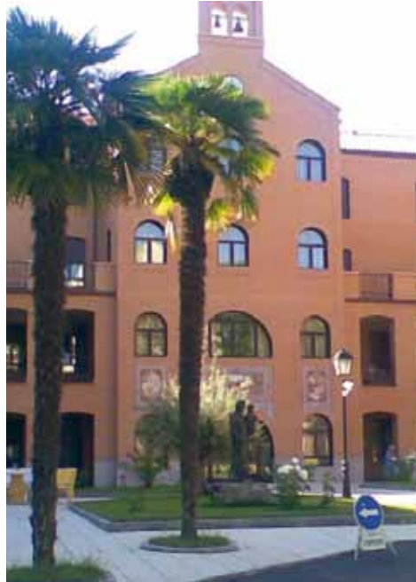
La casa de las Hermanitas en Talavera de la Reina.

Las Hermanitas de los Pobres queremos que nuestras casas sean lo más parecido a un «hogar», las llamamos «Mi casa». En ellas deseamos crear un ambiente de familia entre los residentes, las hermanitas, los miembros de la Asociación Juana Jugan, los colaboradores, los miembros del personal y nuestros bienhechores. Para ello les proponemos colaborar en las diferentes tareas de la casa: preparación de legumbres, ropería, comedores, recepción, jardín y manualidades.