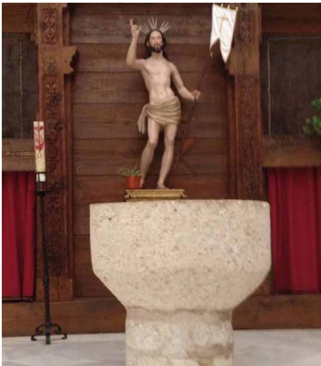
La imagen del Resucitado preside la capilla bautismal de la iglesia de Torrijos.