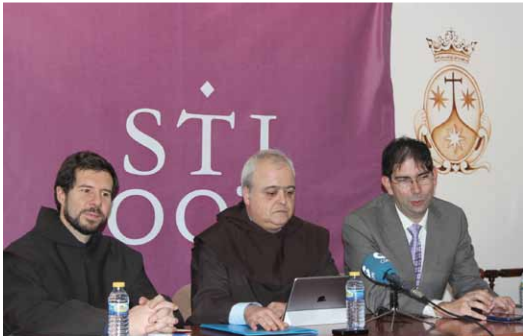
El padre Vicario General durante la presentación de la Oración Mundial por la Paz.

Después, el Papa Francisco invitó a rezar también a los que se sienten distantes, o ya no están acostumbrado a hacerlo. «Esta oración por el Sínodo sobre la familia es para el bien de todos. Sé que esta mañana os han dado una estampa que ahora tenéis en las manos... Os invito a guardarla y llevarla con vosotros, para rezarla a menudo en los próximos meses, con santa insistencia, como Jesús nos pidió».