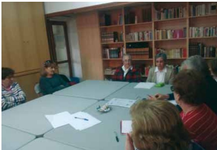
Reunión de colaboradores de «Oscus».

Por este motivo desde OSCUS Toledo se hace un llamamiento a todos los profesores