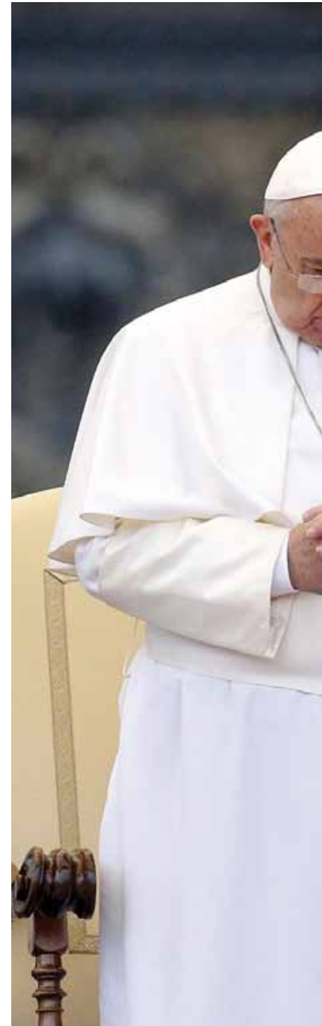
El Papa Francisco durante la oración por el Sínodo de

Jesús, María y José, escuchad, responded a nuestra súplica. Amén