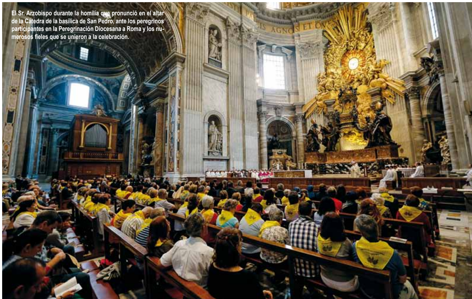
El Sr. Arzobispo durante la homilía que pronunció en el altar de la Cátedra de la basílica de San Pedro, ante los peregrinos participantes en la Peregrinación Diocesana a Roma y los numerosos fieles que se unieron a la celebración.