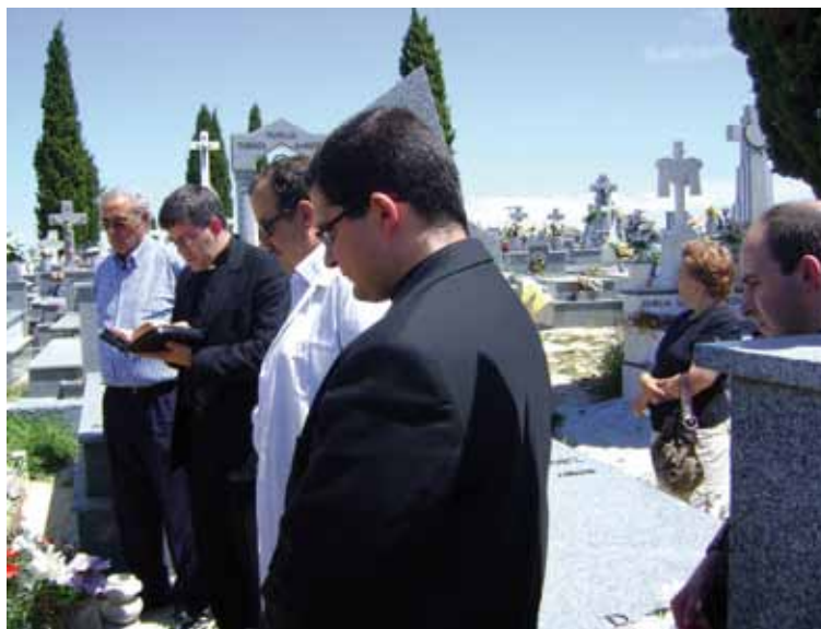
Exhumación de los restos en el cementerio de Cazalegas.