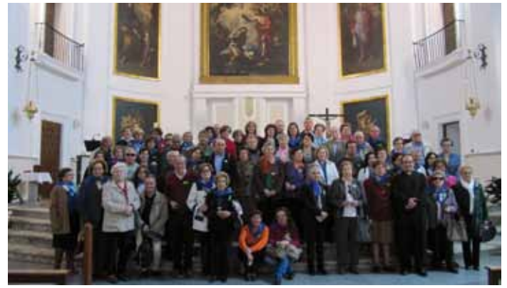
Uno de los grupos participantes en la jornada.

Al día siguiente, en la basílica de San Pablo Extramuros, celebraron la Ultreya Europea. Los cursillistas de nuestra diócesis tuvieron también la posibilidad de celebrar la Eucaristía en la basílica de San Pedro, en la capilla de San Juan Pablo II.