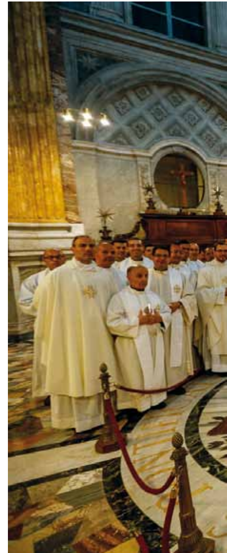
Los concelebrantes, al finalizar la Santa Misa.

Tras comentar los diversos momentos de la celebración litúrgica en el Rito Hispano-Mozárabe, el Sr. Arzobispo dijo que «gracias al Concilio Vaticano II, gracias al Cardenal Marcelo González Martín y a cuantos le ayudaron a poner de nuevo en disposición de celebrar el venerable Rito, en Toledo y en toda España hoy, con la aprobación de la Santa Sede y la Conferencia Episcopal Espa-