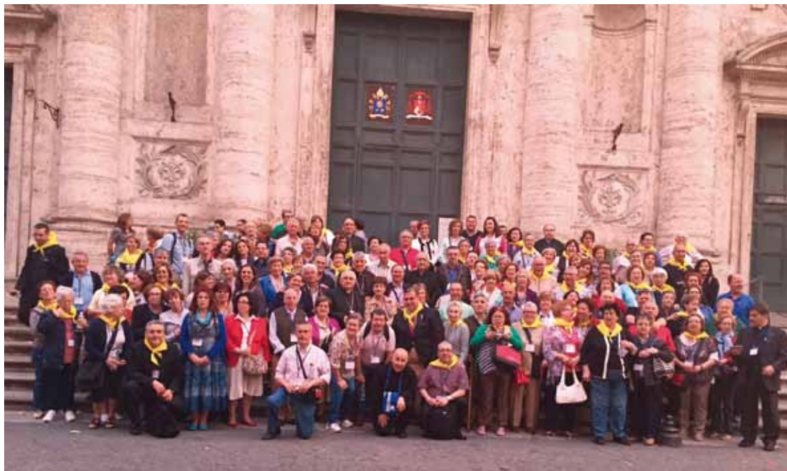
Arriba, el Sr. Ministro de Exteriores de España con otras autoridades asistentes. Debajo, algunos de los peregrinos toledanos.

deferencia de presidir aquella celebración: «Venimos porque queremos proclamar nuestra fe», y añadió que «hoy nos anima el mismo deseo, pues nuestra fe es católica y la revivimos cantando y recibiendo del Papa Francisco el aliento de aquel en el que hoy vive Pedro, presidiéndonos en la caridad».