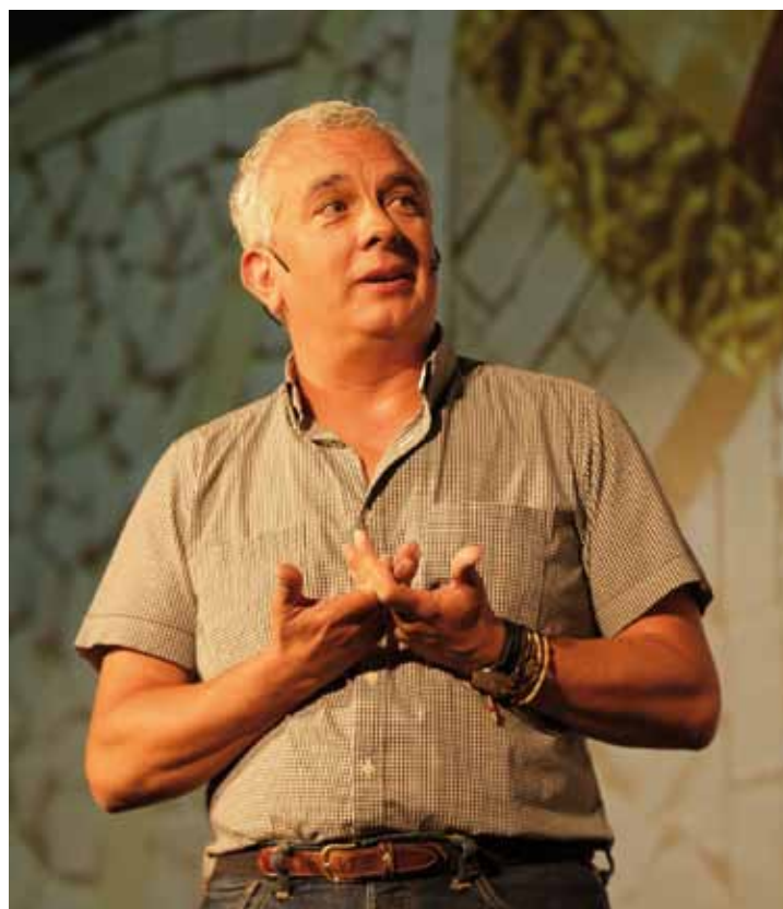
El Hermano Juan Diego trabaja en el Albergue de San Juan de Dios de Madrid.

La Conferencia Episcopal quiere agradecer de manera especial a todos los miembros de la Iglesia que viven y participan de las distintas actividades y a todos aquellos que con su colaboración espiritual y material hacen posible esta realidad.