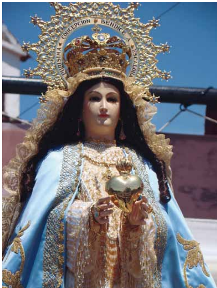
La imagen sujeta un corazón que contiene los nombres de todos los cofrades.