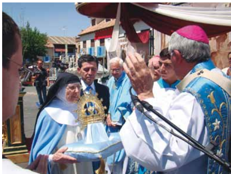
Una religiosa concepcionista presentó la corona al Sr. Arzobispo

Sin embargo, «la historia de María y su Concepción Inmaculada es la historia de su sí de libertad». Por eso el Sr. Arzobispo se preguntó seguidamente: «¿Acaso no será libre la Virgen por no haber pecado? En la lógica del relativismo moral ciertamente que no lo sería. Pero frente a ese panorama de soledad brutal de una libertad mal entendida, el cristianismo –es decir, Dios hecho hombre en las entrañas de una doncella de Nazaret– se nos ofrece a todos y cada uno de los seres humanos como la respuesta desbordante de la suprema libertad, y la posibilidad de una vida que lucha por la bondad, la verdad y la belleza de nuestra vida».