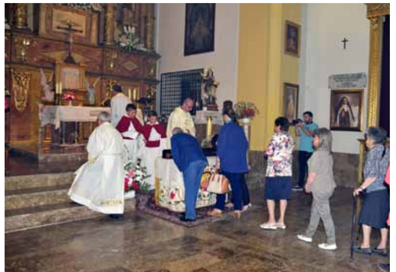
Arriba, la urna en el altar mayor de la Catedral. Debajo, en la parroquia de Ocaña.

y actualizar el mensaje de Teresa de Jesús a nuestro tiempo». Como custodio del bastón, su misión principal será la de explicar las andanzas de Santa Teresa, «la monja inquieta y andariega», que sigue «a día de hoy invitándonos a una profunda renovación espiritual, a no dejar de caminar y a salir a los