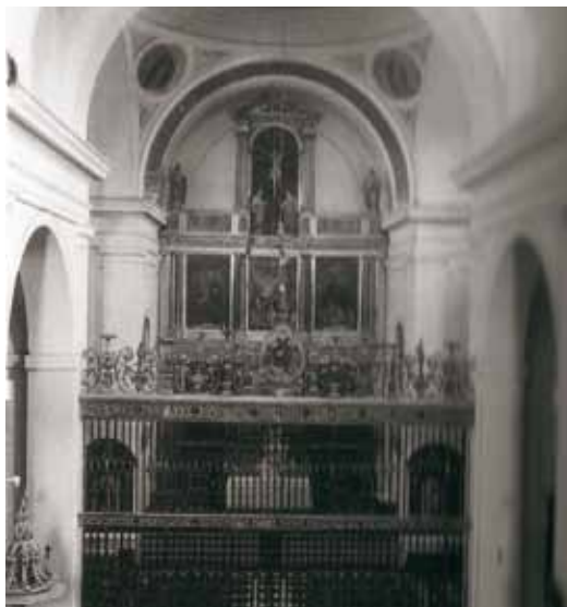
Iglesia de San Pedro Mártir.

El 22 de julio de 1936, por la tarde, su hermana oyó a unos milicianos que al día siguiente darían el paseo a un cura de ese barrio pues había que acabar con esa raza. Pensando que se referían a él, se trasladaron al amanecer del