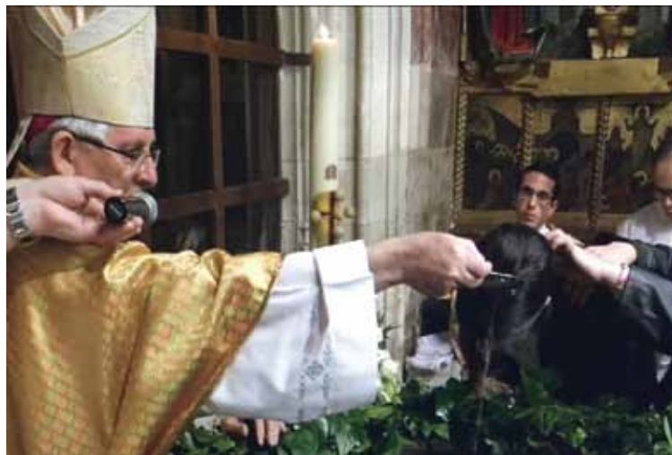
El Sr. Arzobispo administra el bautismo a una joven en la reciente Vigilia de Pascua.

También se emplea el dinero en sostener a aquellos que entregan por los demás su tiempo, sus conocimientos y sus cualidades. Como por ejemplo, los sacerdotes, obispos y