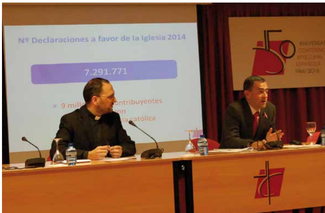
El vicesecretario para asuntos económicos de la Conferencia Episcopal, Fernando Giménez Barriocanal, presentó los últimos datos.

En este sentido se pueden realizar dos valoraciones, en primer lugar que el aumento de las declaraciones presentadas a favor de la Iglesia y de la cantidad consignada, aunque es un incremento pequeño, es positivo pues viene marcado por el inicio de la recuperación económica en España, lo que ha supuesto una leve mejora a nivel recaudatorio. Por otro lado, el porcentaje indica que todavía es posible concienciar a más personas de la actividad de la Iglesia para que destinen una parte de sus impuestos, sin pagar más y sin que le devuelvan menos,