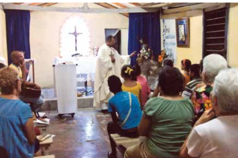
és del Fondo para la Nueva Evangelización, la Iglesia española en sus presupuestos destina todos los años ayudas a Iglesias necesitadas en países de misión.

muchos otros profesionales que trabajan en la Iglesia. Juntos realizan una labor eclesial: evangelizadora, pastoral y social al mismo tiempo. Todas esas actividades pastorales nacionales suponen el 3,3% de la aportación de la X.