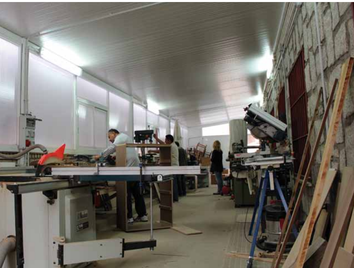
de carpintería de Cáritas, para la formación en el empleo.