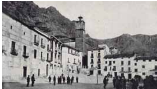
La plaza de la Corredera, en Cazorla, el año 1911.