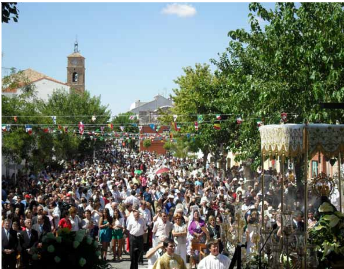
El Estado ha de ponerse al servicio del bien común y de la sociedad concreta, en la que de hecho se valora y se profesa la religión católica. En la foto, de archivo, multitudinaria celebración popular de la fiesta de la Virgen de la Piedad, en Villanueva de Alcardete.