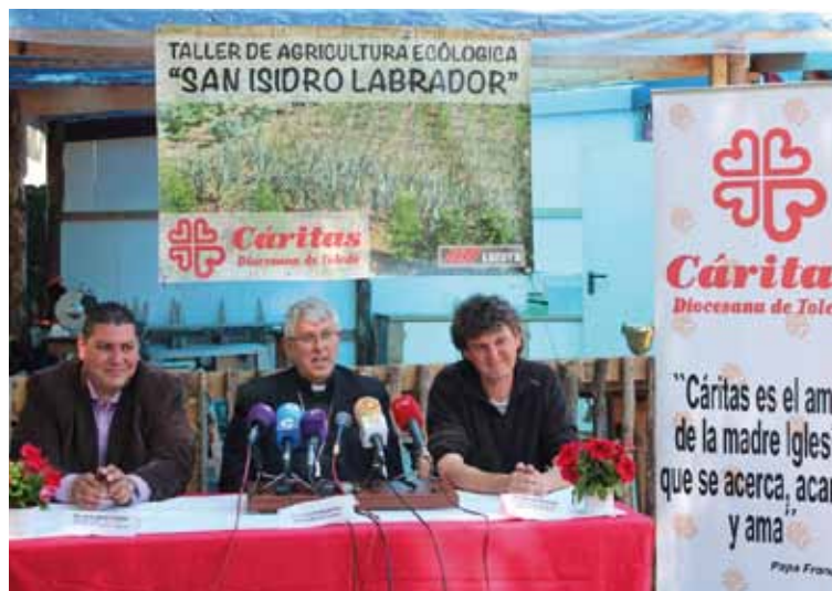
El Sr. Arzobispo durante el acto de presentación.

consumo responsable fomentando sostenibilidad medioambiental».