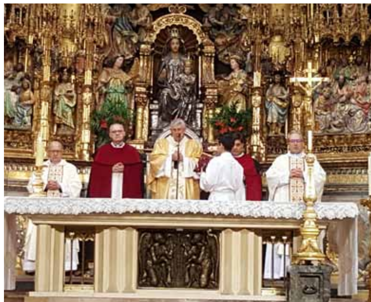
El Sr. Arzobispo, acompañado del deán y del provicario general.

vo. Nos duele tanto, manifestaba, que los padres de los niños de Primera Comunión piensen sólo en la fiesta y no en que los niños tienen que iniciarse en la Eucaristía del domingo.