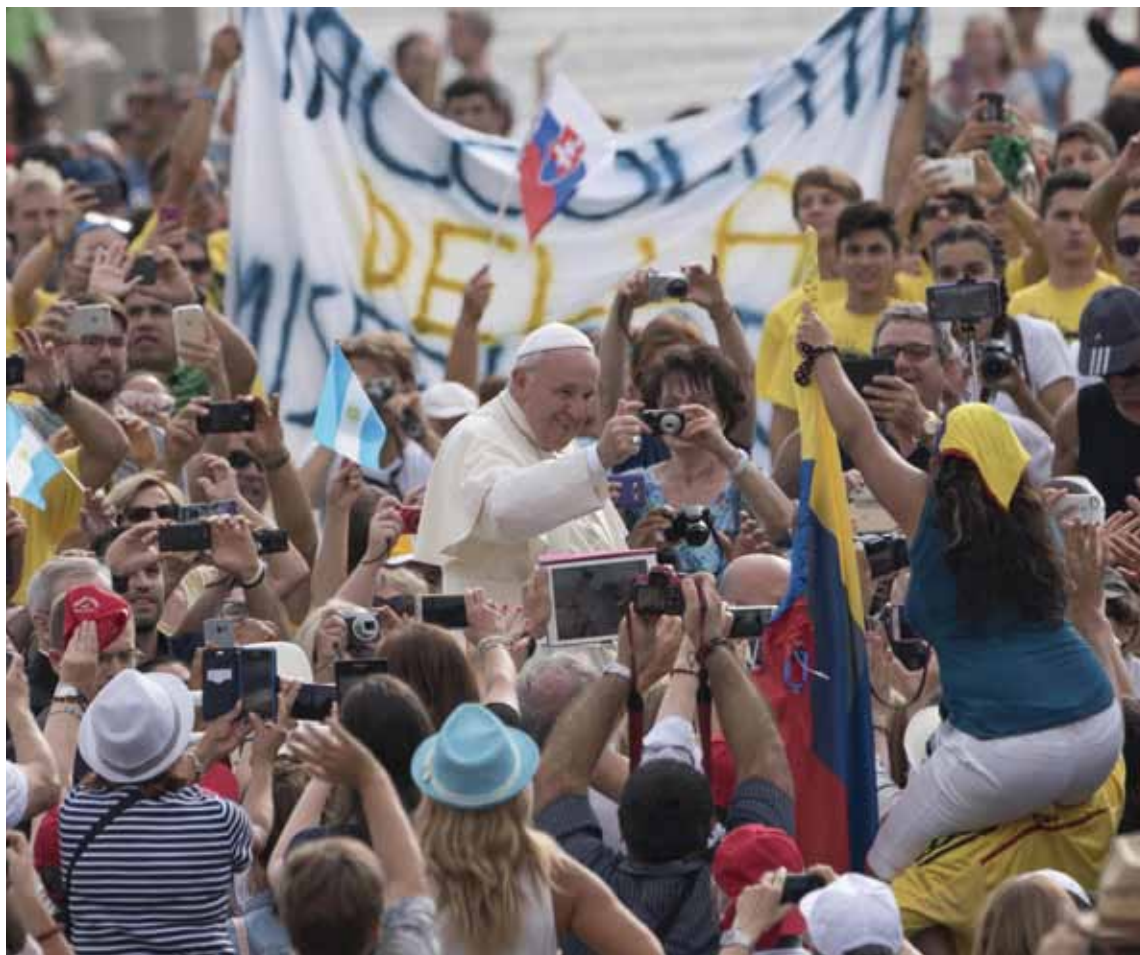
El Papa Francisco se fotografía con algunos peregrinos durante la audiencia general del miércoles.

como partícipes de un sistema que «ha impuesto la lógica de las ganancias a cualquier costo sin pensar en la exclusión social o la destrucción de la naturaleza», arrepintámonos del mal que estamos haciendo a nuestra casa común».