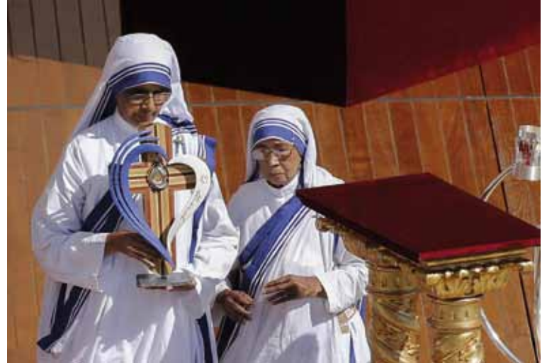
Dos Misioneras de la Caridad presentan la reliquia de santa Teresa de Calcuta.

Después se refirió directamente a la nueva santa, a Madre Teresa que «a lo largo de toda su existencia, ha sido una generosa dispensadora de la mi-