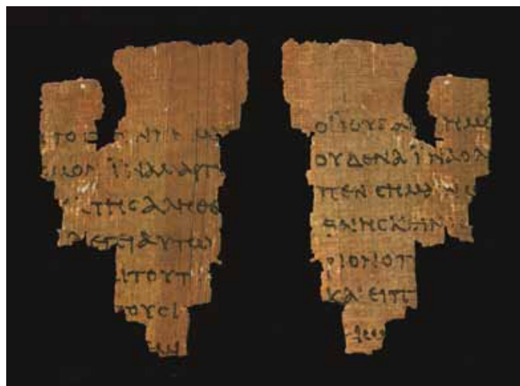
Fragmento de papiro descubierto en Egipto con fragmentos de algunos versículos del capítulo 18 de san Juan, datado como anterior al año 150.

Ahora bien, surge entonces una nueva pregunta: «¿Cuál es la comprensión adecuada de la Biblia? Dicho de otra forma: ¿es posible una interpretación bíblica al margen de la fe?». El «riesgo de reducir la Escritura a una sola dimensión», es decir entender la Biblia como «un libro solamente humano», es «un peligro real, también hoy».