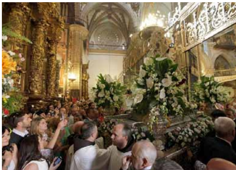
Arriba, la Santa Misa. En la foto inferior, el comienzo de la procesión.

que ha duplicado largamente la venida de peregrinaciones y las celebraciones del santuario.