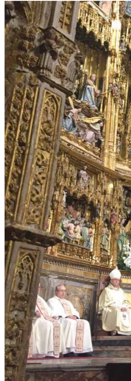
«Cristo está presente en su Palabra cuando se lee en la Iglesia».