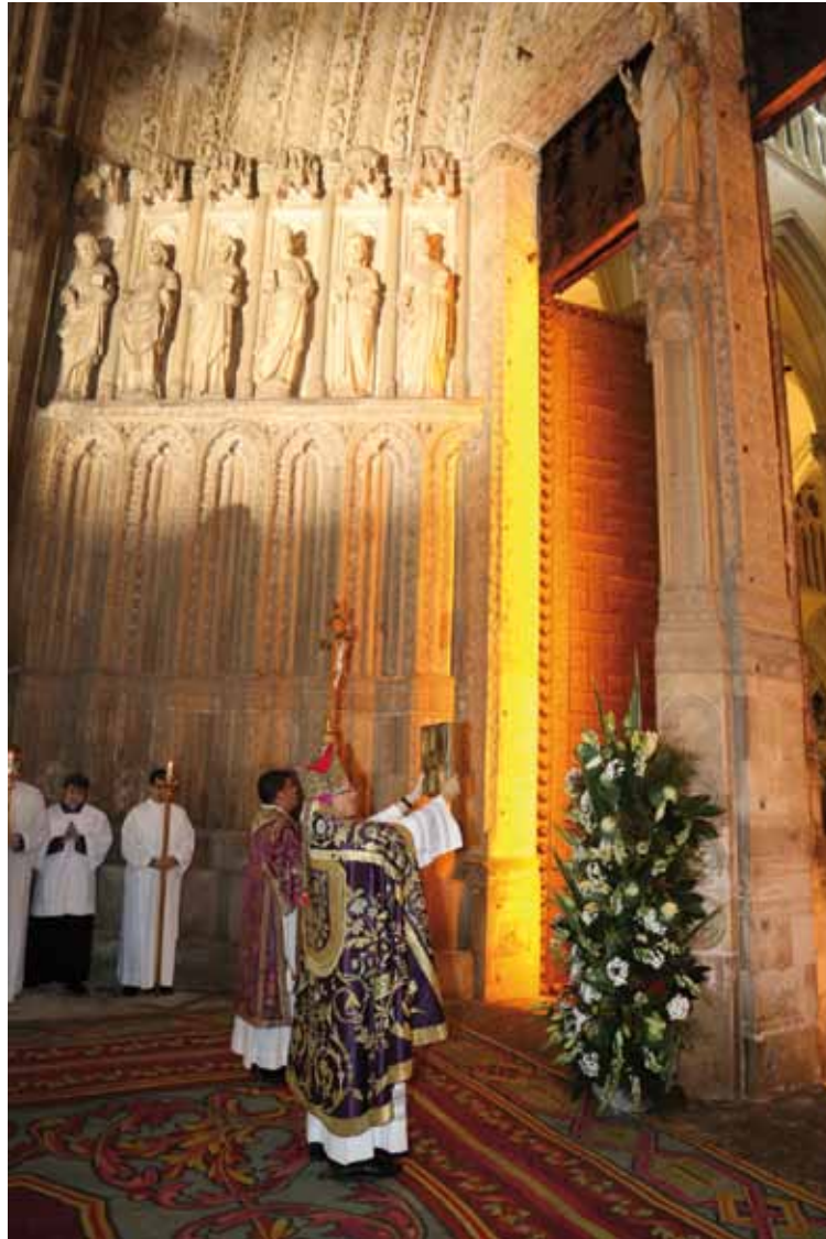
El Sr. Arzobispo muestra el libro de los Evangelios en la Apertura del Año de la Misericordia.

Constata, sin embargo, que «nuestra cultura no es bíblica y el número de los que no leen y, por ello, no conocen la Biblia es muy grande entre nosotros». Constata también que «los