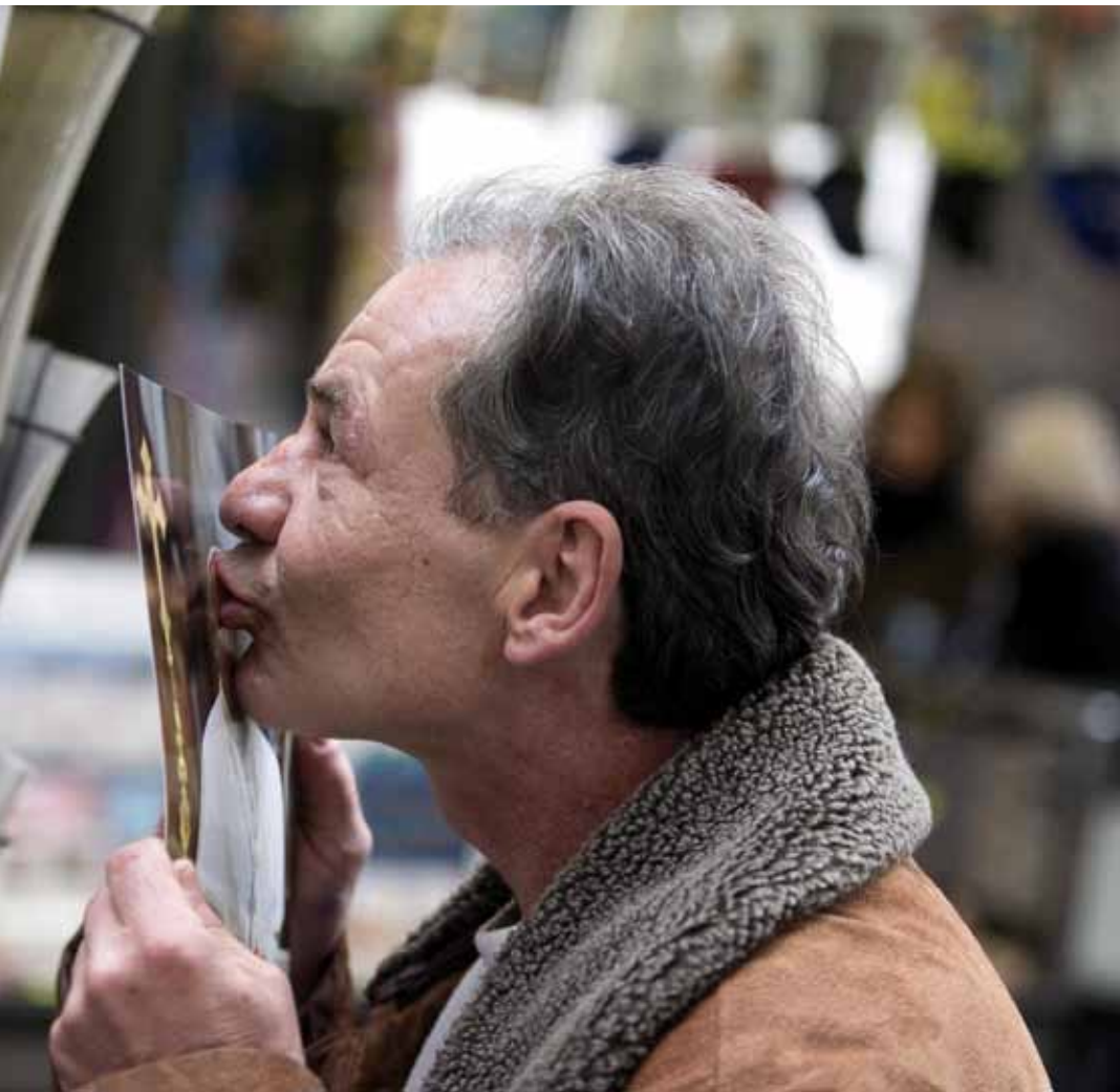
..., besa un retrato del Papa Francisco.

mención más superficial y efímera de la existencia (cf. ibíd. , 62).