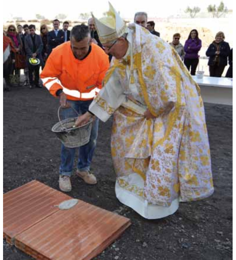
Un momento de la colocación de la primera piedra.

La mayor novedad de este nuevo Centro educativo diocesano