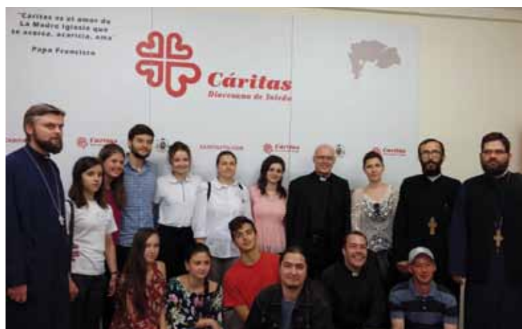
El grupo de jóvenes de la Iglesia ortodoxa rumana durante su visita a Caritas.