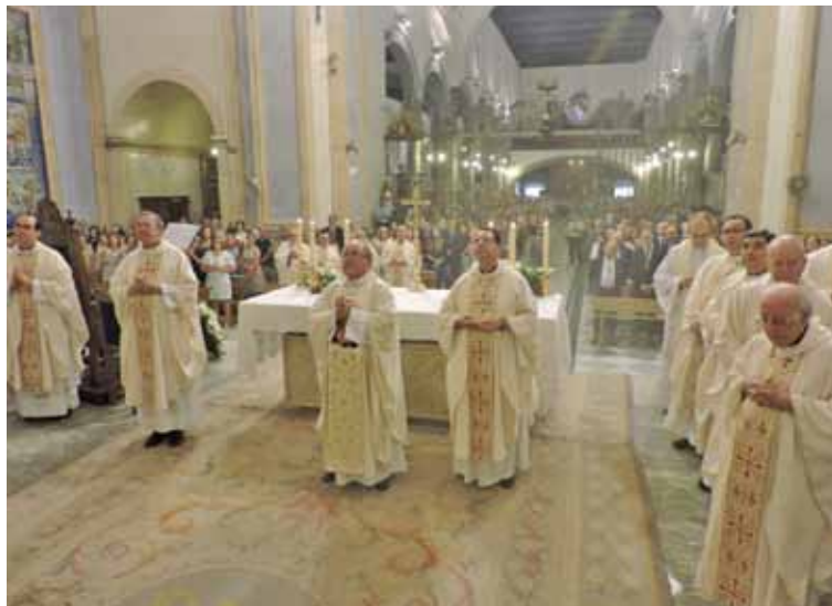
Los sacerdotes concelebrantes, junto el pueblo, cantan la Salve a la Virgen.