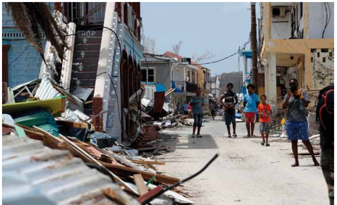
La isla de San Martín fue una de las zonas más afectadas por el huracán que asoló el Caribe.

En la madrugada del miércoles, 6 de septiembre, el huracán «Irma» impactó en las Antillas más orientales, causando la muerte de 11 personas —ocho en la isla de San Martín, uno en San Bartolomé, uno en Barbu-