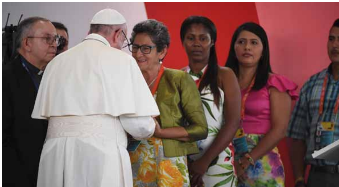
El Papa saluda a algunas víctimas de la violencia en Colombia, durante el Encuentro de Oración por la Paz y la Reconciliación.

El Santo Padre se refirió a las fuertes raíces cristianas de Colombia y manifestó la evidencia del obrar del maligno, que «quiso dividir el pueblo para destruir la obra de Dios». Pero destacó además «que el amor de Cristo y su misericordia infinita es más fuerte del pecado y de la muerte», y este viaje «ha sido llevar la bendición de Cristo y la de la Iglesia, sobre el deseo de vida y de paz que brota del corazón de la nación».