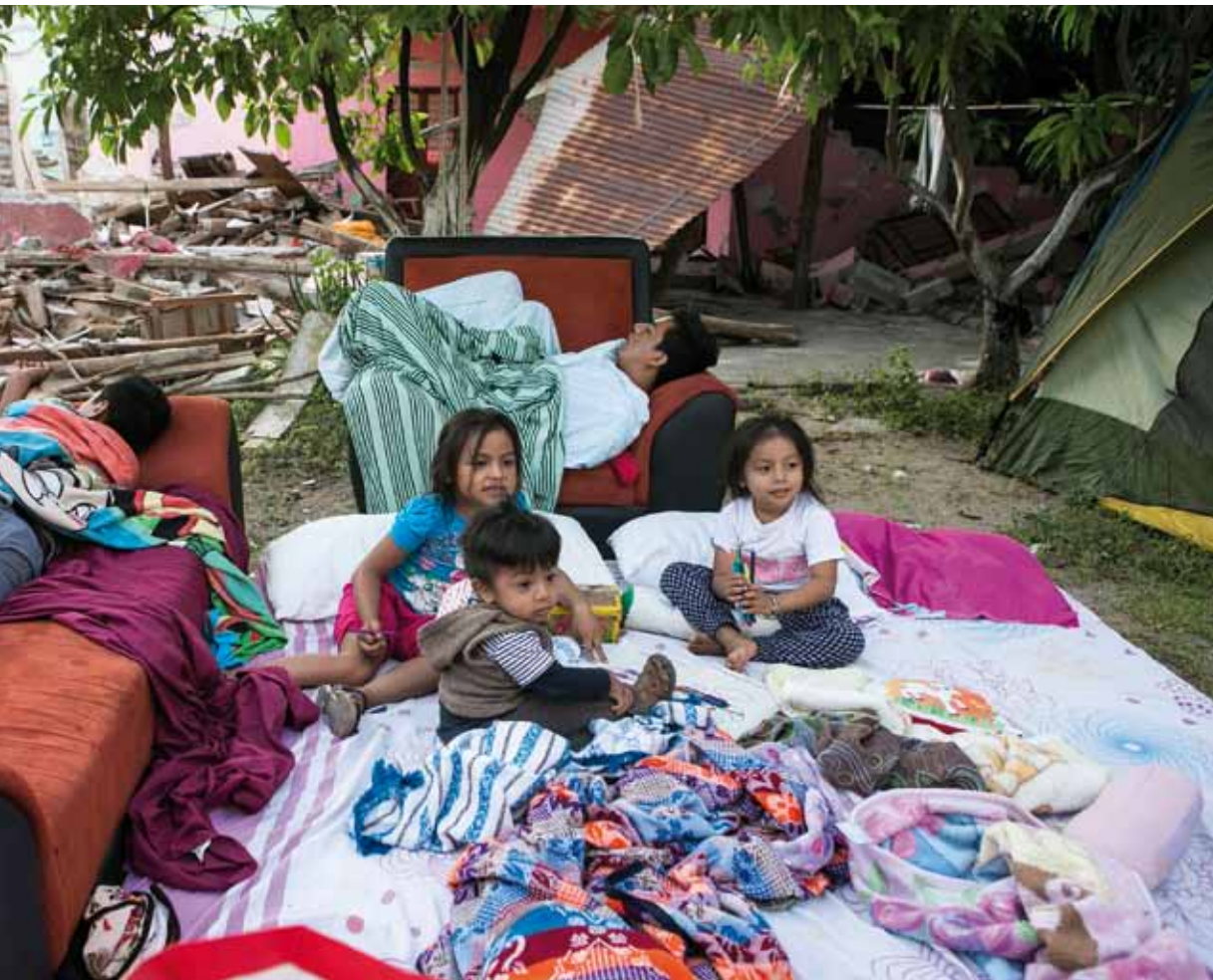
Persona entre los restos que han podido salvar de sus viviendas.

da y otro en Puerto Rico- y 21 heridos en la isla de San Martín.