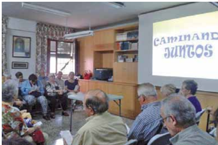
Participantes en uno de los talleres, el curso pasado.

La apertura de curso oficial se celebrará en la sede del Cen-