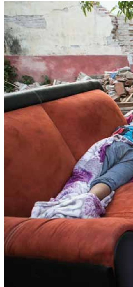
Una familia afectada por el terremoto en México desca