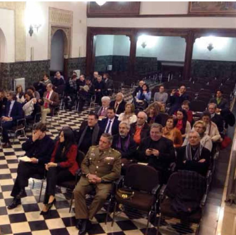
Los Tribunales Eclesiásticos de la Provincia Eclesiástica.