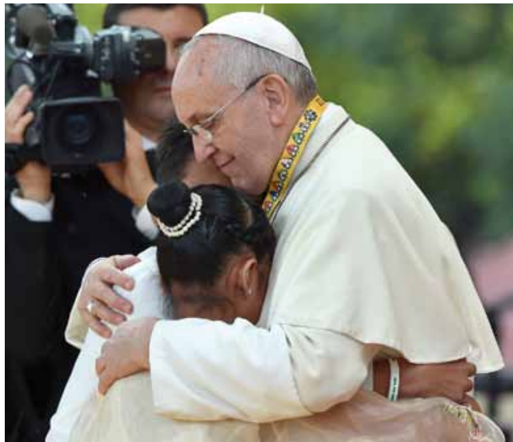
El Papa abraza y consuela a una «niña de la calle», en Manila.

Por último dedicó unas palabras a su encuentro con los jóvenes. «He querido apoyar sus esfuerzos para contribuir a la renovación de la sociedad, especialmente a través del servicio a los pobres y la protección del medio ambiente natural. El cuidado de los pobres -finalizó- es un elemento esencial de nuestra vida y el testimonio cristiano; la corrupción roba a los pobres y requiere una cultura honesta».