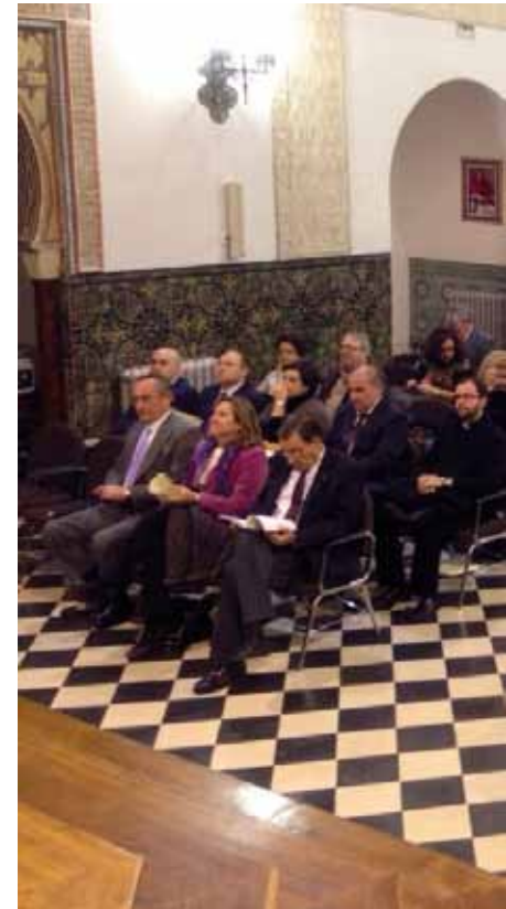
La apertura del Año Judicial congregó a miembros de la comunidad.