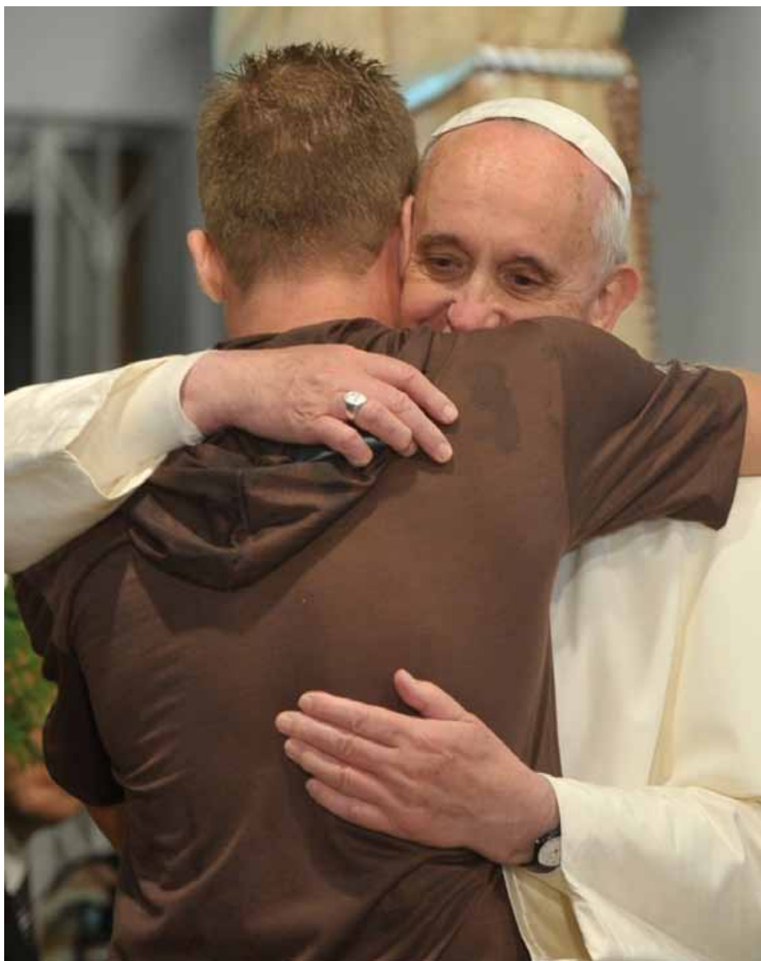
El Papa Francisco, en Brasil, abraza a un hombre que se recuperó de una drogodependencia.