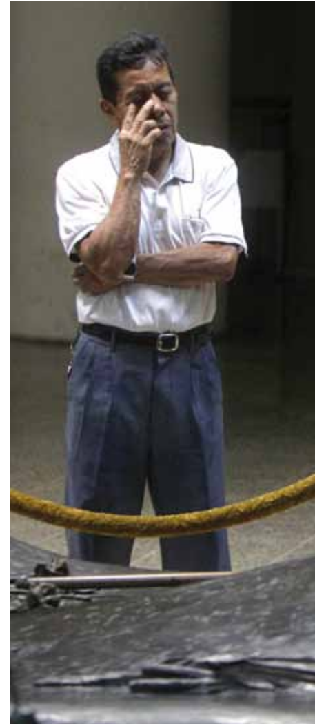
Un hombre reza ante el sepulcro del arzobispo Óscar Romero.

Romero creía en su función como obispo y primado del país y se sentía responsable de la po-