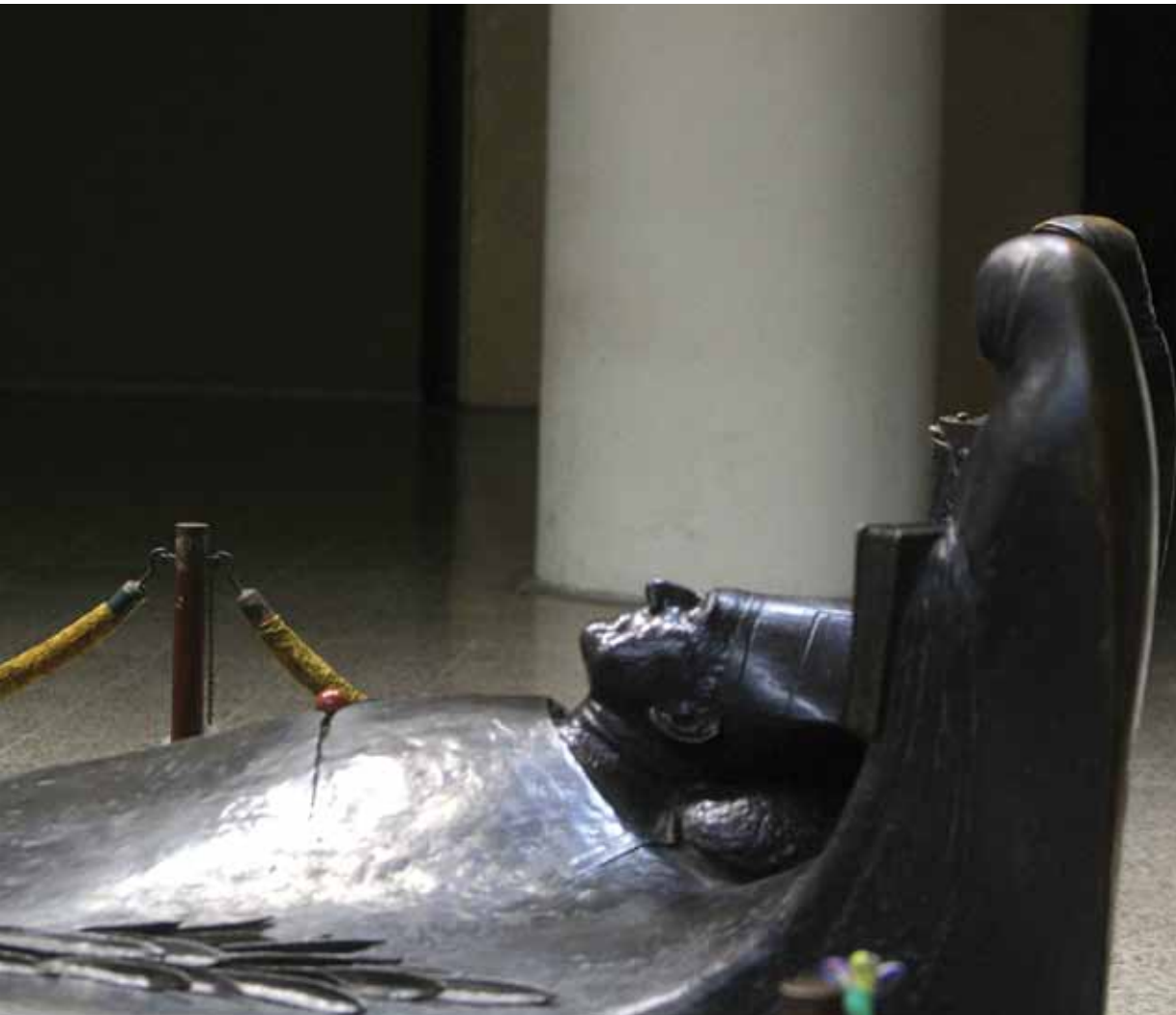
Romero, en El Salvador.

mataron a decenas de catequistas de las comunidades de base, y muchos de los fieles de estas comunidades desaparecieron. La Iglesia era la principal imputada y por lo tanto la más atacada. Romero resistió y accedió a dar su vida para defender a su pueblo.