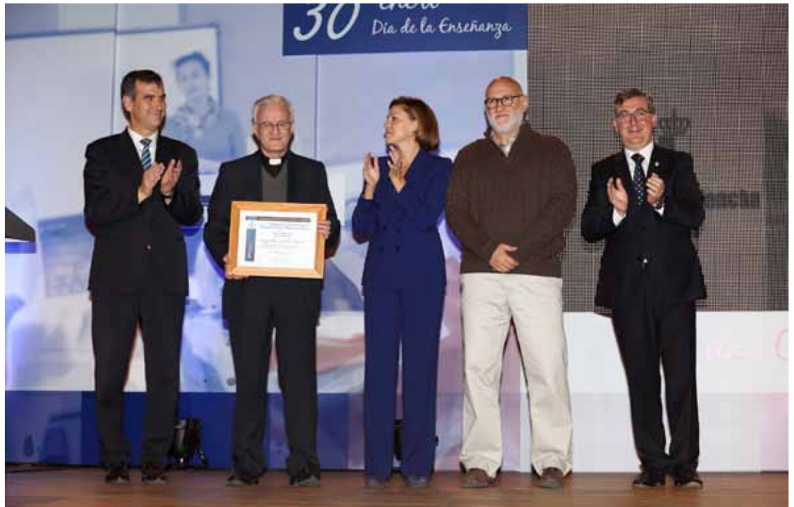
El Director del Colegio de Infantes recogió el galardón de la Presidenta de Castilla-La Mancha.

Otro programa es «Naturaleza Infantes», mediante el que «se potencia el amor y respeto a la naturaleza, y el interés por la jardinería, por medio de la catalogación de todas las especies arbóreas y arbustos que se encuentran en los jardines del colegio, y las plantas interiores en aula y pasillos, conocer