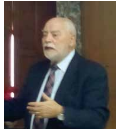
El conferenciante durante su intervención.