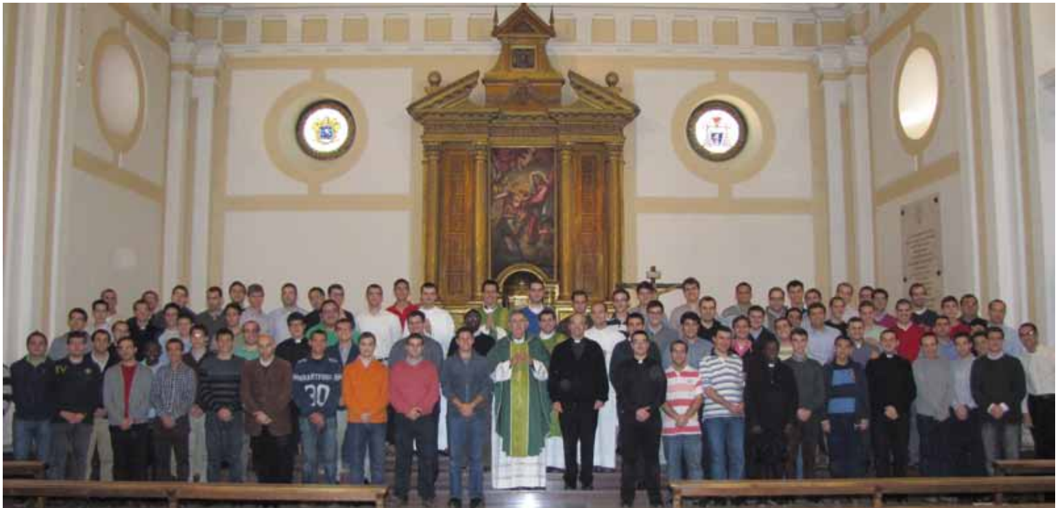
Los seminaristas mayores, tras la celebración de los Ejercicios Espirituales del presente curso.

Este domingo posterior a la solemnidad de san José celebramos el Día del Seminario, una ocasión para conocer mejor a nuestros Seminarios y para que nos interese por ellos y por sus necesidades. En nuestro Seminario Mayor más de 80 jóvenes se preparan para el sacerdocio y el Menor acoge a 65 alumnos (PÁGS. 3 Y 6-7).