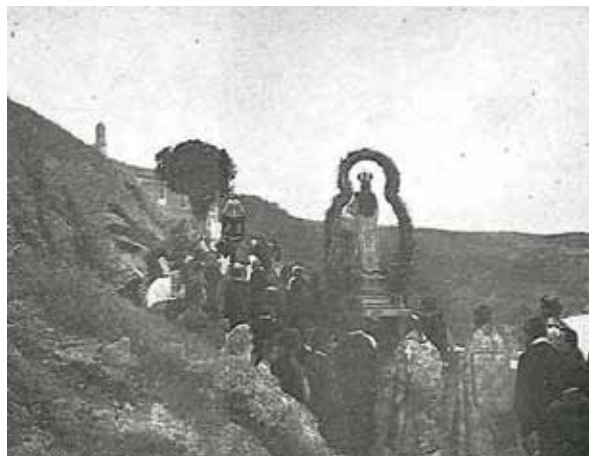
Romería de la Virgen del Valle hacia 1929.

El Siervo de Dios de 1918 a 1925, fue ecónomo de Ocaña. De 1925 a