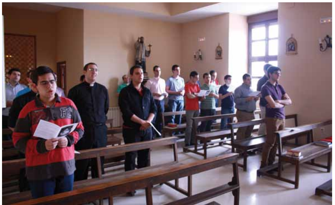
Algunos de los seminaristas mayores durante un momento de oración comunitaria.

su ayuda material para que el Seminario sea un lugar apto para la formación, y podamos mantener una institución que es muy deficitaria, y que nos interpela a colaborar económicamente.