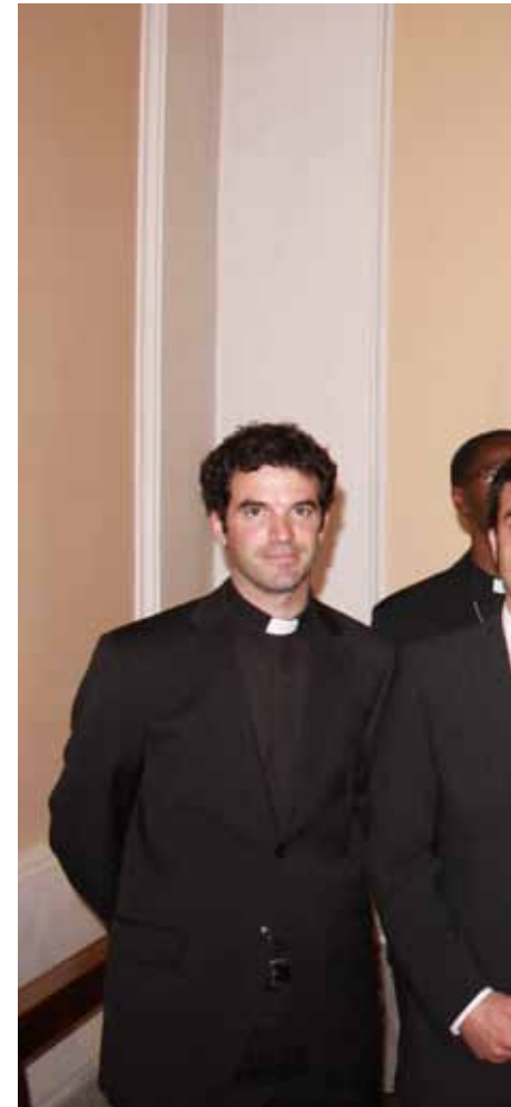
El último curso de jóvenes que se ha preparado para r...

Por todo esto, además de dar gracias a Dios, es muy importante que toda la Iglesia Diocesana siga colaborando con el Seminario. Ante todo con la insistente oración para que los jóvenes llamados sean generosos en la respuesta, y «tengamos muchos y santos sacerdotes». Las familias, los educadores y catequistas han de ayudar a los niños y jóvenes a que estén abiertos a la posibilidad de que Dios les llame, y darles pautas para tener un corazón disponible para la vocación a la que Dios les tenga destinado para bien de su Iglesia. Y también hemos de pensar que si la Iglesia quiere sacerdotes, han de poner también