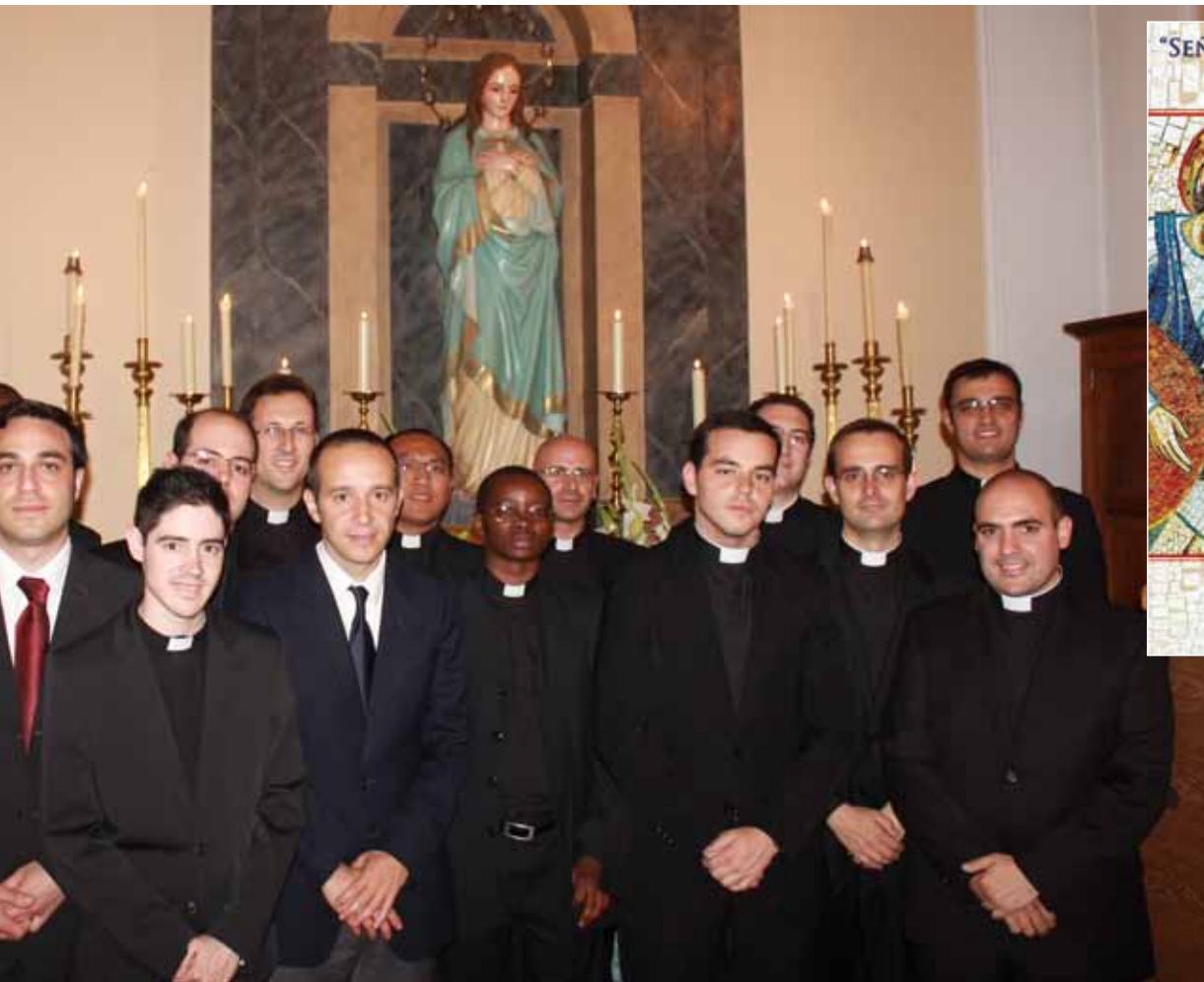
Recibir el sacerdocio en nuestro Seminario Mayor.