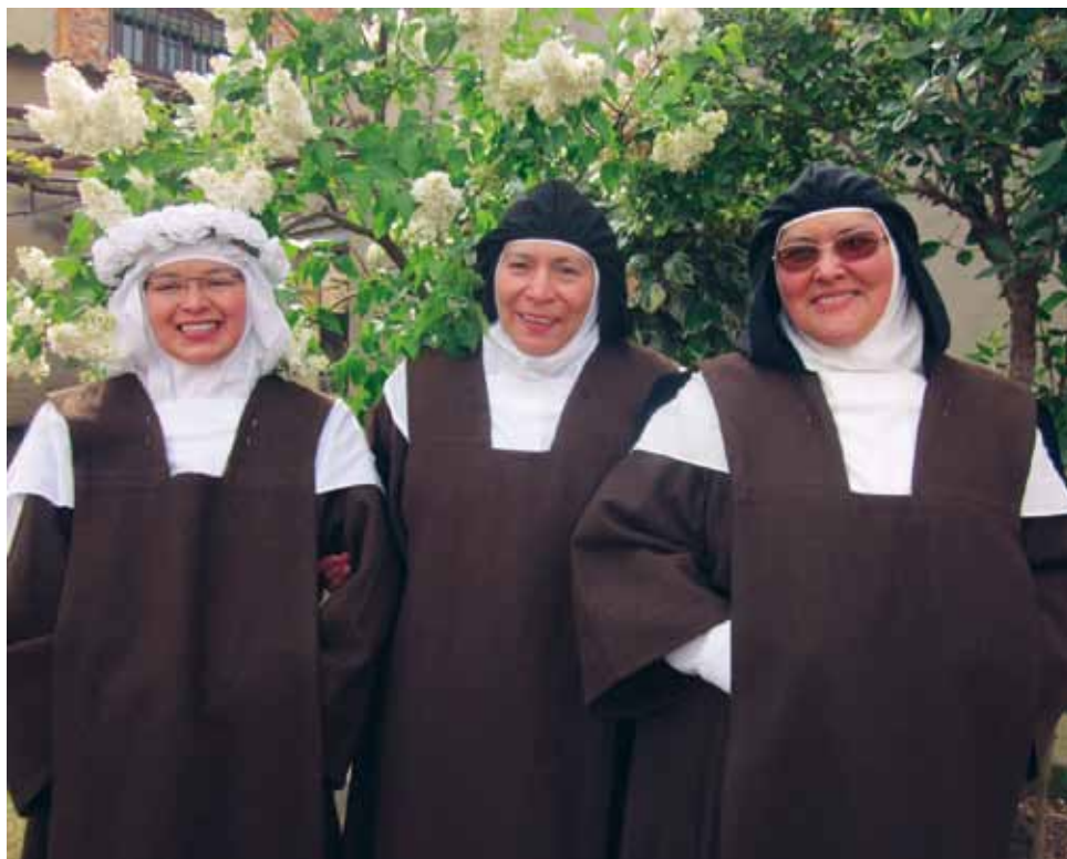
A la izquierda, la nueva carmelita con dos religiosas de la comunidad de Consuegra.