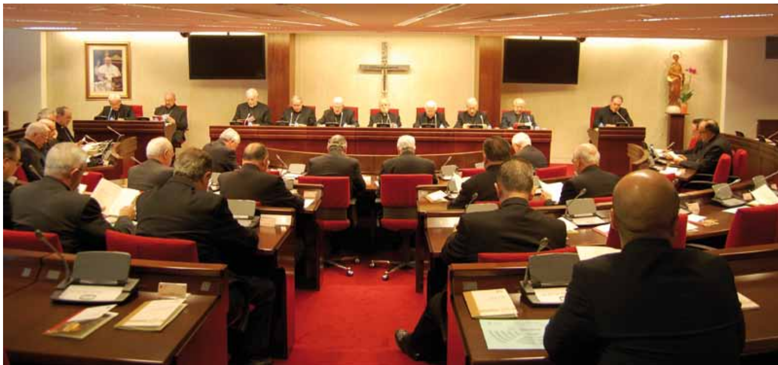
Los obispos españoles reunidos en la última Asamblea Plenaria celebrada el pasado mes de abril.