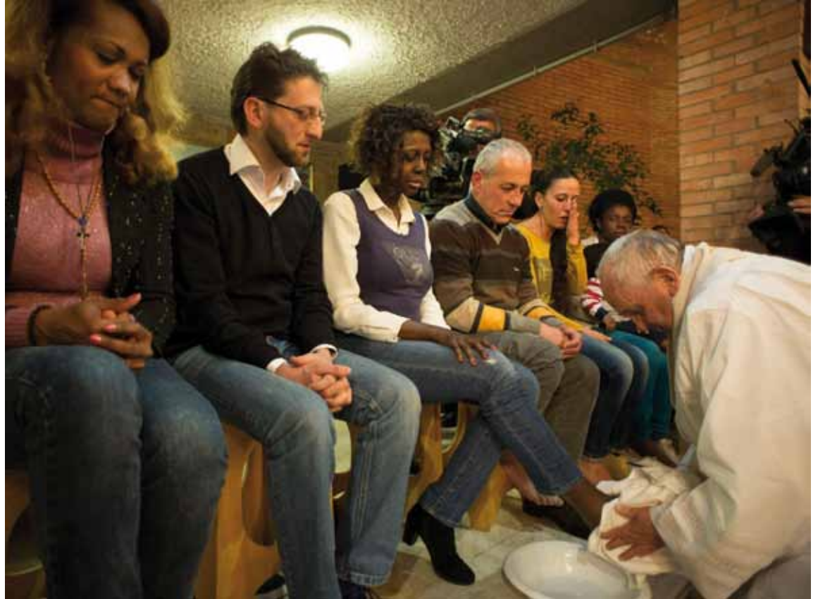
El Papa Francisco durante el lavatorio de pies en la misa de Jueves Santo.

–Como consecuencia de lo anterior, profundizar en la dimensión evangelizadora de la caridad y de la acción social, desde el testimonio personal y sin olvidar el anuncio explícito de Jesús. Tenemos, además, el