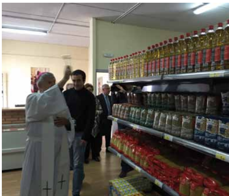
El Sr. Arzobispo durante la reciente bendición del economato de Cáritas Diocesana.

han ocasionado una época de recesión, para la que la única solución presentada es la lógica del crecimiento, como si «más» fuera igual a «mejor». Por último, en cuarto lugar, encontramos, como consecuencia de la lógica del crecimiento, una cierta idolatría de los mercados, cuando en realidad, la actividad económica, por sí sola, no puede resolver todos los problemas sociales; su recta ordenación al bien común es incumbencia, sobre todo, de la comunidad política, la que cual no debe eludir su responsabilidad en esta materia.