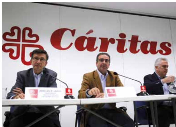
Presentación del informe en la sede de Cáritas española.