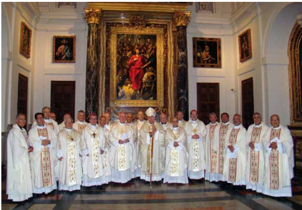
El Sr. Arzobispo, con los obispos la Comisión Mixta del Mediterráneo y otros concelebrantes en la Santa Misa.

Este año han trabajado el tema de la recepción y el acompañamiento de los catecúmenos que vienen de otras religiones. Cuando se producen estas peticiones especiales se requiere un camino catecumenal que debe tener en cuenta sus tradiciones religiosas y culturales. Asimismo fueron presentadas herramientas de catequesis específicas que pueden ayudar a los nuevos conversos a seguir un rico itinerario de encuentro