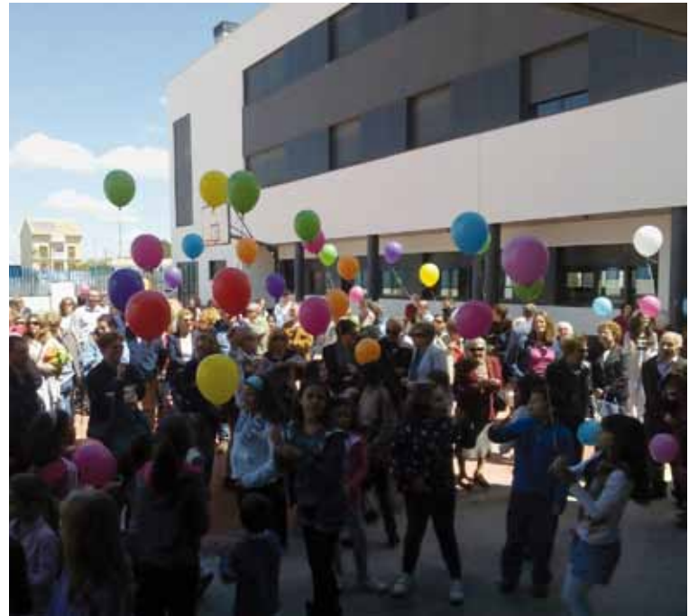
Uno de los momentos más significativos fue la suelta de globos.

El párroco recordó que esta Jornada formaba parte del Plan