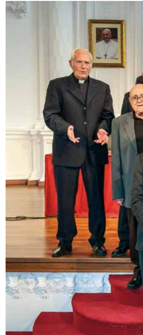
Los sacerdotes que cumplen 50 y 25 años de su ordenación.

«Igualmente -añadió- experimentamos que nuestros proyectos de acción pastoral en cada curso, siguiendo el Plan diocesano de pastoral o lo que nosotros pensamos es bueno empezar y consolidar en nuestras parroquias, grupos y movimientos, muchas veces fracasa