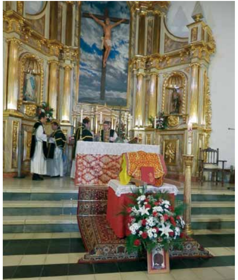
Los restos del siervo de Dios, delante del altar de la iglesia parroquial.

Al llegar al templo parroquial de San Sebastián se colocó la caja de reducción en el presbiterio para la misa funeral