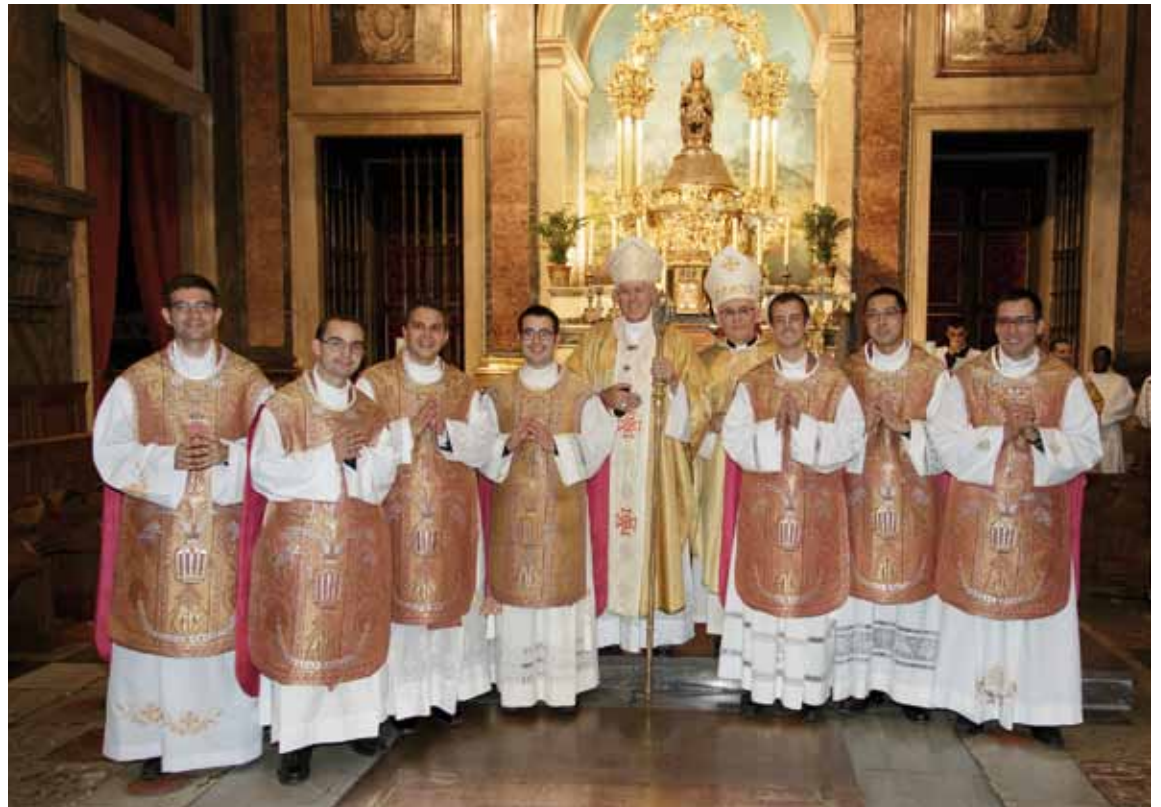
Los siete nuevos sacerdotes, con el Sr. Arzobispo y el Obispo auxiliar, en la capilla de la Virgen del Sagrario, tras la ordenación.