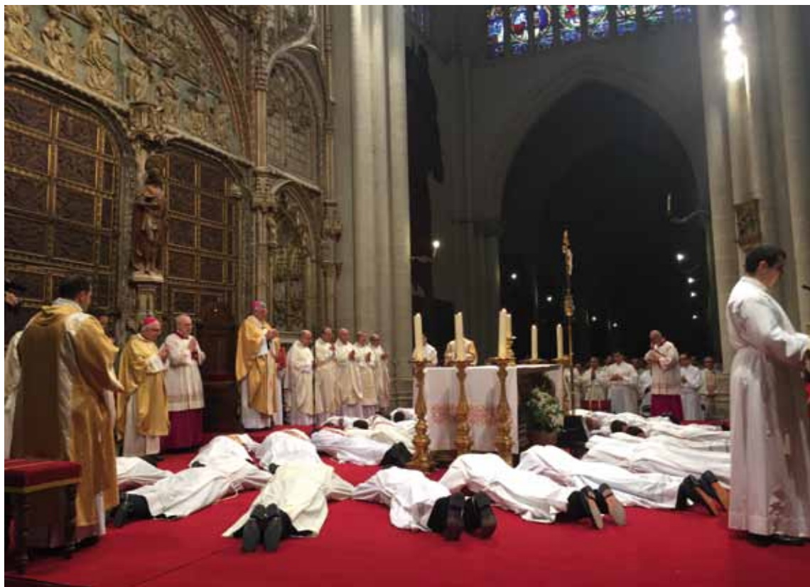
Los ordenandos, postrados en el suelo durante la oración de las letanías de los santos.

su fuerza sobre todo el Cuerpo de Cristo», añadió.