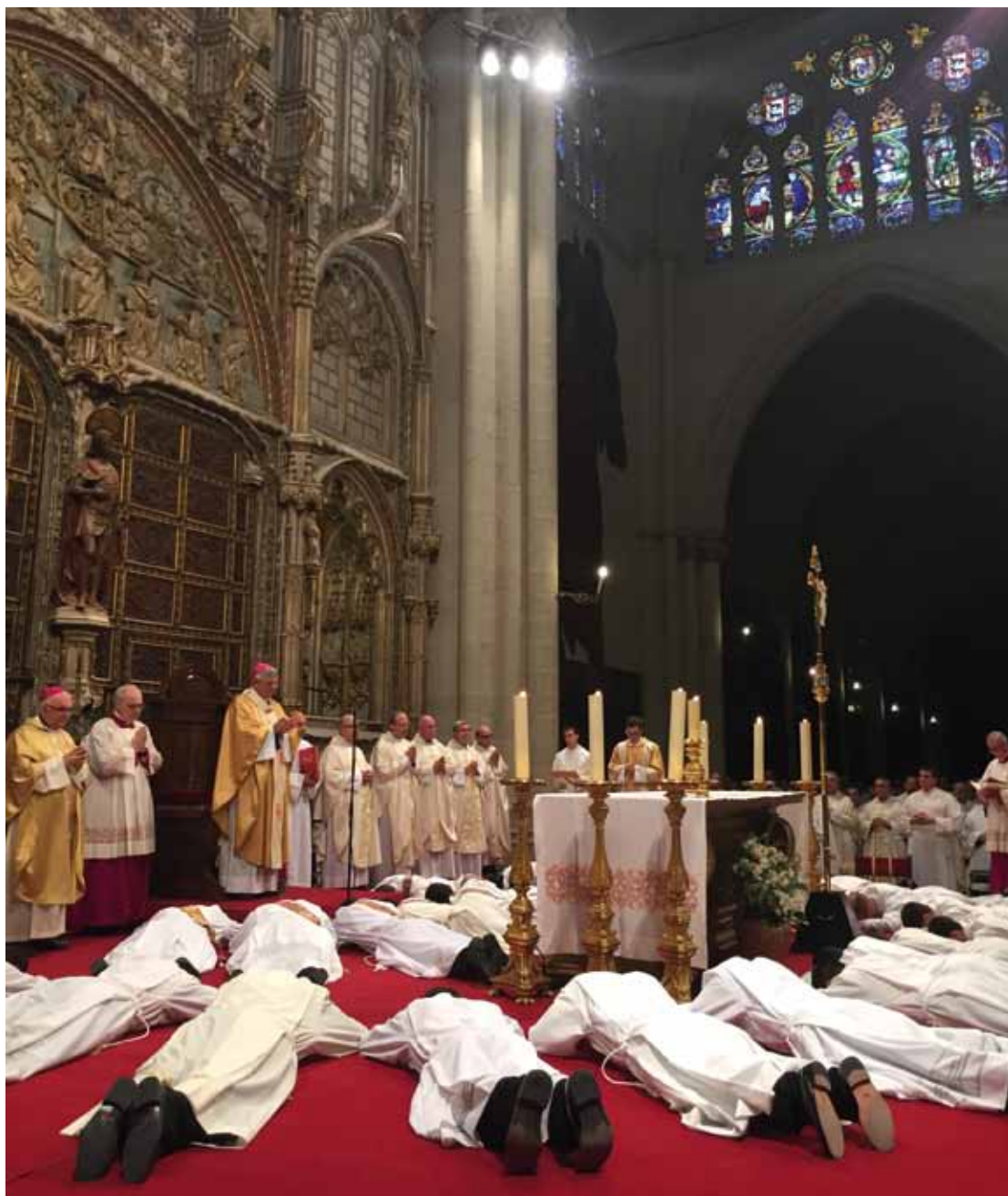
Algunos de los ordenandos durante el momento del cántico de las letanías de los santos.