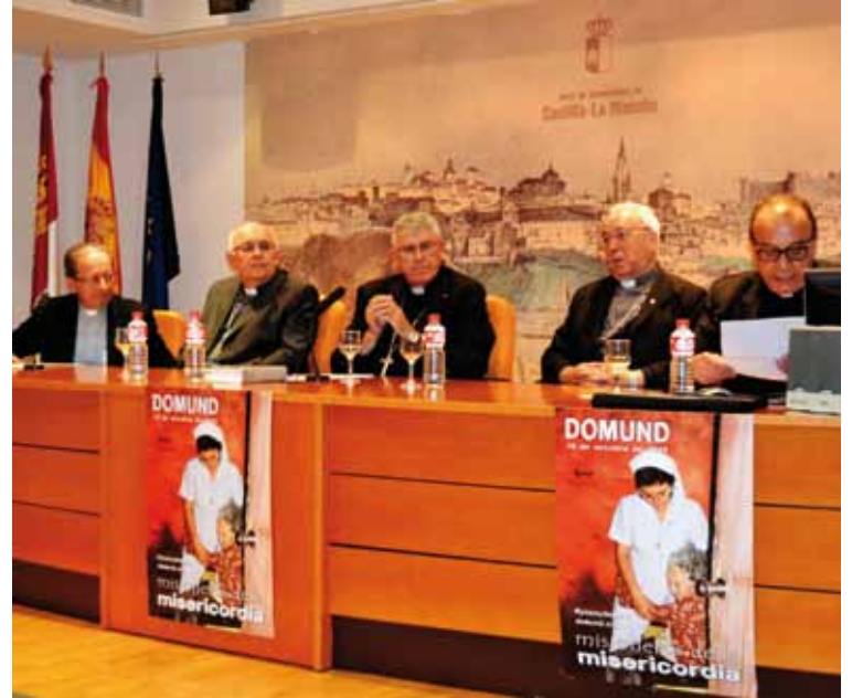
El Sr. Arzobispo presidió el acto conmemorativo del 50 aniversario del decreto conciliar.

Además, constataba que el mensaje de «Ad gentes es recogido, ampliado y desarrollado