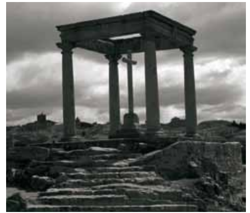
Ávila desde los Cuatro Postes. A este lugar Sancha llevaba un burro con las alforjas llenas de naranjas para repartirlas entre los niños y darles catequesis. Debajo, una foto de la época de su estancia en Ávila y Madrid.

inocencia y de emprender obras heroicas en bien de la Iglesia y de la religión». De ahí que el obispo de santa Teresa dedicara su primera Carta pastoral a la oración. Y lo hizo como era frecuente en él: con un arsenal de erudición, con un estilo accesible a todos, con amplitud y profundidad, intercalando citas bíblicas con otras de los Santos Padres y autores místicos.