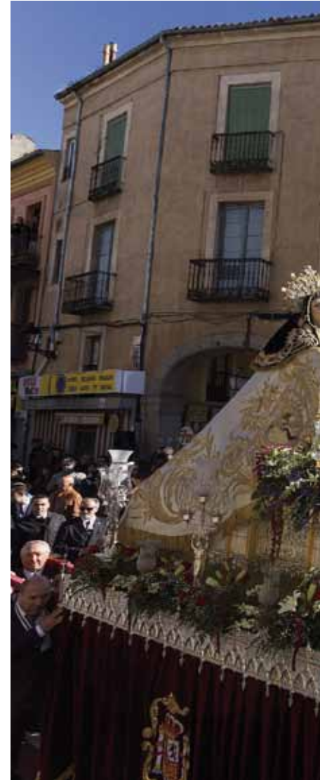
La imagen de santa Teresa que se conserva en el con...