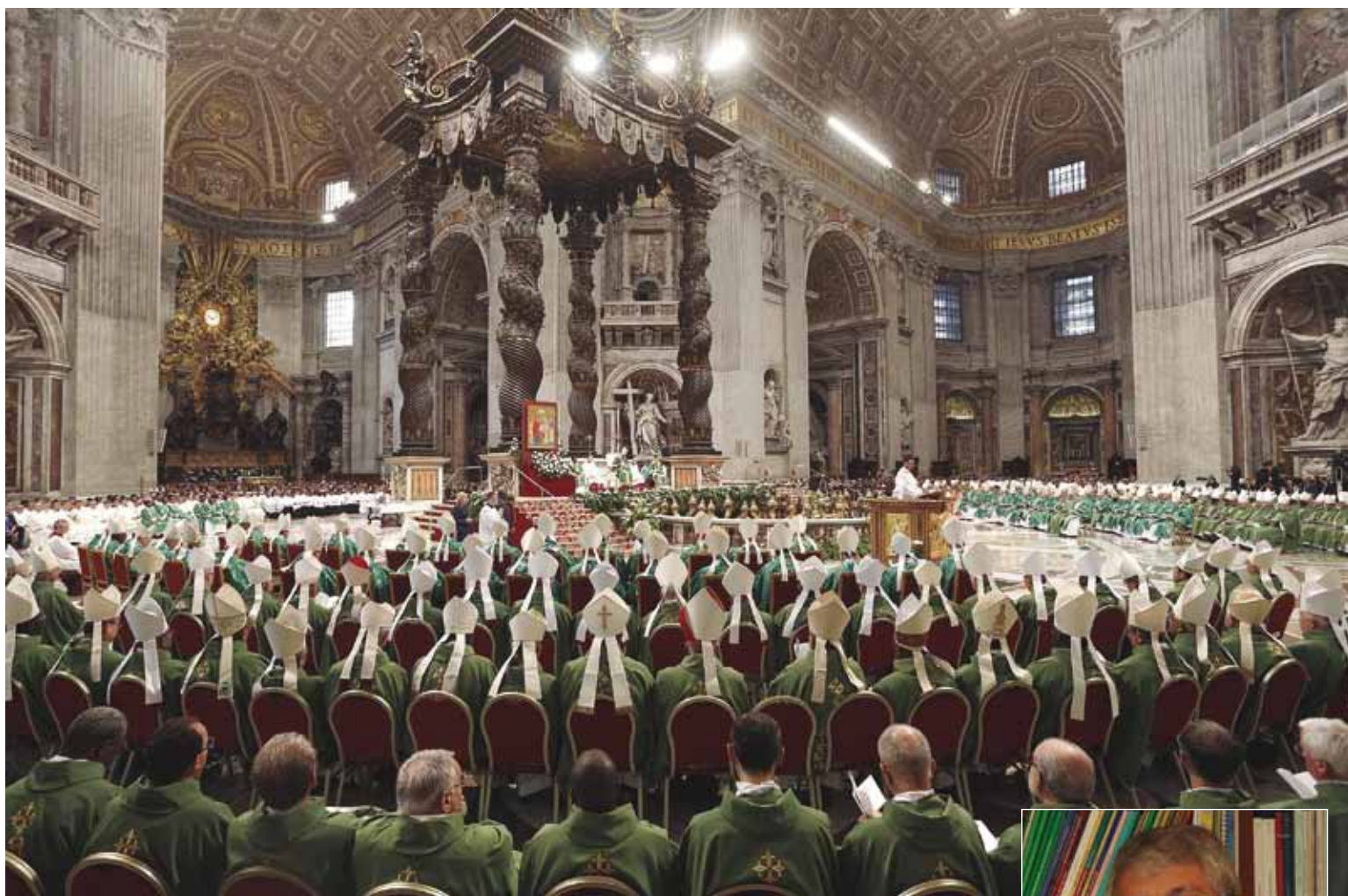
Santa Misa de apertura del Sínodo de Obispos, el pasado 4 de octubre.

El Papa Francisco clausura este domingo el Sínodo sobre la familia inaugurado el pasado 4 de octubre y en cuya apertura invitó a defender «la sacralidad de la vida» y a «defender la unidad y la indisolubilidad del vínculo conyugal como signo de la gracia de Dios y de la capacidad del hombre de amar en serio» (PÁGINA 5).