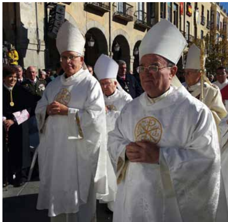
En primer término, el Sr. Arzobispo y el Sr. Nuncio Apostólico en España.