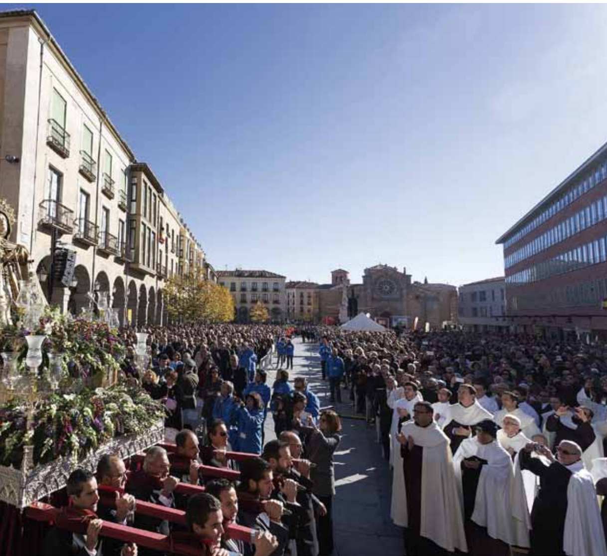
El Preósito General de La Santa hace su entrada en la plaza, antes de comenzar la celebración.