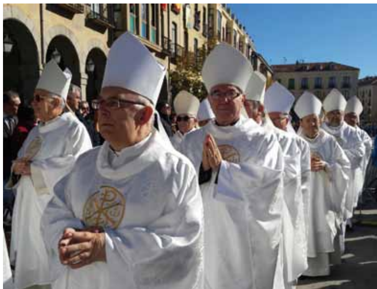
El Sr. Obispo auxiliar, junto a otros obispos concelebrantes.

El presidente de la CEE, que es uno de los obispos españoles participantes en el Sínodo de los obispos, cerró su homilía con una petición: «Uniéndonos a la Asamblea de obispos, que se celebra estos días en Roma, invocamos la intercesión de santa Teresa para que los padres inicien en la fe a sus hijos. La fe se transmite particularmente enseñando a rezar a los niños y rezando con ellos».