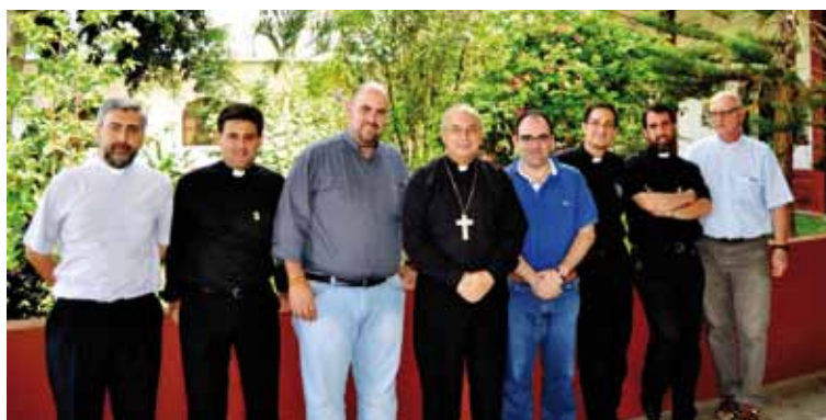
Sacerdotes misioneros de nuestra archidiócesis en la Prelatura de Moyobamba. En la foto de la izquierda, con el Obispo, don Rafael Escudero

En Moyobamba, Prelatura cuyo obispo, don Rafael Escudero, es natural de Quintanar de la Orden, además de la visita a los Seminarios Menor y Mayor, también se conocieron algunos de los proyectos sociales que desarrollan los misioneros diocesanos toledanos, como son comedores sociales, las acciones pastorales y el encuentro con jóvenes, que mostraron,