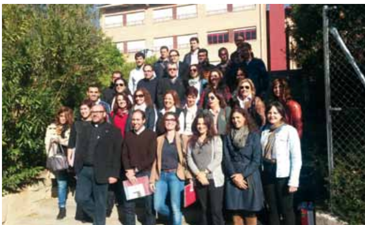
Arriba, la reunión del Sr. Arzobispo con los responsables de los centros. En la foto inferior, el grupo de profesores del Colegio del Santísimo Cristo de la Sangre, de Torrijos.