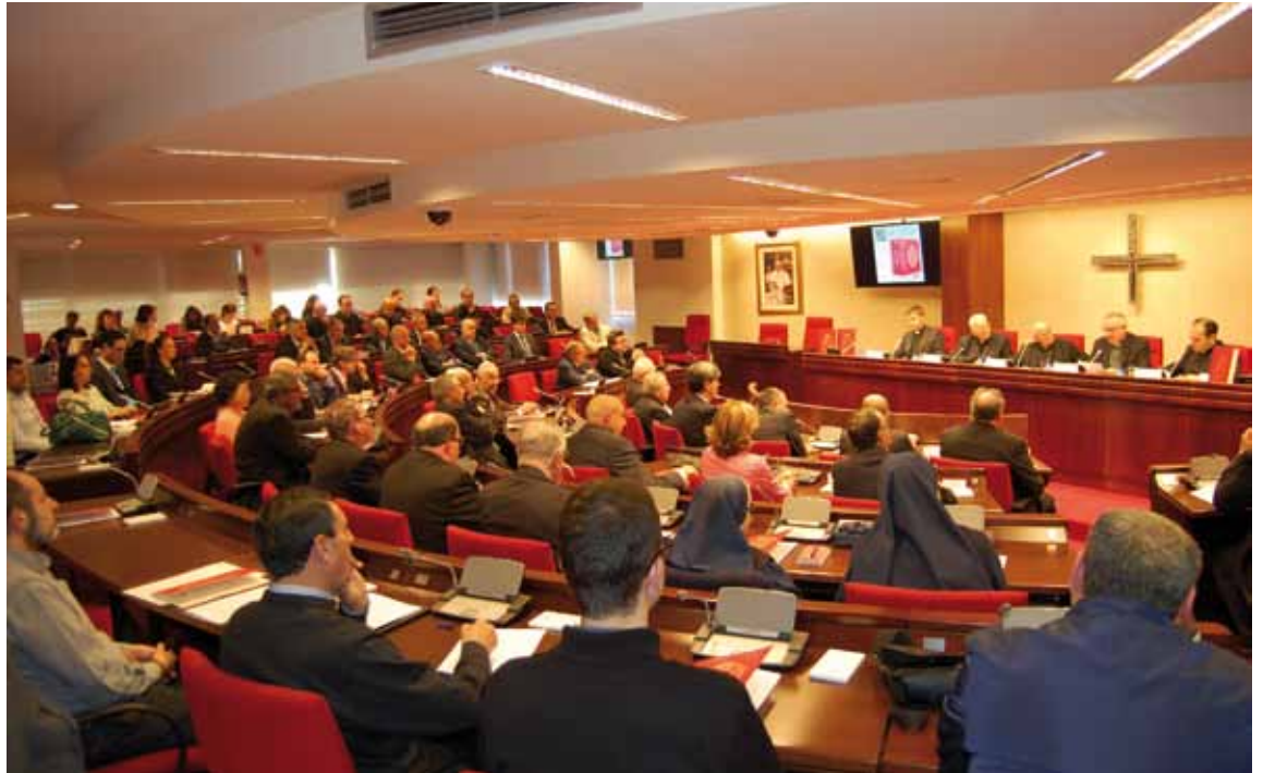
La presentación de los nuevos Leccionarios reunió a numerosos asistentes en la Conferencia Episcopal Española.

En el acto también intervinieron el presidente de la Comisión Episcopal de Liturgia