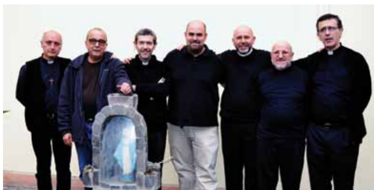
El Delegado Diocesano de Misiones con sacerdotes misioneros en Lurín.