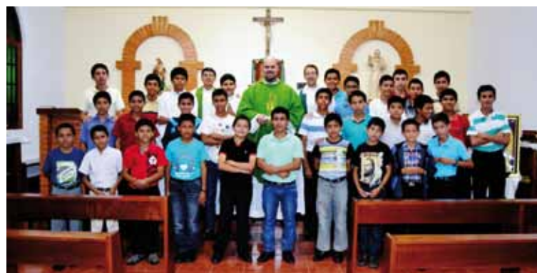
Alumnos del Seminario Menor de Moyobamba.