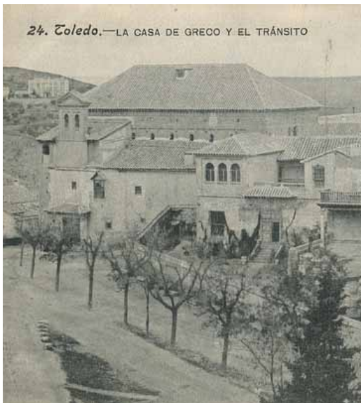
En este lugar del Paseo se realizaban los fusilamientos.