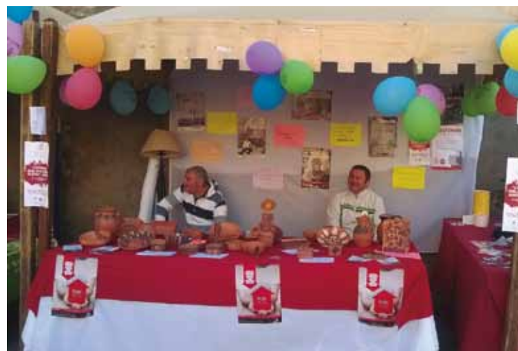
PADRE NUESTRO / 29 DE NOVIEMBRE DE 2015

El balance realizado por los asistentes a este encuentro fue muy positivo, pues un año más la Escuela de Formación de Cáritas se ha convertido en una actividad formativa fundamental para dar lo mejor a los más pobres, pues la competencia profesional por sí sola no basta, necesiándose, como se puso de manifiesto- también una «formación del corazón».