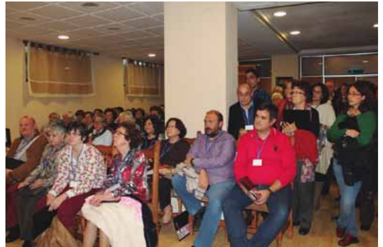
Algunos de los participantes en el encuentro.