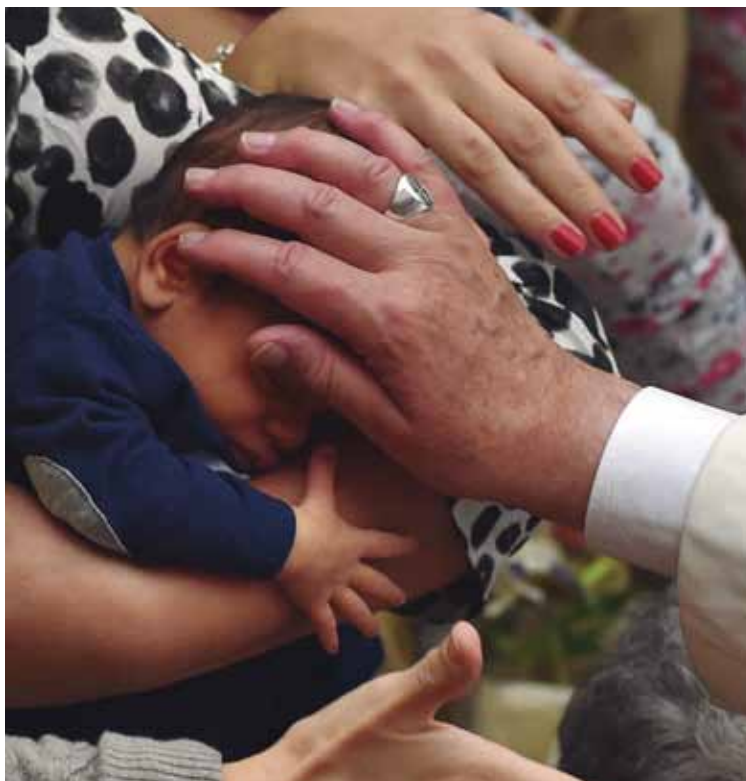
El Papa bendice a un niño que le presentaron sus padres.

Recordó que las familias están invitadas a abrir sus puertas para salir al encuentro de Jesús que nos espera paciente, y que quiere traernos su bendición y su amistad. «Una Iglesia que no fuera hospitalaria o una familia cerrada en sí misma sería una realidad terrible, que mortifica el Evangelio y hace más árido el mundo», afirmó.