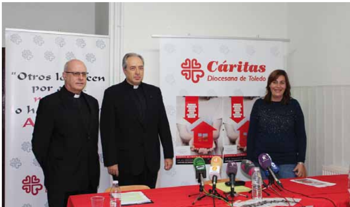
El provicario general, en el centro, junto al delegado episcopal de Cáritas y la coordinadora del programa de personas sin hogar.

El provicario general de la archidiócesis recordó que «Cáritas es la Iglesia haciendo Caridad», y el buen hacer de «Cáritas Diocesana es un signo de credibilidad de la Iglesia, del aquí y del ahora». Además explicó que «las personas sin hogar constituyen el colectivo más marginado de nuestra sociedad, al carecer de las mínimas condiciones de vivienda que les permita vivir con dignidad y la Iglesia Diocesana quiere hacerles compañía». En