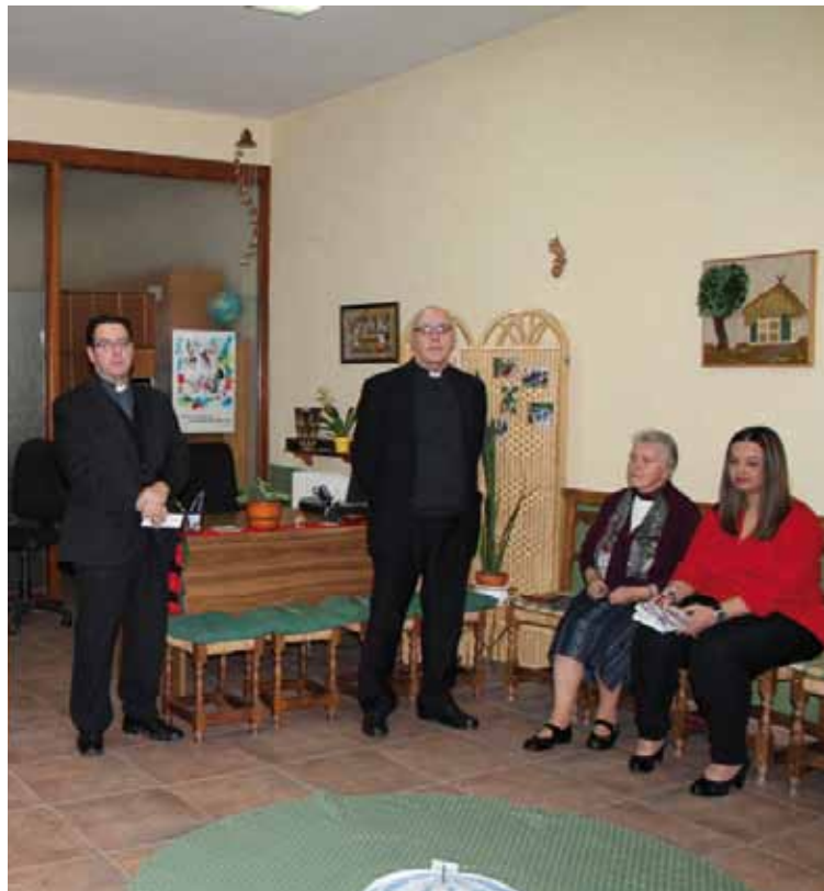
El Vicario Episcopal y el Delegado Diocesano de Cáritas en el acto de inauguración.

Las líneas del trabajo del proyecto son la acogida y valoración de demandas, así como la atención e intervención social, intercultural, psicológica y