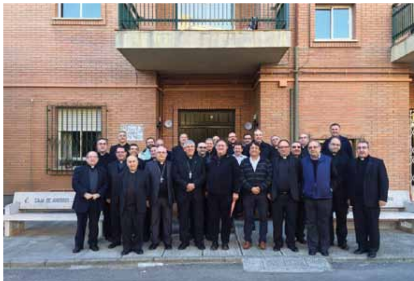
El Sr. Arzobispo, con los nuevos arciprestes tras su reunión en la Casa Sacerdotal de Toledo.

Para el desarrollo de este proyecto el Secretariado Diocesano colabora con Caritas Diocesana de Toledo con sus diversos programas. La colaboración entre el Secretariado Pastoral de Migraciones con Cáritas Diocesana en Talavera es necesaria, siendo un testimonio de unidad eclesial.