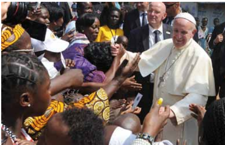
El Papa saluda a los fieles en la capital de la República Centroafricana el pasado domingo.

En «una tierra que sufre desde años la guerra, el odio, la incompreensión, la falta de paz; en esta tierra sufriente, también están todos los países del mundo que están pasando por la cruz de la guerra. Bangui se convierte en la capital espiritual de la oración por la misericordia del Padre. Todos nosotros pidamos paz, misericordia, reconciliación, perdón. Para Bangui, para toda la República