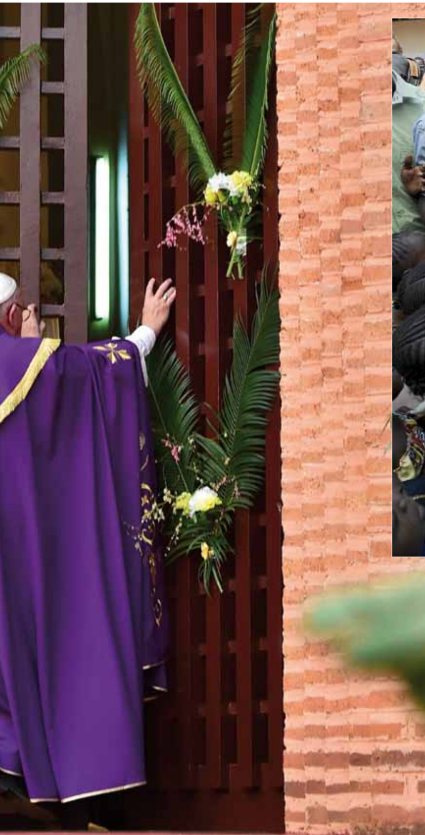
al de Bangui, una «tierra sufriendo» a causa de la guerra y la violencia.