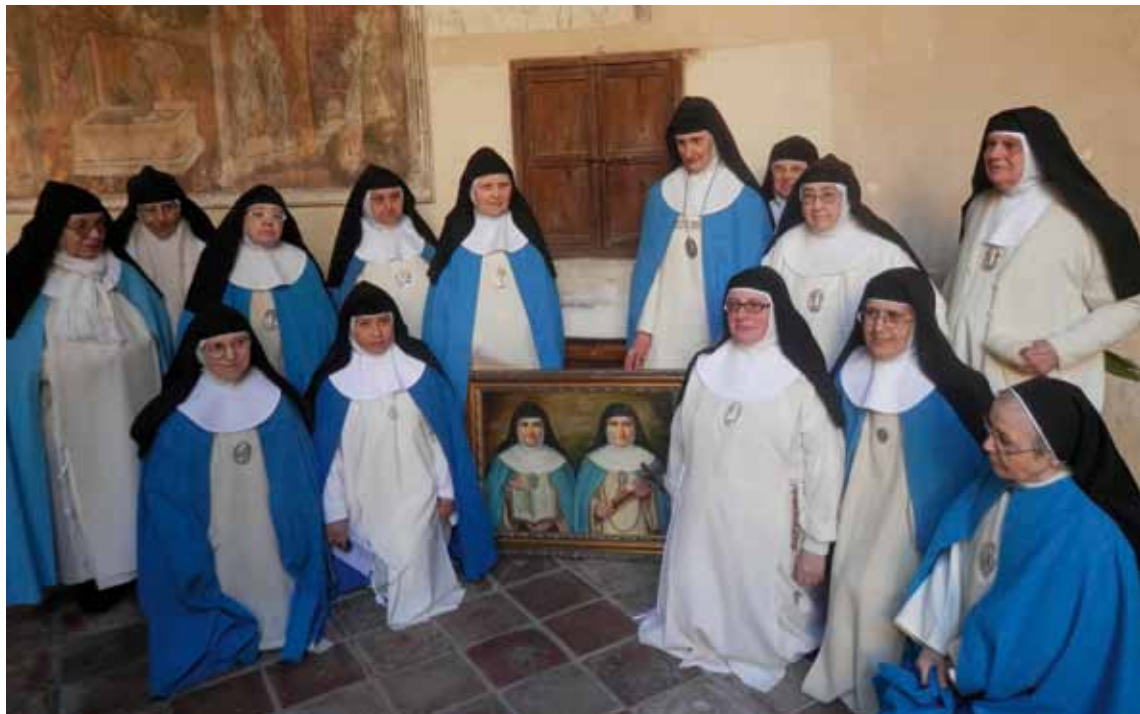
La comunidad de la Casa Madre de Toledo, con dos religiosas de El Pardo, ante la imagen de las dos religiosas mártires.