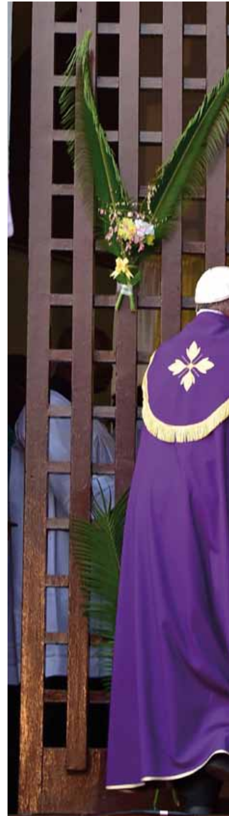
El Papa Francisco abrió la «Puerta Santa» de la catedral

Centroafricana y para todo el mundo, los países que sufren la guerra pidamos la paz. Y todos juntos pidamos amor y paz. Y ahora, con esta oración comenzamos el Año Santo aquí en esta capital del mundo hoy», dijo el Papa Francisco antes de iniciar el rito, en un domingo intensísimo de actividades y encuentros con autoridades civiles, políti-