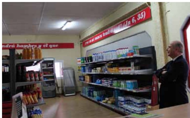
El director de Cáritas Diocesana en las instalaciones del economato de Toledo.