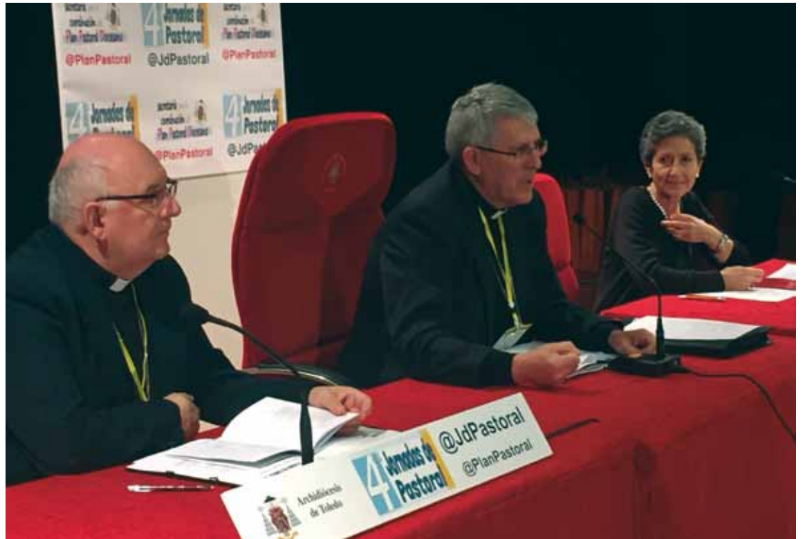
El Sr. Arzobispo, durante la presentación de las Jornadas, el pasado 8 de enero.

En cada edición se busca «la comunión entre la Iglesia diocesana y la Iglesia doméstica, presentando iniciativas y acciones que nos ayuden a todos a