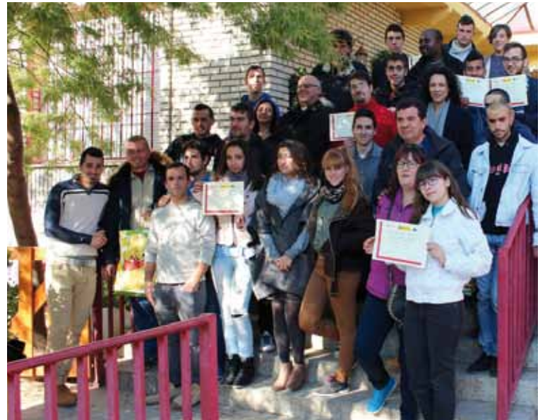
Entrega de diplomas a los alumnos de los talleres de empleo.

En el área de vivienda, gracias al programa de Vivienda «Betania», en febrero de 2015, comenzaron a vivir en una vivienda digna las primeras familias. Este programa está destinado a personas o familias que se encuentren en situación de vulnerabilidad social, llevando a cabo tareas de acompañamiento social y apoyo a la inserción. Cáritas, mediante este programa, facilita un alojamiento transitorio que permita la integración e inserción, favoreciendo el desarrollo laboral, social y humano de las personas y familias atendidas.