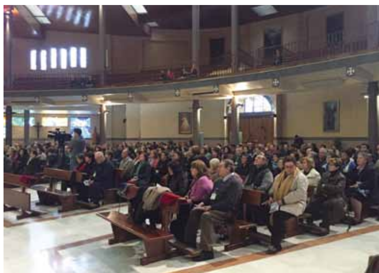
Los participantes en las Jornadas durante la Santa Misa en rito hispano-mozárabe, el día 8.

Finalmente, propuso recuperar el valor de la solidaridad, fundamental en las condiciones de desigualdad creciente que viven nuestras sociedades, habitadas por la cultura del descarte. Así el bien común, es decir el conjunto de condiciones que permiten el desarrollo de cada persona y de la comunidad en su conjunto, se transforma inevitablemente «en una llamada a la solidaridad y en una opción preferencial por los más pobres».