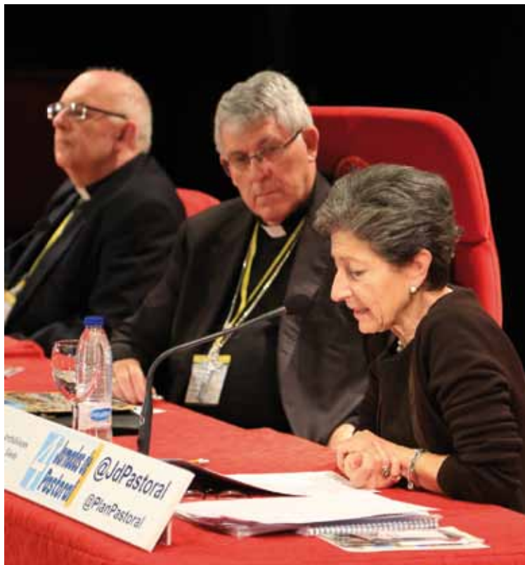
La profesora Giovanelli junto al Sr. Arzobispo durante su conferencia.

Además dijo que la fraternidad es esencial para el desarrollo integral. Así, mientras la razón es capaz de aceptar la igualdad entre los hombres y de establecer una convivencia cívica entre ellos, no consigue fundar la hermandad sin la que