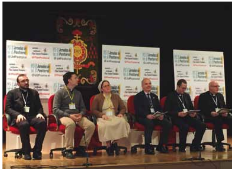
Presentación de las experiencias extradiocesanas.

En las experiencias diocesanas intervinieron varias Fundaciones Canónicas que dieron a conocer las acciones de atención a mayores, atención a la discapacidad y otras personas. La Fundación Centro de Orientación Familiar (COF) presentó YoenTi; el Secretariado de Pastoral de la Salud, compartió el testimonio de profesionales del ámbito sanitario; Cáritas Diocesana de Toledo, ofreció una ponencia sobre el Programa de Personas sin Hogar en el Centro de Alojamiento de Urgencia: Albergue «Cardenal González Martín»; Confer Diocesana presentó la experiencia de distintas congregaciones religiosas de atención a diferentes colectivos; la Delegación de Apostolado Seglar, presentó el estudio y difusión de la Doctrina Social de la Iglesia en distintos ámbitos eclesiales. Por su parte, la Delegación de Ocio y Tiempo Libre expuso los proyectos diocesanos realizados en parroquias relacionados con la naturaleza, el deporte y el ocio; el Proyecto «Mater»