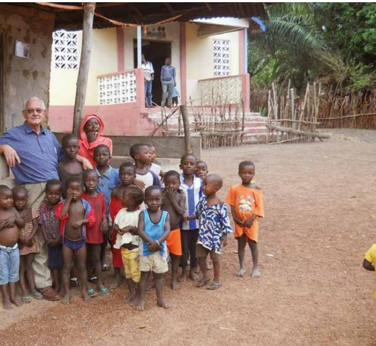
ón en Sierra Leona, afirma que «la misión sigue siendo necesaria, porque tenemos que proclamar el Evangelio y compartir la fe».

ni cuántos morirían, mientras en Sierra Leona tardó mucho el aislamiento, la ayuda, que si hubiera llegado seis meses antes se hubieran evitado muchas de las consecuencias».