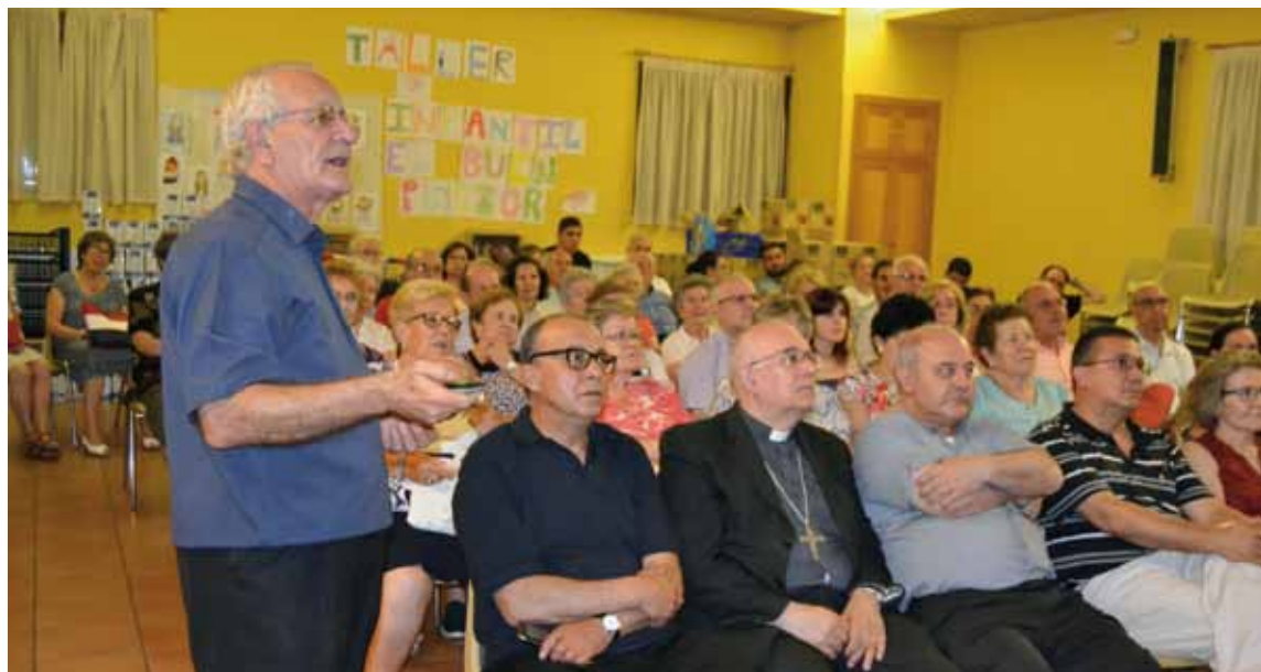
El obispo auxiliar, el delegado de misiones y el párroco de El Buen Pastor, durante la charla.

del Congo sabemos que existía ébola desde hace treinta años, casi todos los años, pero ellos ya sabían que tenían que aislar una aldea, aunque no sabíamos ni cuántos quedarían en la aldea