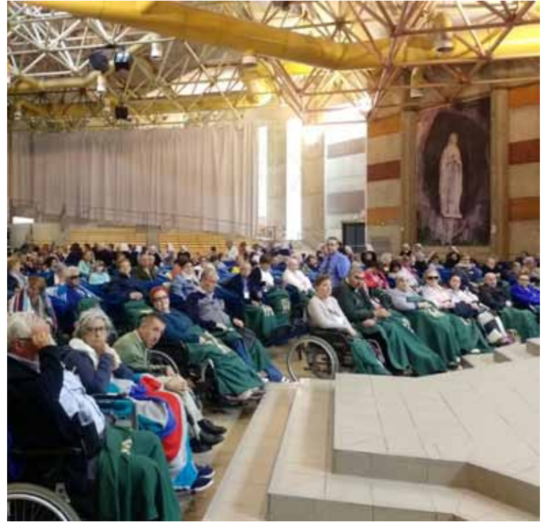
Via Crucis con enfermos y acto final de adoración al Santísimo.