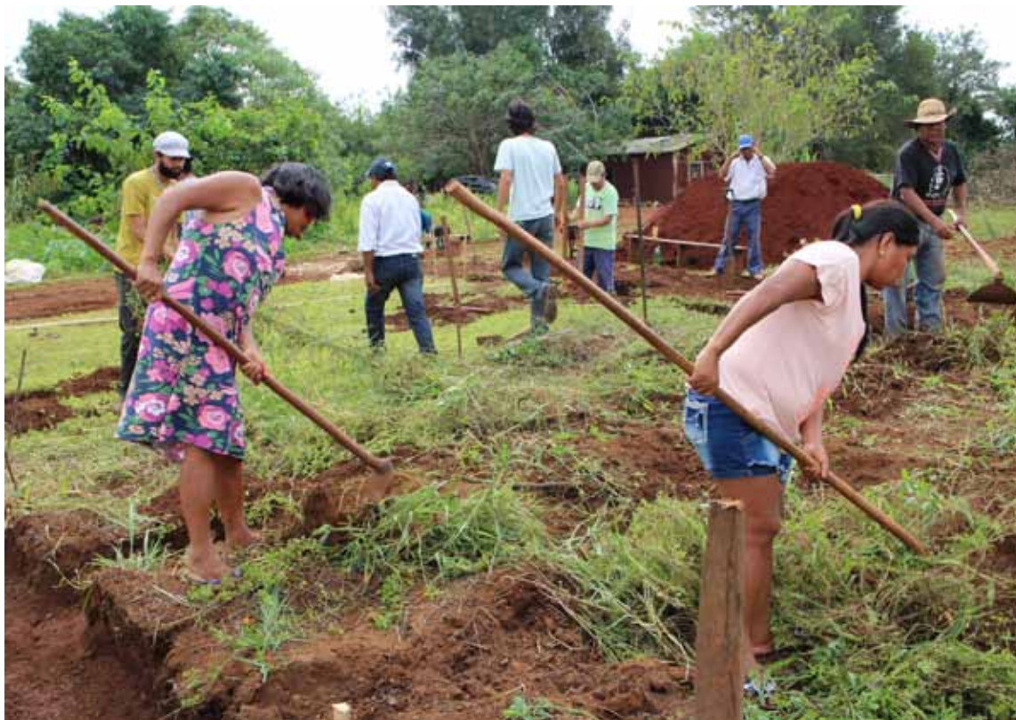
Proyecto de desarrollo agrario en Brasil.

Gran parte de los proyectos aprobados en 2016 se localizan en el medio rural, lo que favorece la permanencia de la población en su entorno, el cuidado del medio ambiente y el respeto a las culturas y medios de vida locales. En este sentido, destaca el trabajo con las poblaciones indígenas, con el objetivo de que sus territorios y sus culturas sean respetados y que cuenten con herramientas suficientes para defender sus derechos y satisfacer sus necesidades básicas