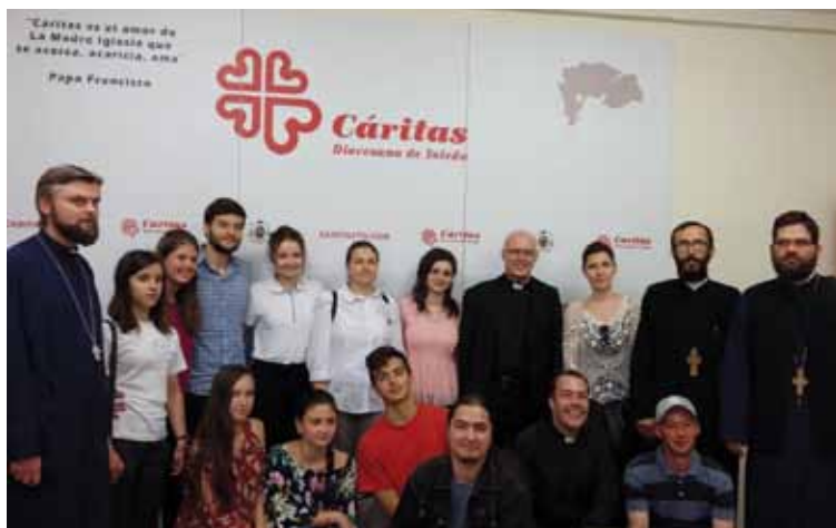
El grupo de jóvenes de la Iglesia ortodoxa rumana durante su visita a Caritas.