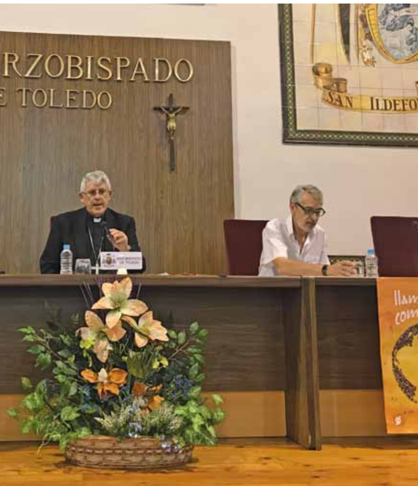
y del coordinador regional de Cáritas Castilla-La Mancha.

libros y material escolar, aseo e higiene, alojamiento.