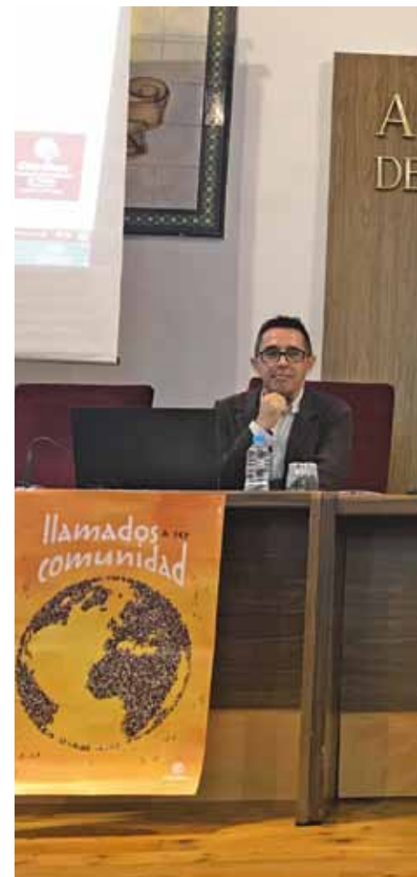
El Sr. Arzobispo, acompañado del presidente regional.