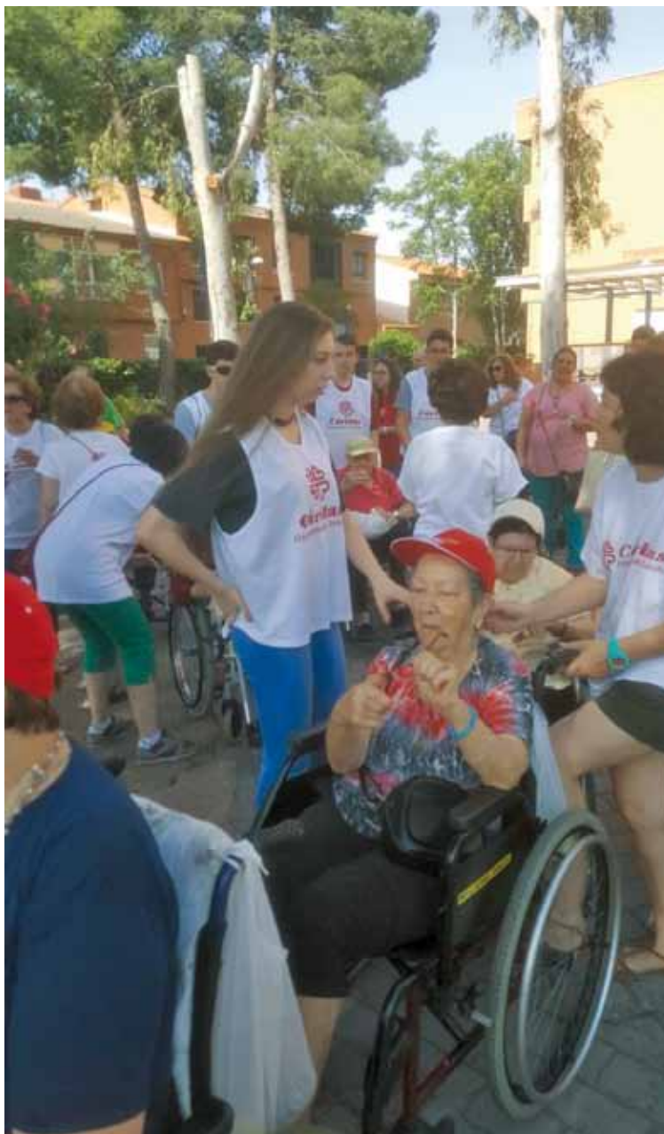
Jóvenes voluntarios de Cáritas de Torrijos prestan su ayuda a personas mayores.

«Cuarta vía» para la beatificación: dar la vida por el prójimo, impulsados por la caridad