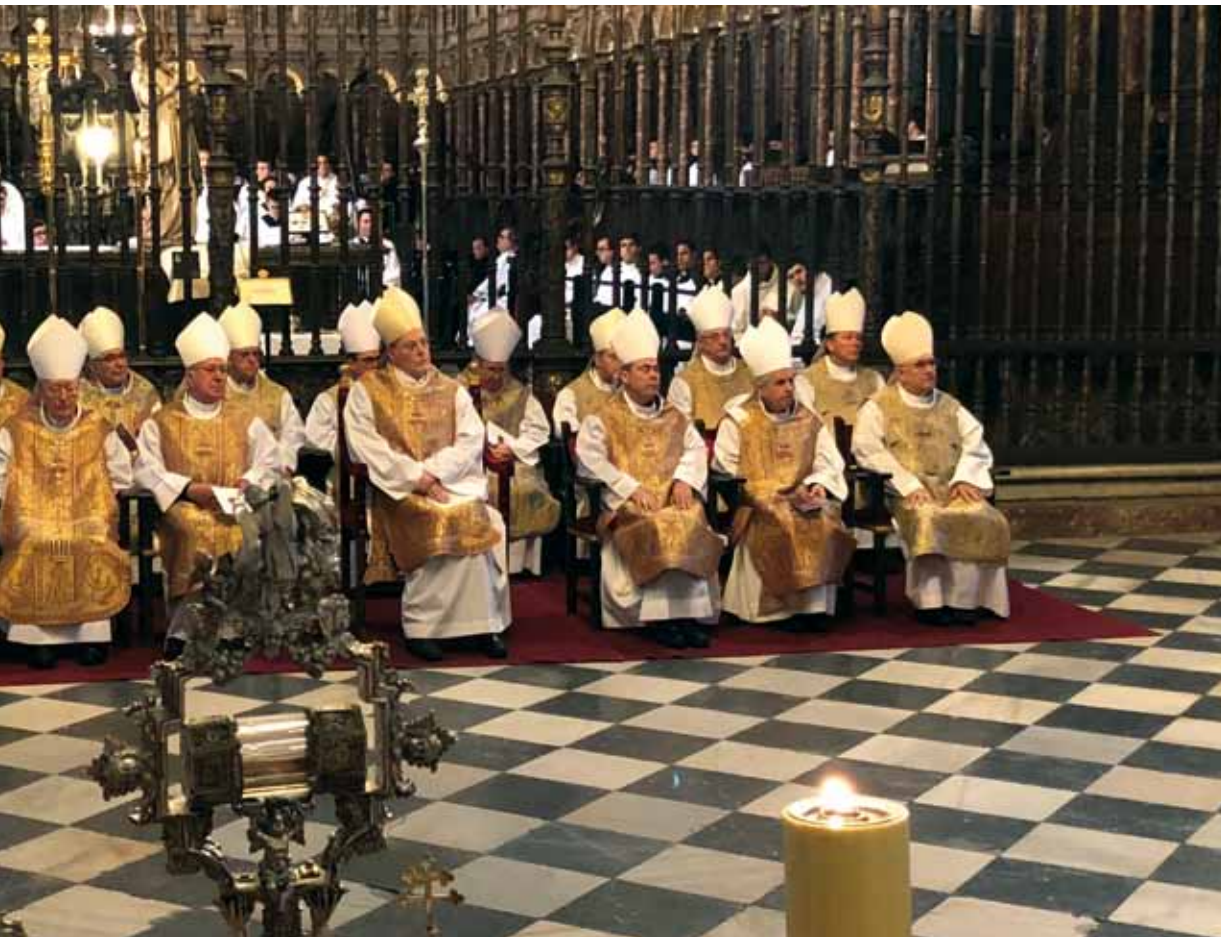
El 23 de enero. En primer término, el relicario con la reliquia de san Ildefonso que se conserva en la catedral primada.