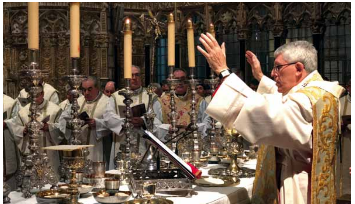
Entre los concelebrantes se encontraba el Secretario General de la Conferencia Episcopal Española.