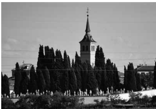
Iglesia de Mocejón, con las tapias del cementerio en primer plano.