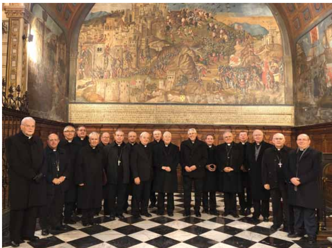
Los Obispos, junto con el Nuncio en España y en Secretario General de la Conferencia Episcopal, durante su visita a la exposición.