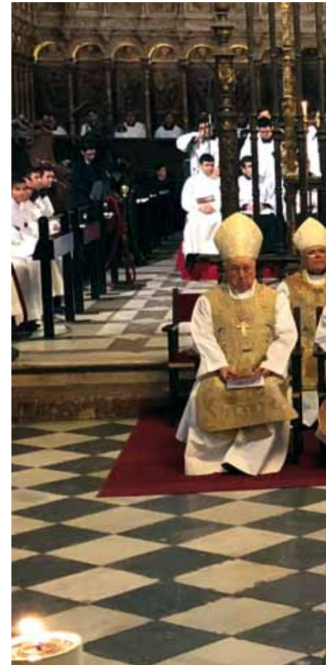
Los obispos concelebrantes en la Santa Misa, el pasado 23 de enero.

Después, siguiendo los textos de la Santa Misa, don Braulio quiso añadir también una nueva petición al Señor: «Pedimos no envanecemos en