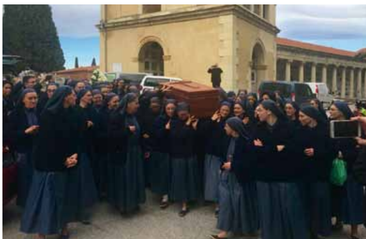
Arriba, la misa de exequias, presidida por el obispo de Alcalá de Henares. En la foto inferior, religiosas de la Fraternidad Reparadora portan el féretro en el cementerio.

tanto de amado por Dios, creado, elegido, llamado y enviado a llevar adelante una misión espiritual y evangelizadora y, siendo voz, palabra, pies, manos, corazón ardiente y amado de Cristo para los demás».