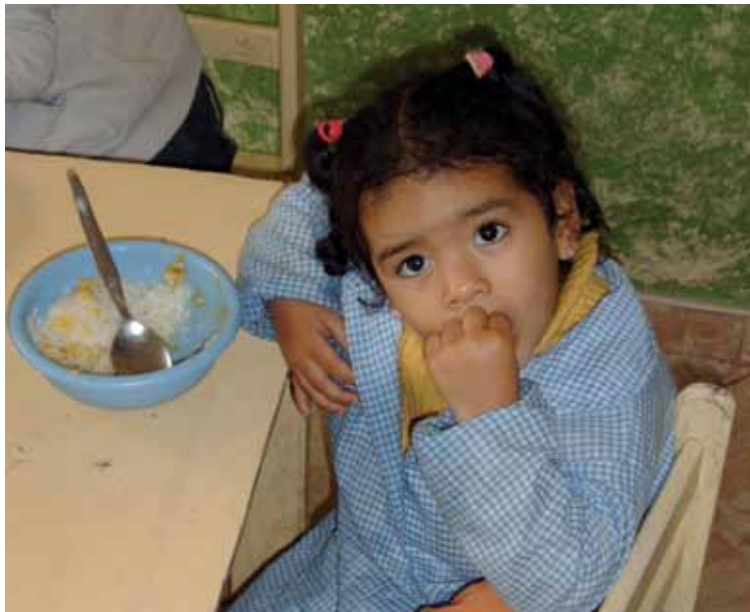
Una niña come en el Centro de Atención Infantil María Inmaculada, en Villa El Salvador (Perú)

«Plántale cara al hambre: comparte». Y este año cerramos el trienio compartiendo, porque compartir permitiría erradicar el