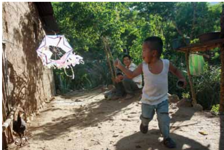
Niño jugando con una cometa en Guatemala.