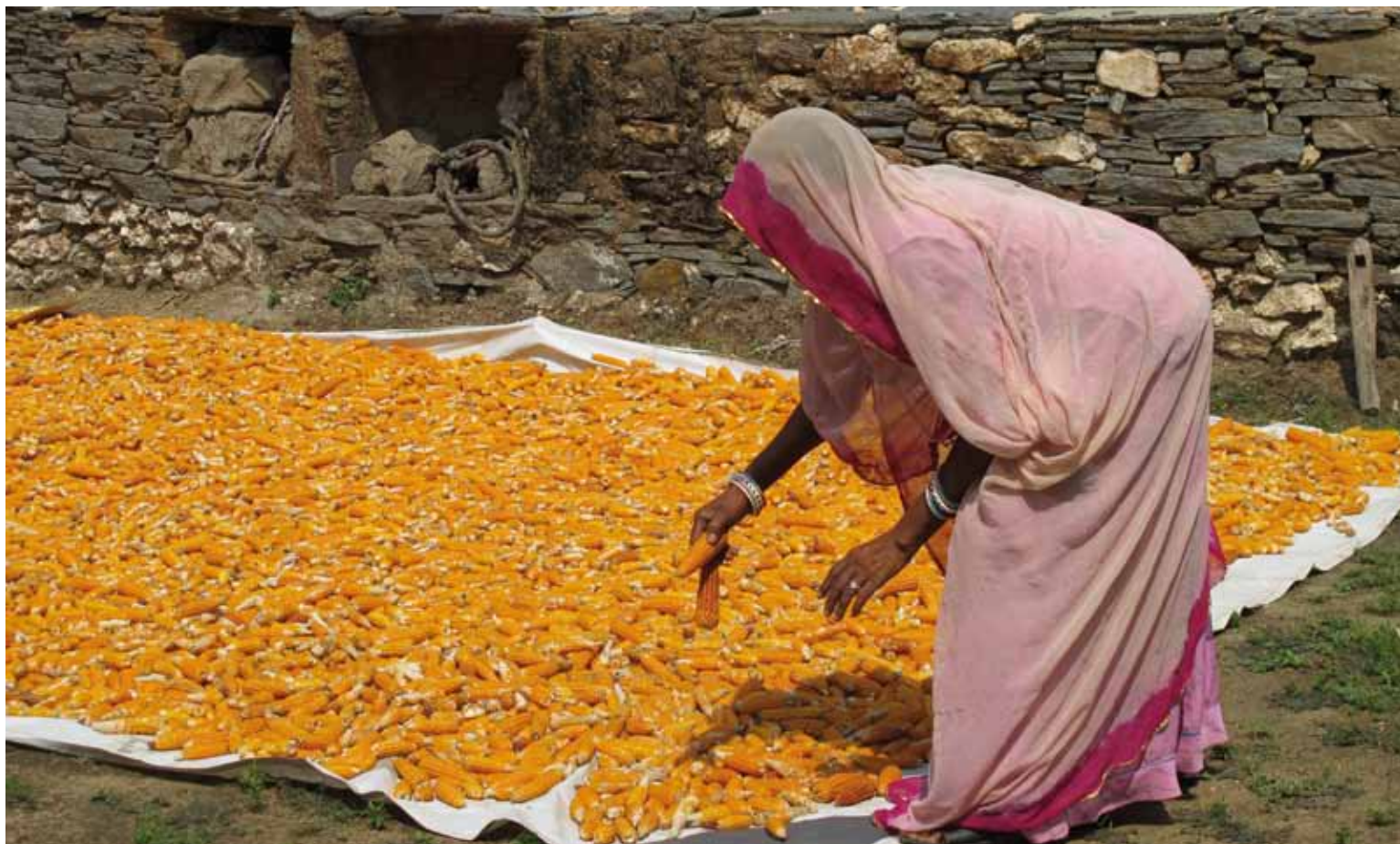
Una mujer seca mazorcas de maíz en India.