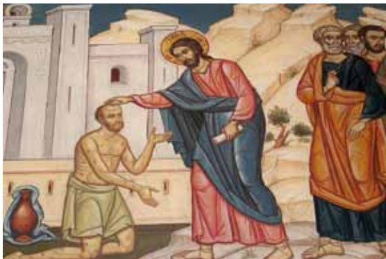
PADRE NUESTRO / 11 DE FEBRERO DE 2018

Pero cuando se fue, empezó a pregonar bien alto y a divulgar el hecho, de modo que Jesús ya no podía entrar abiertamente en ningún pueblo; se quedaba fuera, en lugares solitarios; y aun así acudían a él de todas partes.