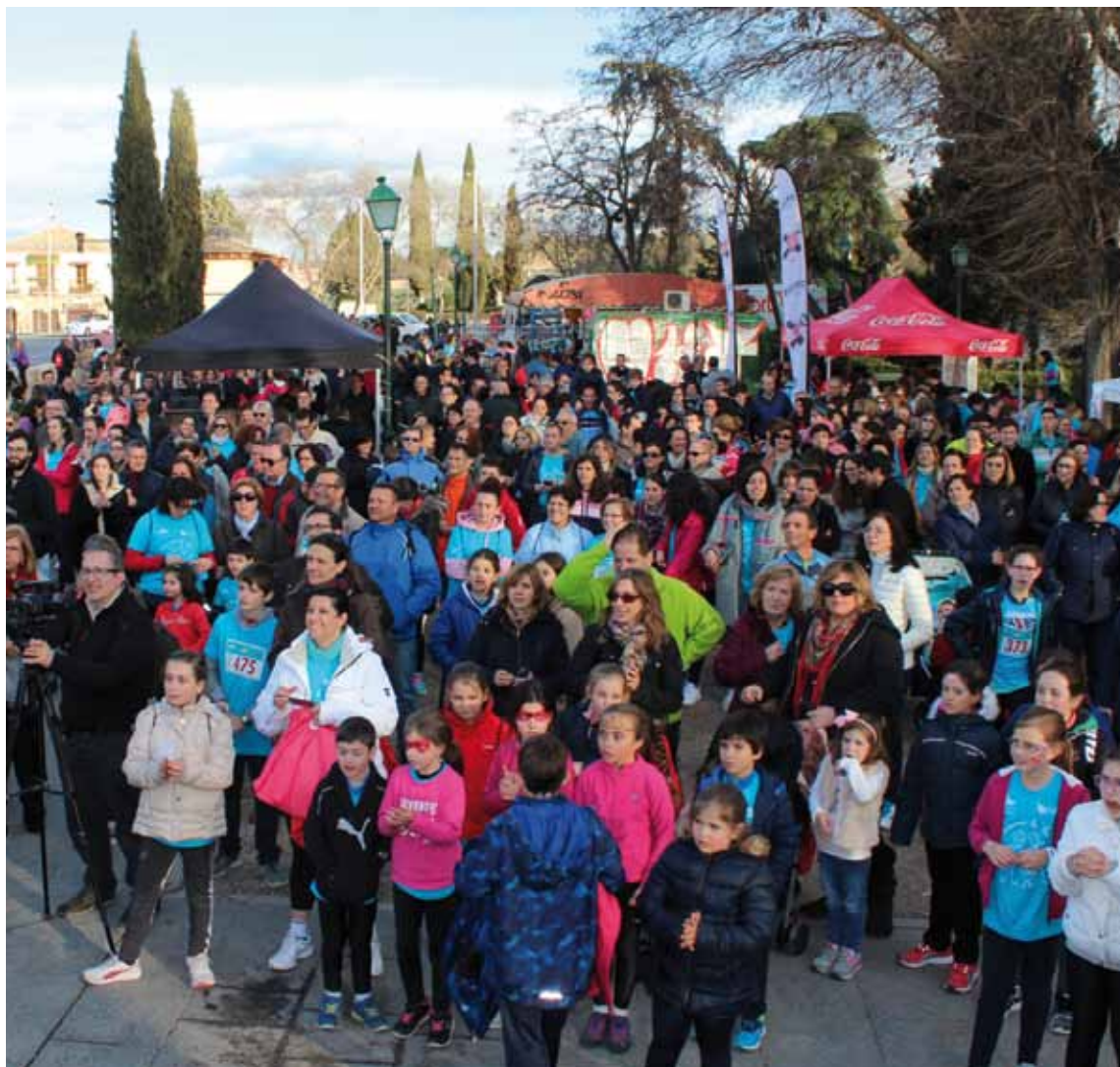
Algunos participantes en la Fiesta el pasado año.