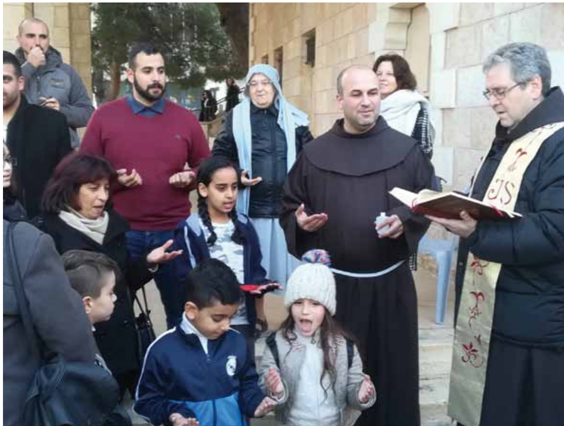
Inauguración de un parque infantil en la ciudad de Belén.