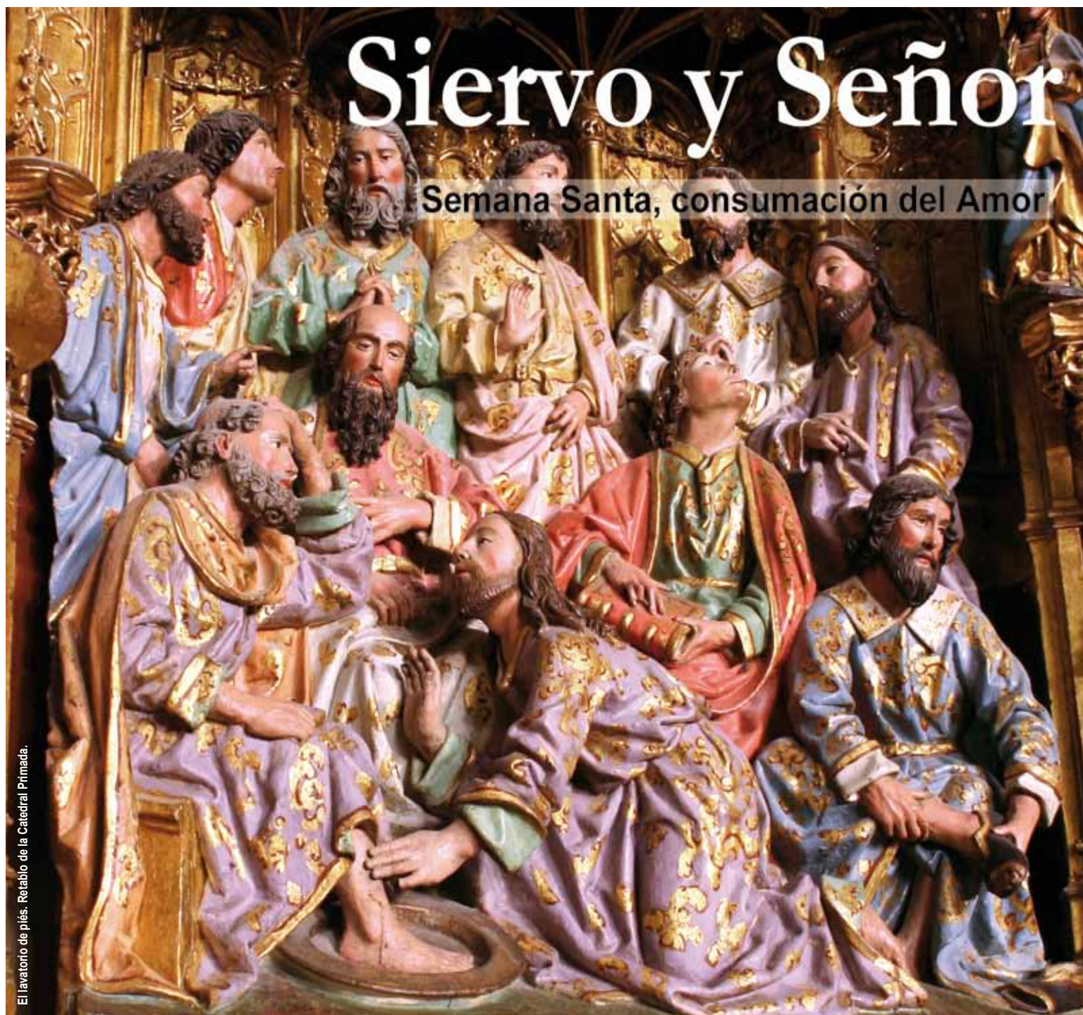
El lavatorio de piés. Retablo de la Catedral Primada.