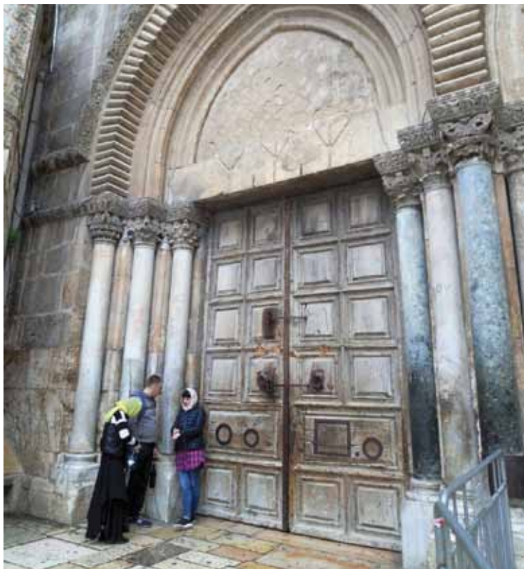
El Santo Sepulcro cerrado durante tres días, en protesta por las medidas legales y fiscales.

Además, «no podemos olvidar a las miles de familias que han escapado de la violencia de la guerra en Siria e Irak, y que cuentan con tantos niños y jóvenes, muchos de los cuales en edad escolar, los cuales confían en nuestra generosidad, de modo que puedan volver a la vida escolar y, así, puedan también soñar con un futuro mejor».