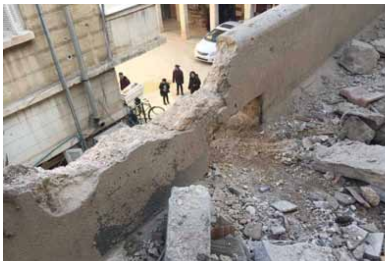
En Damasco, conventos e iglesias bajo las bombas.

este sentido, durante el pasado año se distribuyeron ayudas por un importe de 1.611.570 de dólares, a iglesias y comunidades de Jerusalén, Jordania, Irak, Líbano, Turquía, Irán, Egipto, Etiopía y Eritrea.