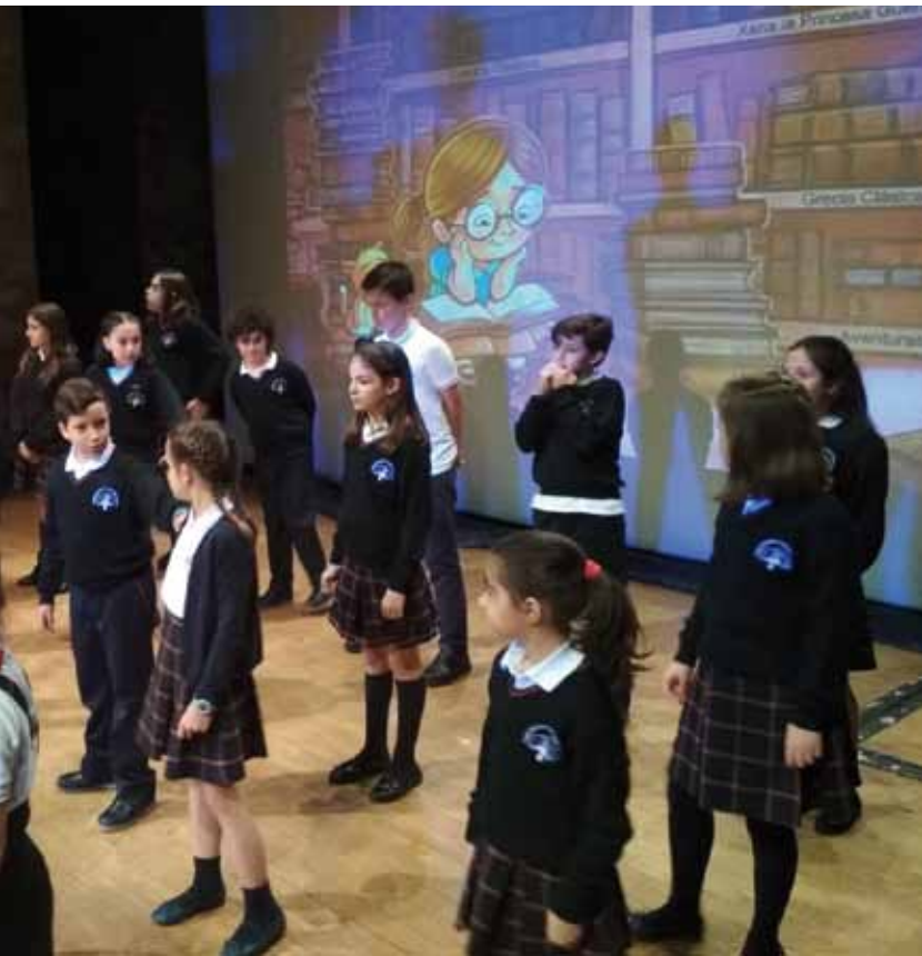
En la foto superior, niños de un Colegio Diocesano realizan una escenificación sobre el tema del plan pastoral de este curso. Debajo, visita Cáritas parroquial de Torrijos. En la página anterior, el Sr. Arzobispo durante la Santa Misa.