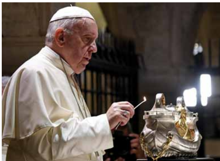
El Papa enciende, en Bari, la lámpara de una sola llama.

En su discurso el Papa también dedicó un pensamiento final a los millones de niños víctimas de la pobreza, muerte y destrucción a causa de las guerras: «La esperanza tiene el rostro de los niños. En Oriente Medio, durante años, un número aterrador de niños llora a causa de muertes violentas en sus familias y