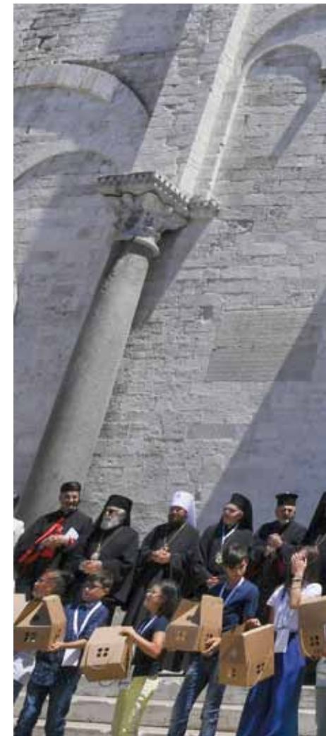
Varios jóvenes sueltan palomas, en la ciudad de Bari, Italia.

«Que las lámparas que colocaremos sean signo de una luz que aun brilla en la noche. Los cristianos, de hecho, son luz del mundo (cf. Mt 5,14), pero no sólo cuando todo a su alrededor es radiante, sino