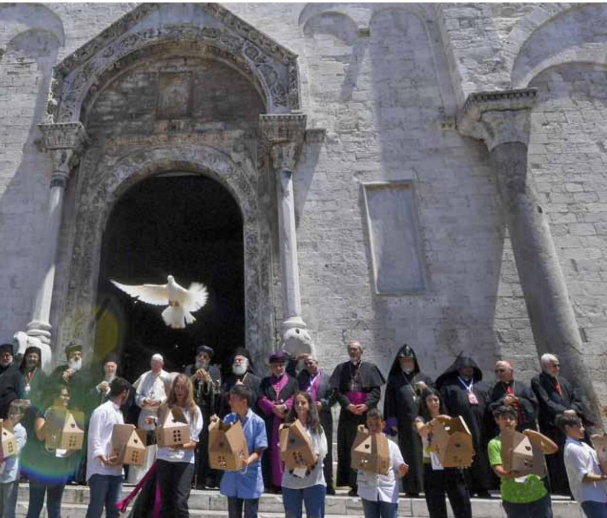
ante el Papa y los líderes de las diversas confesiones cristianas, durante el encuentro ecuménico de oración por la paz.