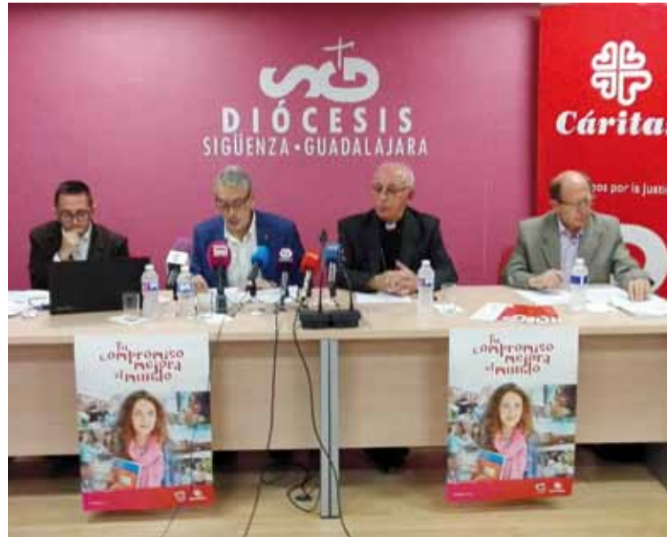
El obispo de Sigüenza-Guadalajara realizó la presentación de la Memoria de Cáritas CLM.

Según don Atilano «hablar hoy de compromiso no está de moda. Suena a trasnochado, a