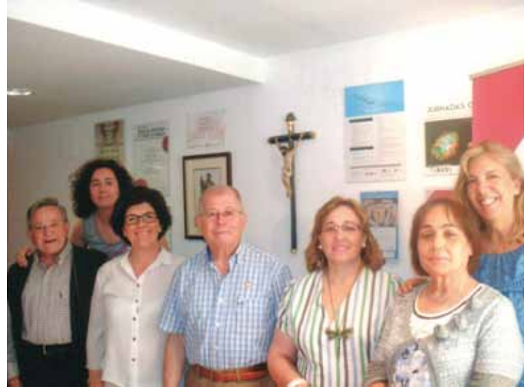
Algunos miembros de la ACdP de Toledo.

Sabiendo aquello que tanto se repite, «que los ejemplos mueven», se realizó una selec-