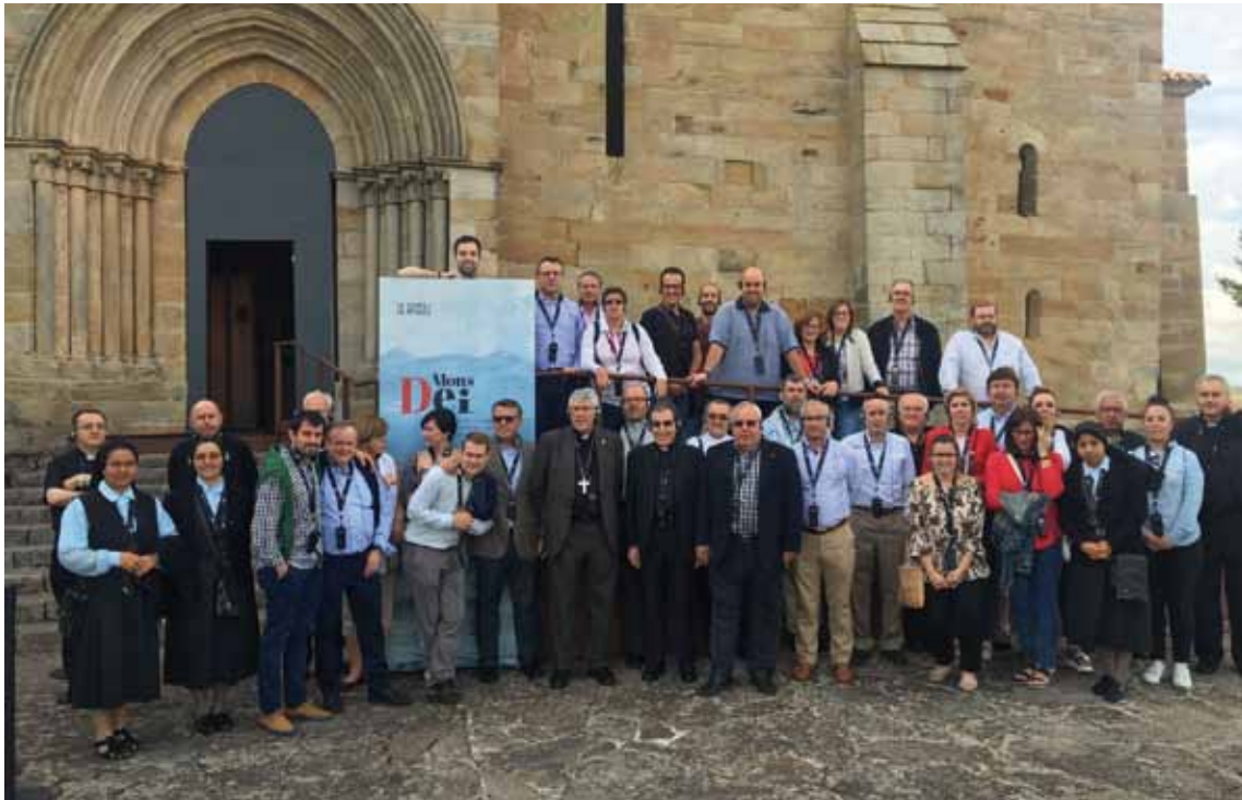
Algunos de los participantes en el encuentro durante su visita a la exposición «Las Edades del Hombre».

DE LOS ÁMBITOS EDUCATIVO, SOCIAL, SANITARIO Y CULTURAL