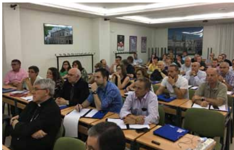
El Sr. Arzobispo y el Obispo auxiliar, durante una de las sesiones de trabajo.

Una representación muy notable en este encuentro me-