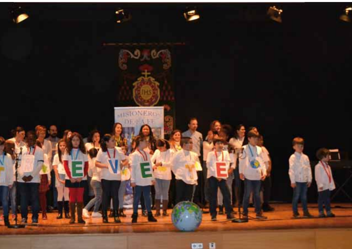
Presentación Misionera de este año, muestra el lema de la jornada.

Desde Misiones Toledo, dado el compromiso misionero de la Archidiócesis, también se han subvencionado algunos proyectos misioneros en países de América Latina, entre ellos, Perú, Argentina y Brasil, y otros lugares del mundo, que están dando cobertura pastoral y social a cerca de 500.000 personas, lo que supone un esfuerzo en el que se han unido particulares, cofradías y hermandades, instituciones, que asumen como propio el acompañamiento de todos y cada uno de los misioneros de Toledo que piden la colaboración para sus proyectos.