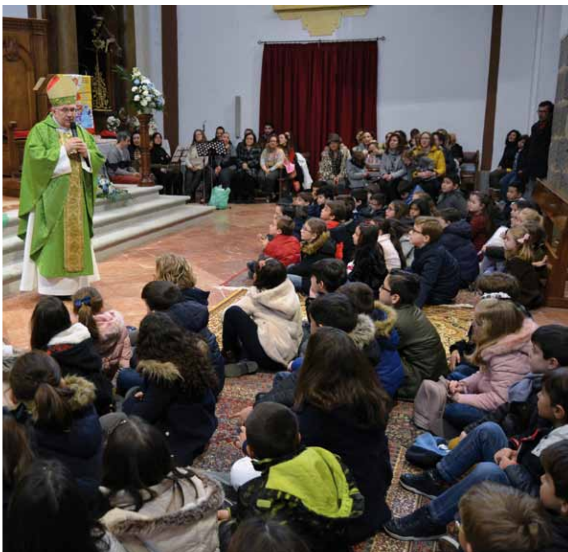
El Sr. Obispo auxiliar se dirige a los niños participantes en la Santa Misa de la Jornada de la Infancia Misionera de este año.