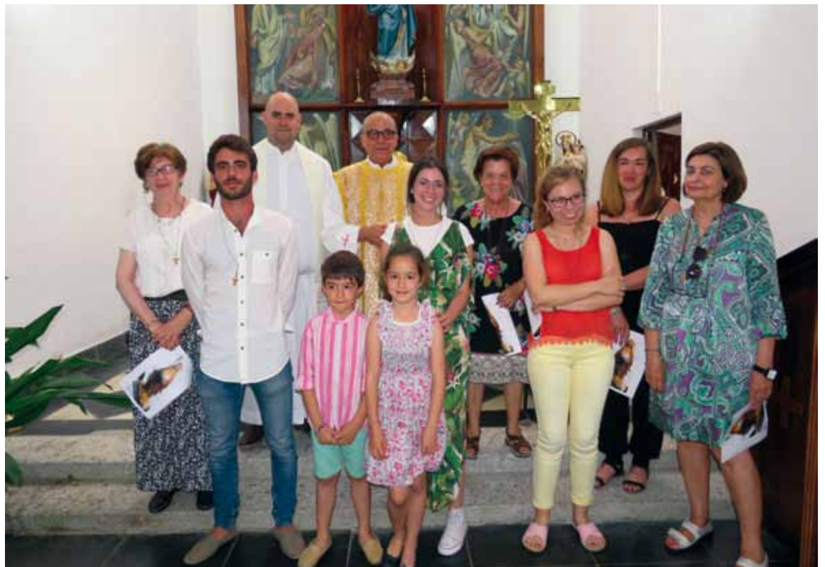
Algunos de los participantes en la edición de «Verano Misión» de este año, con el delegado diocesano de misiones y OMP.

a más personas, que quieren sumarse al movimiento misionero que, especialmente promovido por el Papa Francisco, nos llevará a la celebración del Mes Misionero Extraordinario, convocado para el mes de octubre de 2019.