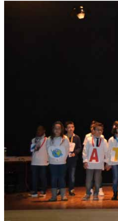
Un grupo de niños participante en el Festival de la Can

Durante el año 2017, y en lo transcurrido del 2018, la Dirección Diocesana de Obras Misionales Pontificias y la Delegación de Misiones, han organizado cinco conferencias, quince testimonios misioneros, diez presentaciones de campañas, quince visitas a colegios, y el festival de la canción misionera, entre otras actividades, llegando cada vez