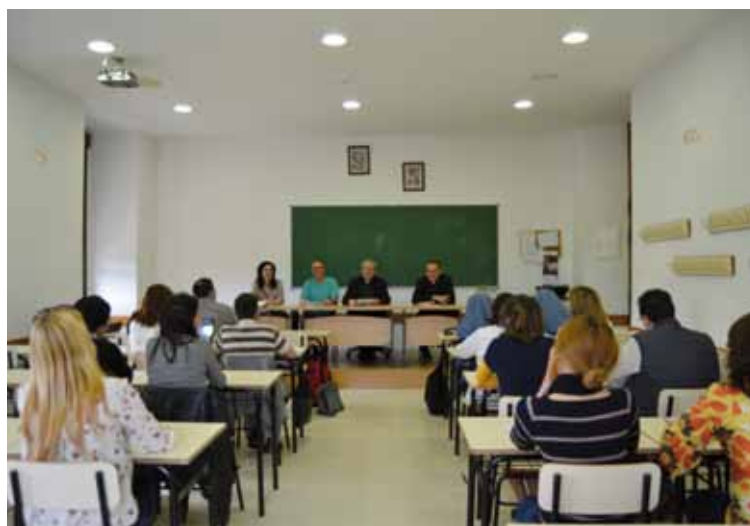
Alumnos del Instituto en una de las sesiones académicas.

La finalidad del Instituto es ofrecer una formación universitaria, con reconocimiento