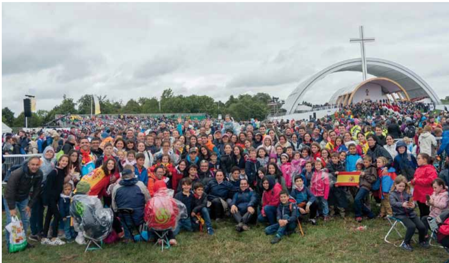
Cerca de 300 participantes de nuestra archidiócesis, acompañados del Sr. Arzobispo, asistieron al Encuentro en Dublín.

Sesenta familias de nuestra archidiócesis y once sacerdotes, acompañados por el Sr. Arzobispo, participaron en el Encuentro Mundial de las Familias celebrado en Irlanda. En él, la archidiócesis de Toledo, a través de la Delegación de Familia y Vida, ha tenido un papel relevante en los actos del Congreso.