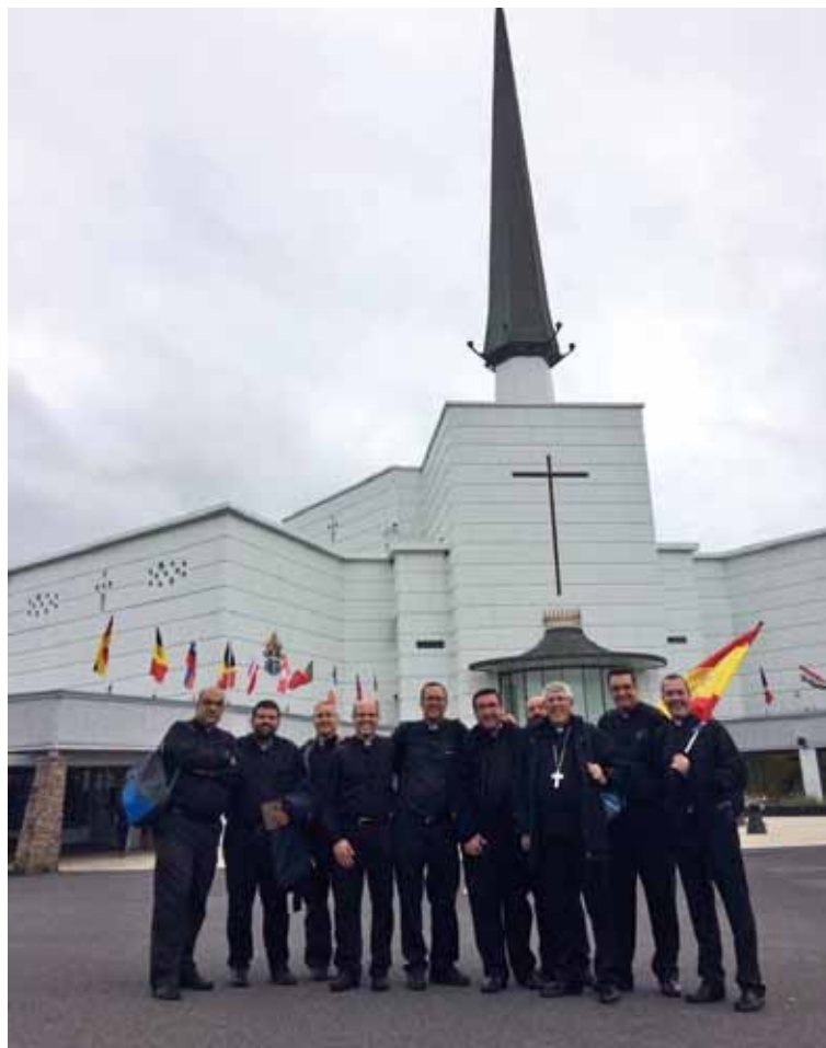
El Sr. Arzobispo, con algunos sacerdotes, en el santuario de Knock.