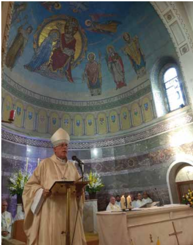
El Sr. Arzobispo, en una celebración eucarística con el grupo de nuestra archidiócesis.

En este sentido, para aplicar las exigencias pastorales que brotan del Evangelio de la fa-