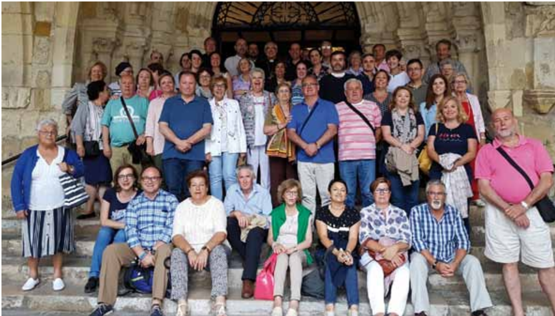
VISITARON VARIOS MONASTERIOS