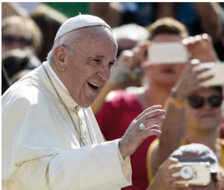
El Papa Francisco durante la audiencia del pasado 29 de agosto.

Asimismo, el Santo Padre señaló que, los verdaderos puntos-luz de estos días fueron los testimonios de amor conyugal dados por parejas de todas las edades. «Sus historias –precisó el Pontífice– nos recordaron que el amor del matrimonio es un don especial de Dios, que