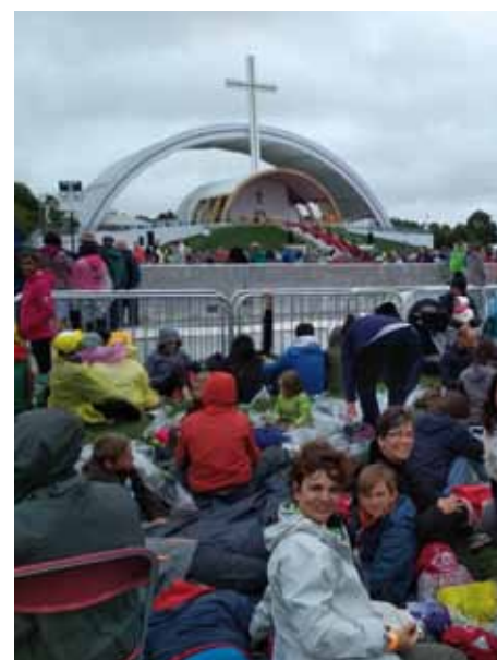
En la foto superior, un momento de la presentación del

sido, «sin duda, la presentación del Grupo Santa Teresa».