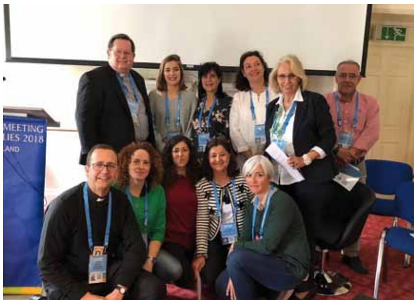
proyecto «Family Rock». Debajo, una familia de nuestra archidiócesis se prepara para el Festival. A la derecha, con el arzobispo de Quebec.