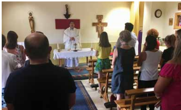
La eucaristía es fuente de caridad, en la Iglesia y en la familia.

Respecto al segundo objetivo, el programa pastoral para el