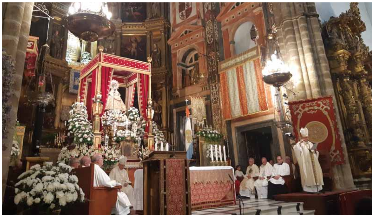
El Sr. Arzobispo, en la homilía de la Santa Misa, el pasado 8 de septiembre, en la villa de Guadalupe.

En la homilía de la Santa Misa del pasado 8 de septiembre, el Sr. Arzobispo pidió también a la Virgen que proteja a «nuestras Iglesias, a nuestro pueblo, a las comunidades cristianas y a la comunidad política»