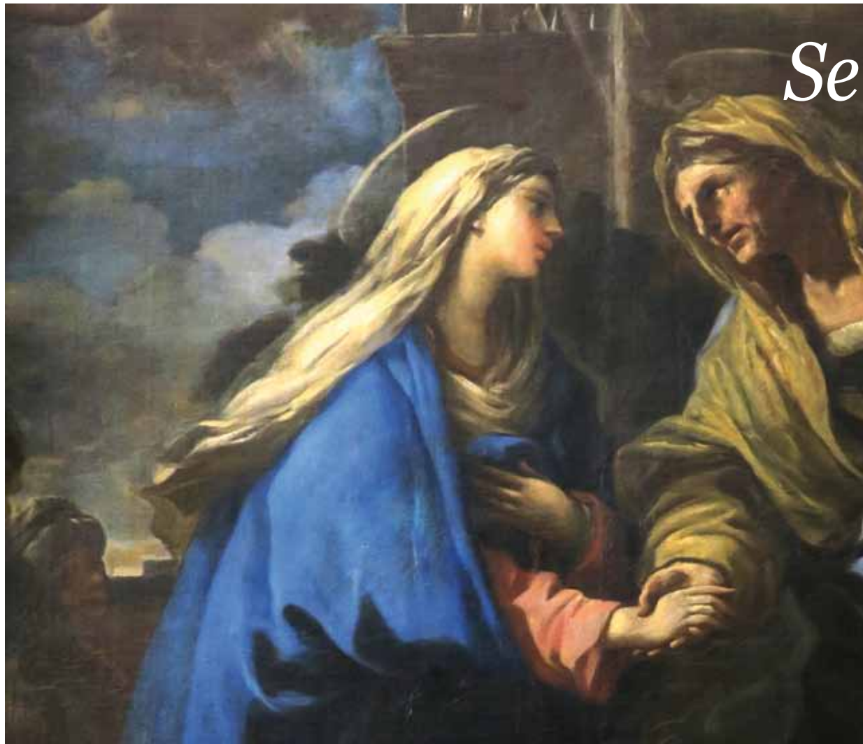
Detalle de «La Visitación», de Lucas Giordano, que se conserva en el camarín de la Virgen en el monasterio de Guadalupe, imagen del Plan Pastoral Diocesano

Así pues, el programa pastoral diocesano para este nuevo curso «es una invitación a la escucha y al discernimiento sobre estas tres importantes dimensiones de la vida eclesial. Y sus