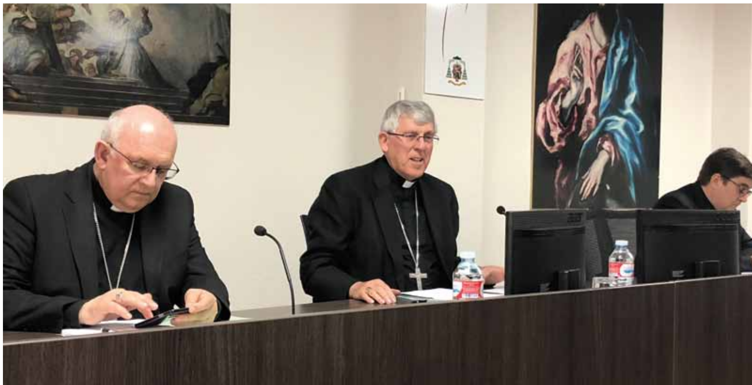
El Sr. Arzobispo y el Obispo auxiliar, durante la presentación a la Curia Diocesana del Plan Pastoral para el nuevo curso.

CLAVES QUE VERTEBRAN EL PLAN PASTORAL DIOCESANO PARA ESTE AÑO