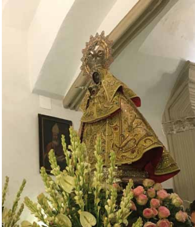
La imagen de la Virgen de Guadalupe, al comienzo de la procesión.